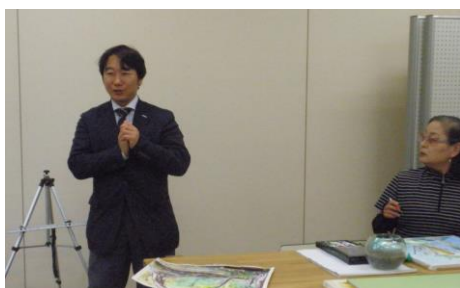
何ヶ月ぶりかの先生と出会い。少々ふっくらとした先生の姿・・・