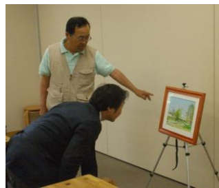
A氏の作品(油絵) 額は手作りとのこと。皆さん感心していました。先生からは画面上の比重(暗さ)のバランスをとの難しいコメント