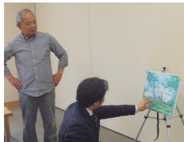
O氏の作品 パステルを使用して表現したとO氏。先生からは陰影の関係で描いた時間帯は？との質問が出ていました。