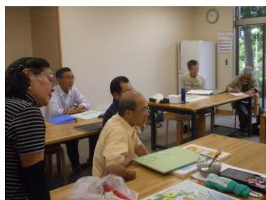
先生の講評を真剣に聞く会員の皆さん