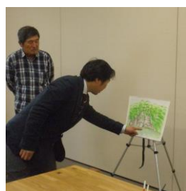
Y氏の作品 構図は良い。日本画風的なところがあり、透明水彩でない素材を使ってみたらどうなるか？と先生のコメントが・・・