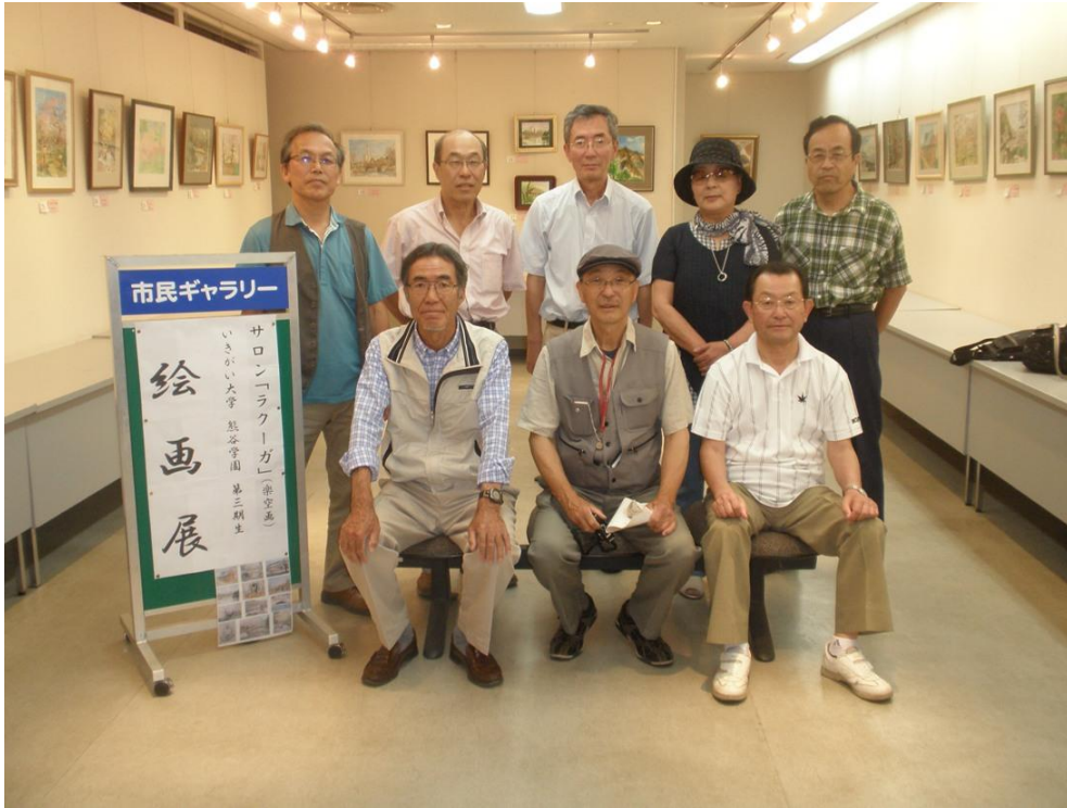
展示準備完了後に全員で写真を撮りました(残念ながら1名の方が出席できませんでした)