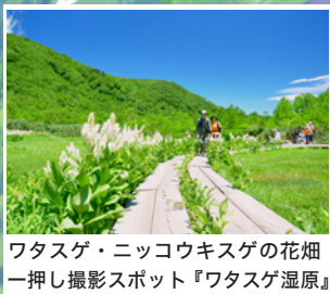
ワタスゲ・ニッコウキスゲの花畑 一押し撮影スポット『ワタスゲ湿原』