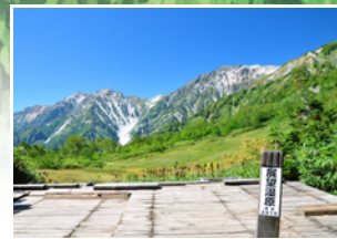
間近にせまる白馬大雪渓と 北アルプスの眺望 『展望湿原』