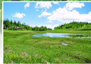
静寂に包まれた池に小さな浮島と 高山植物のお花畑 『浮島湿原』