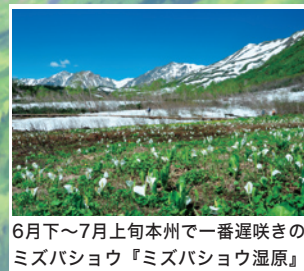
6月下旬～7月上旬本州で一番遅咲きの ミズバショウ『ミズバショウ湿原』