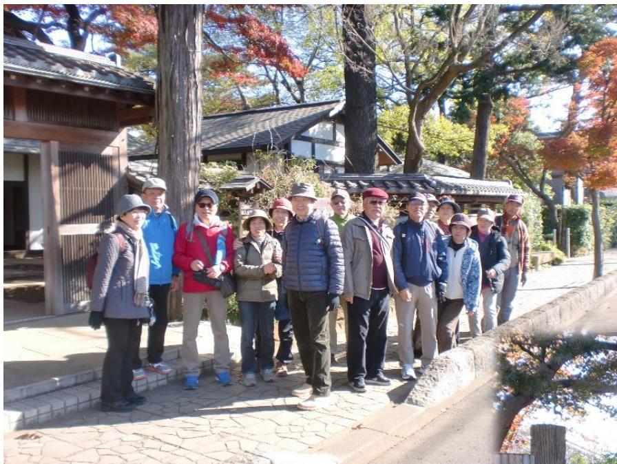
各自持参のお弁当で腹ごしらえを終わり、大宮公園へ移動前に、ちょっと撮影