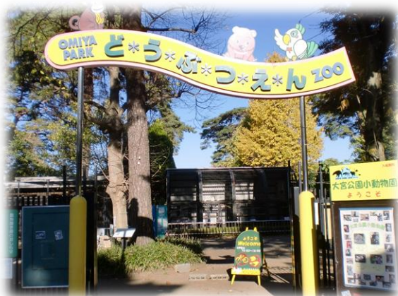
皆さん久しぶりに動物園へ