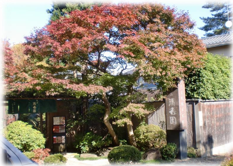
盆栽園 清香園(せいこうえん)