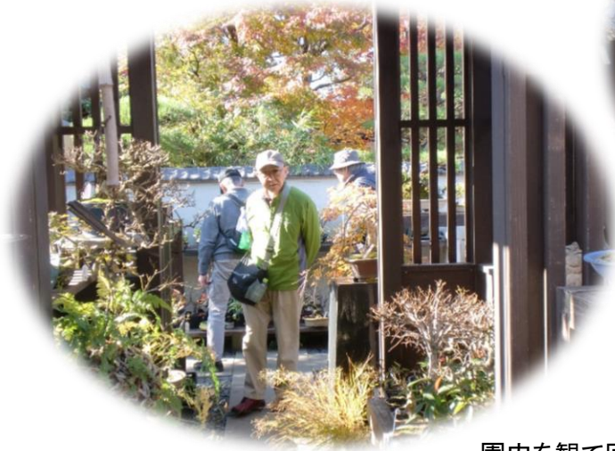
園内を観て回るJさん

各グループで盆栽園を自由に見学した後、休憩処の「盆栽四季の家」へ集合し、無料休憩所で三々五々昼食をとりました。