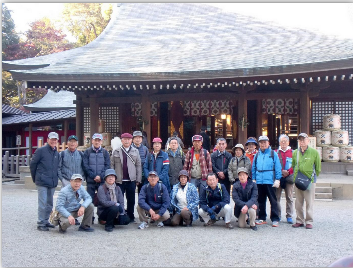
氷川神社本殿前にてハイキング参加20名全員で集合写真