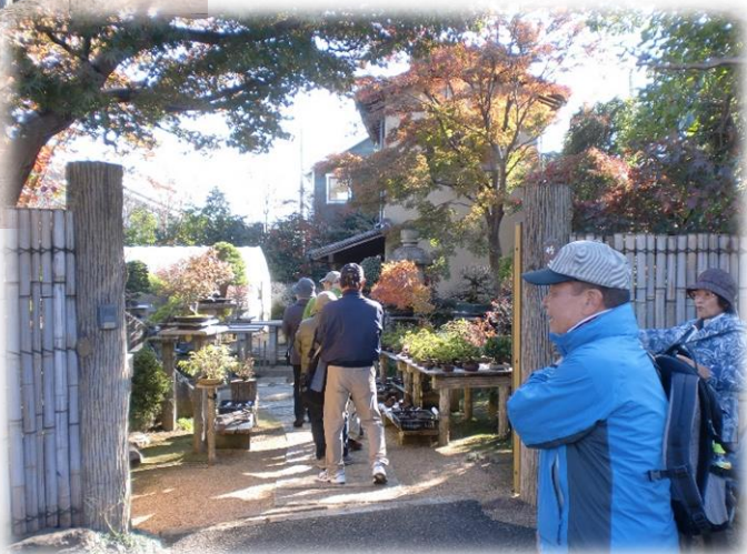
大宮公園へ移動前に、もう一つ盆栽園「芙蓉園(ふようえん)」を見学