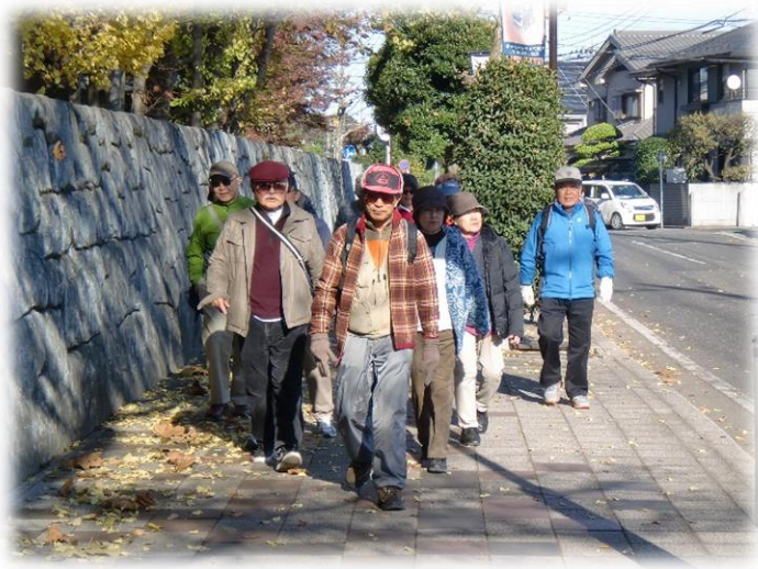
一行は大宮公園へ向かう。