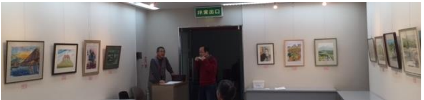
↑奥から入口側を見たところ