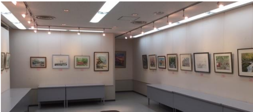
←入口から見たところ(正面と右側)