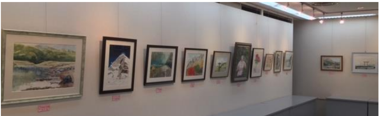
↓入口から左側を見たところ