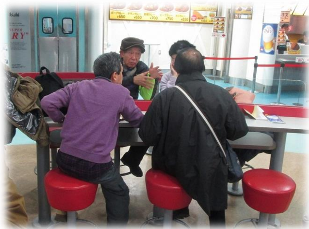
お昼はロッセリアのフードコートで、三々五々食事をしました。