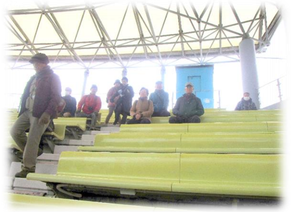
寒さに耐えながら見物する皆さん