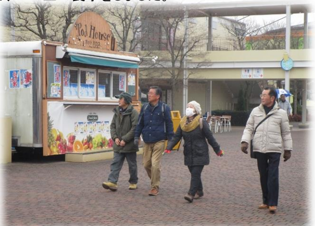
12:40 食事後、ドルフィンファンタジー館へ