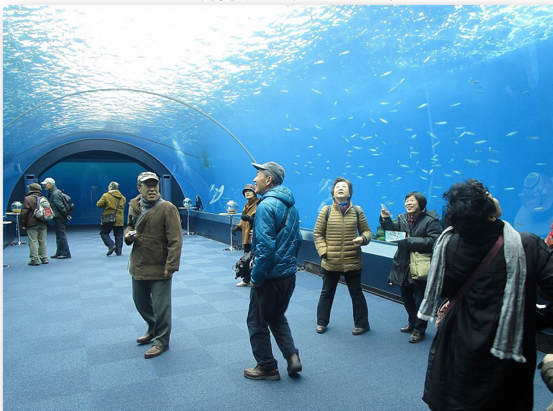
水中トンネルから魚、イルカの生態をみてワーツ ”自然の海”の体験と”癒し”を得られる空間でした。