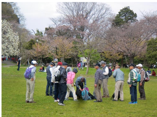
12:45 昼食も終わり出発準備