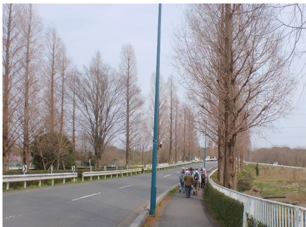
13:20 見沼大橋通りのメタセコイア並木