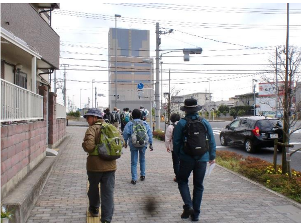
9:15 いよいよ桜並木の 散策に向けて出発