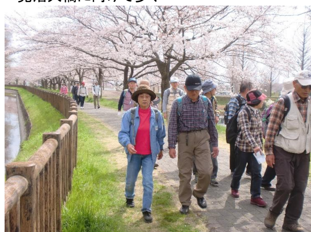
13:40 見沼自然公園の脇を通る