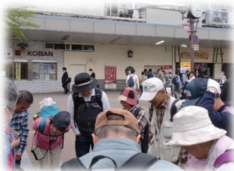
13:05 大宮駅東口にて解散「お疲れさまでした」

今回のハイキングは事前の予報では、曇りところによって雨がぱらつくとの事でしたが、予想に反し薄日もさして、絶好のハイキング日和となりました。 汗ばむほどの好天の中、ほぼ満開の桜を見ながら13km余りのハイキングが出来ました。 参加の皆さまお疲れさまでした。幹事の美工の皆さまありがとうございました。