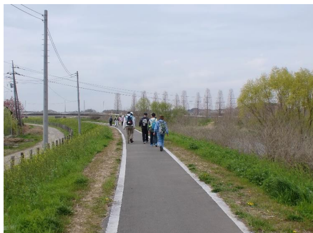
13:10 見沼代用水西縁と並行している芝川の土手を見沼大橋に向けて歩く