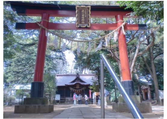
11:35 氷川女體神社 に到着