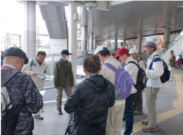
9:00 さいたま新都心駅に 集合、担当幹事の Oさんの説明を聞く 皆さん