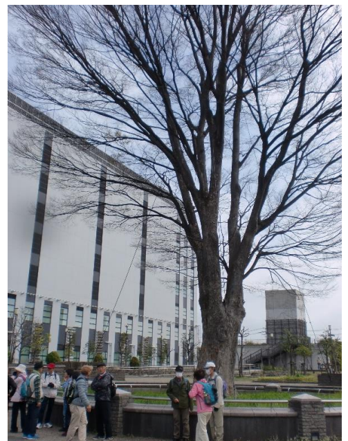
9:10 駅前の「コケーン広場」にある大樺 (樹齢約300年) (片倉工業元大宮製糸所にあったもの)