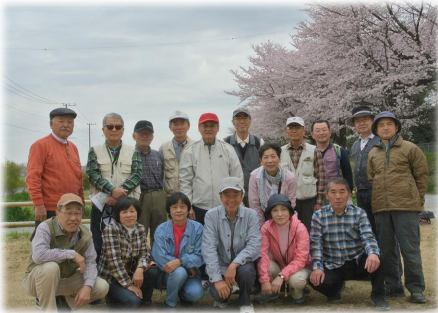
11:00 浦和博物館近くの 休憩所にて