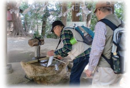
11:37 参拝前に手水で 清めるYさんとKさん