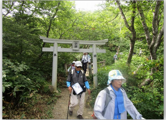
14:00 無事駐車場まで下山