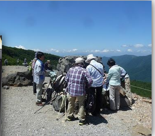
11:15(周) 牛ヶ首で小休止