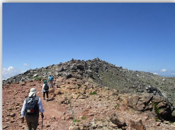
10:50(登) 頂上を目指して