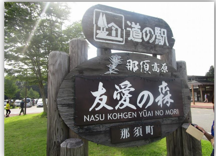
14:50 帰途途中の道の駅で土産物など購入

今回はお天気にも恵まれ、それぞれのコースで全員が無事に完歩でき、最高のハイキングが楽しめたと思います。参加の皆さま大変お疲れさまでした。