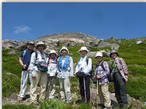
10:50(周) 茶臼岳を背景にして