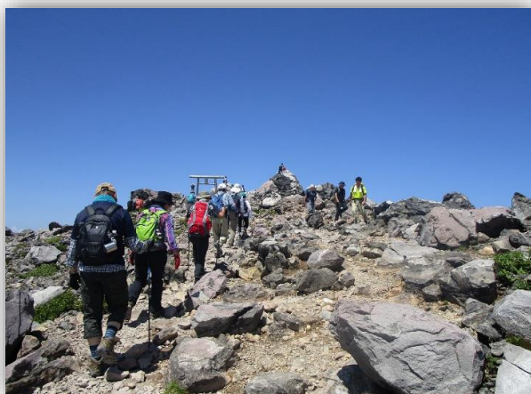
10:55(登) 山頂の鳥居が見えた