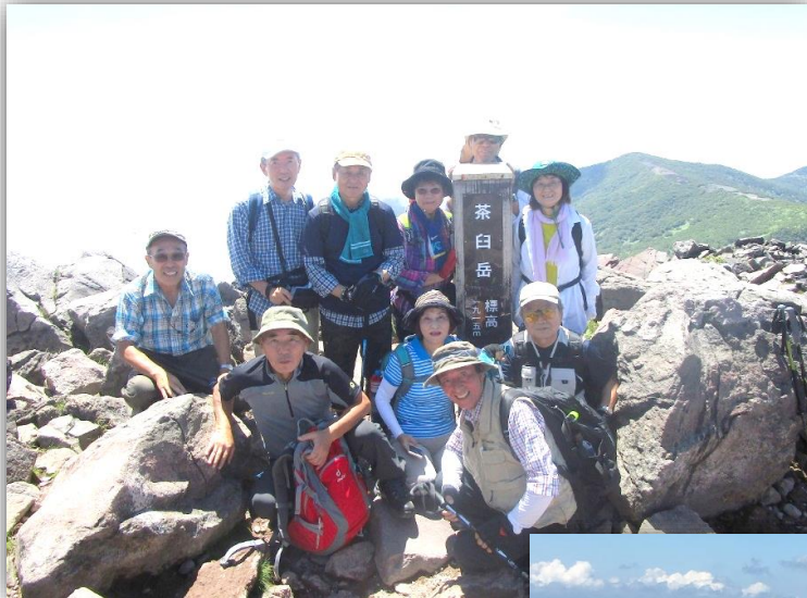
11:00(登) 登山組記念撮影