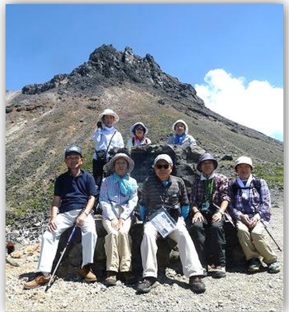
11:25(周) 周回組全員でハイ、チーズ