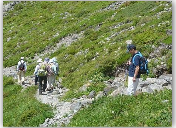
11:10(周) 高山植物を見ながら...