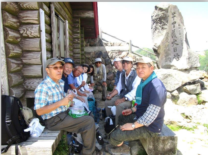
12:15 避難小屋脇にて昼食