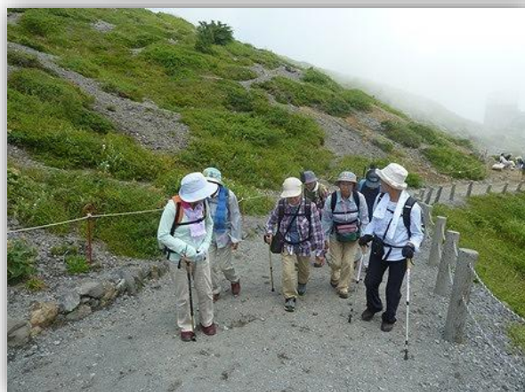
10:40(周) 登山道を談笑しながら進む