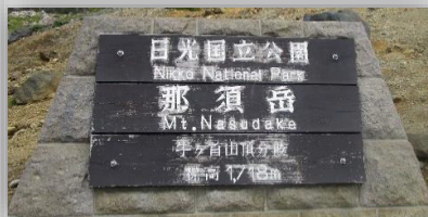
分岐点 10:20 登山組(登)と九合目 周回組(周)と別れて別行動