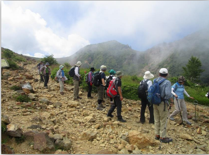
13:20 下山途中、山の風景に見とれる！？