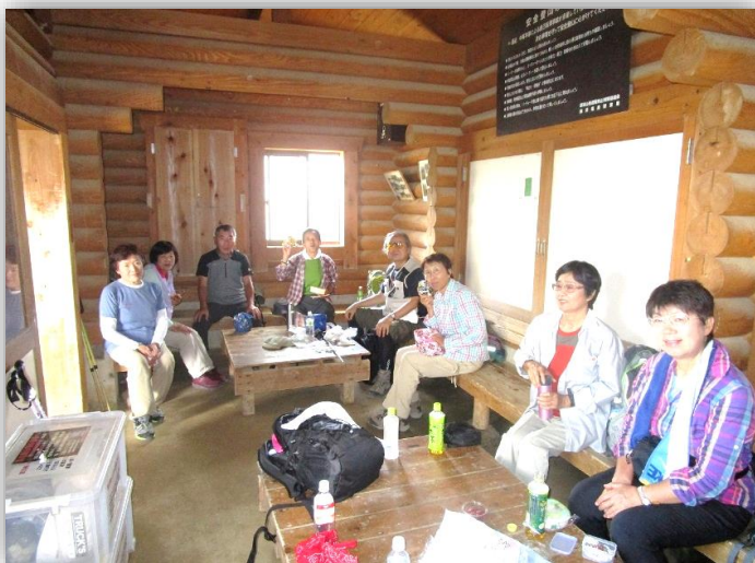
12:15 避難小屋にて昼食