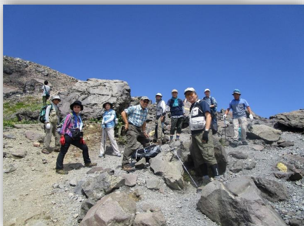
10:30(登) きつい登りで小休止