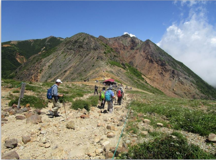
11:45(登) 峰の茶屋跡避難小屋まであと少し