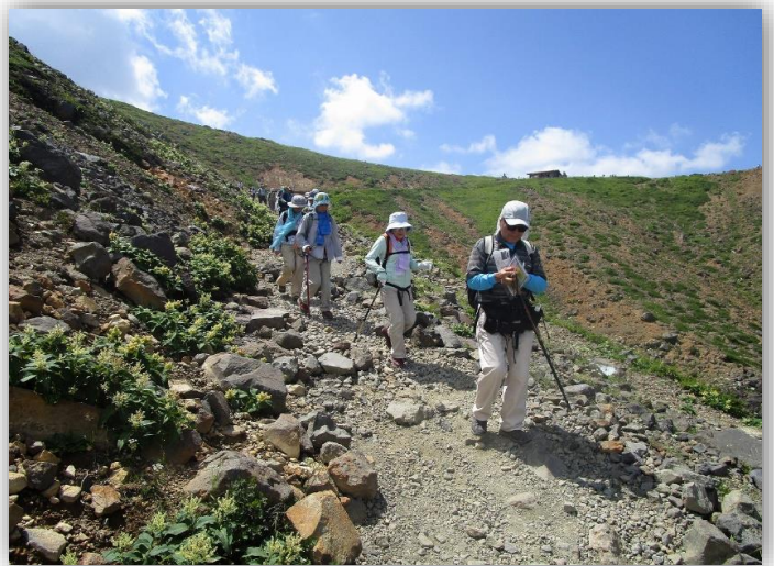
13:00 避難小屋を出発し、駐車場まで下る。