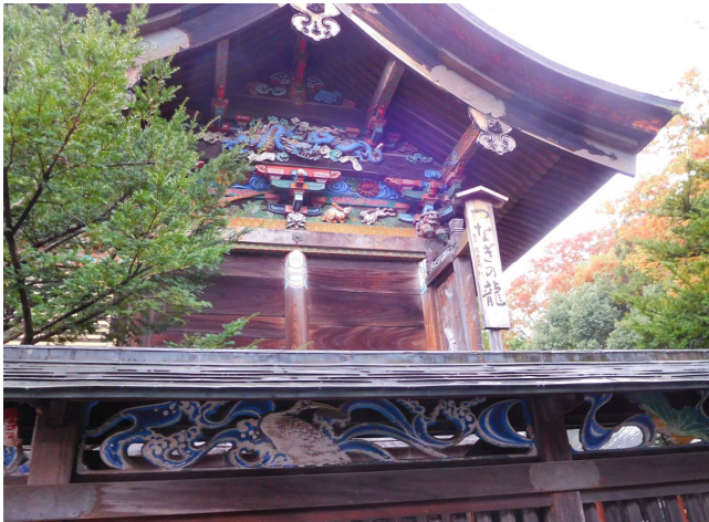
左甚五郎作の「つなぎの龍」