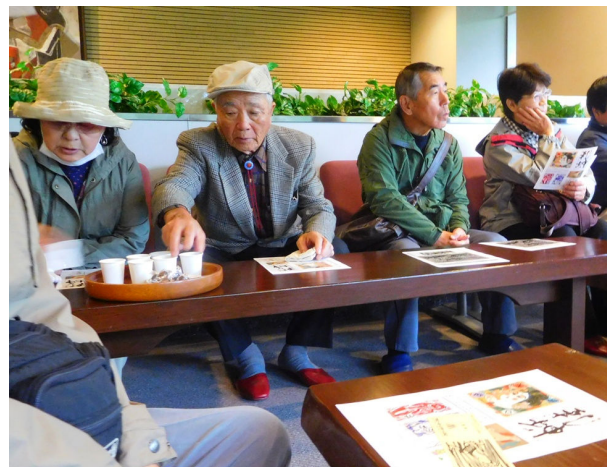
お茶とお菓子が出ました。

その後展示作品の鑑賞。これにも結構時間を掛けて見たので終わると 12:00 近くになってしまった。予定より 30 分遅れ。