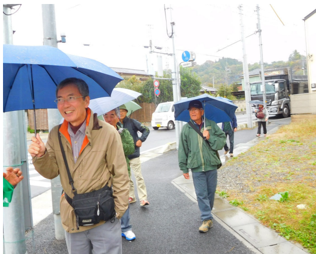
秩父神社を目指して。もう神社が見えています。

裸のお付き合いで、ゆったりと温泉につかり、日頃の疲れを癒しました。帰りは、西武秩父線の横瀬駅に向かい、秩父で乗換えの案もあったが、西部秩父線で時間的に適当な運行が無く、変更。雨も上がっていたので、「武甲温泉」から秩父駅へ向けて歩きました（約 2.5km）。途中少し雨が降ってきましたが、そのまま秩父神社まで歩きました。15：45 頃秩父神社に到着。秩父神社内を散策。