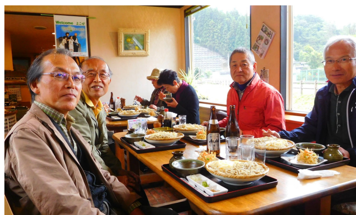
皆さん結局同じメニューになりました。