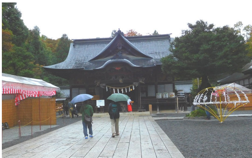
15：45 頃 秩父神社に到着