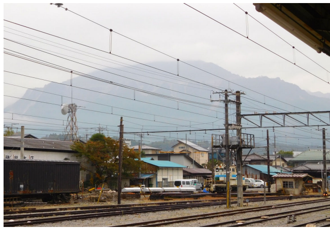
帰りに秩父駅から見た武甲山。一日中雲にかすんでいました。

私は用事があったので、秩父神社到着後失礼しお先に秩父駅へ向いました。秩父駅 16 : 02 発の電車で帰途に着きました。後で聞いたところ、次の電車がかなり遅れたとのことで（事故？）、皆さん帰宅が遅くなったようです。