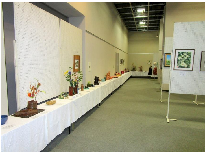
工芸品のコーナー