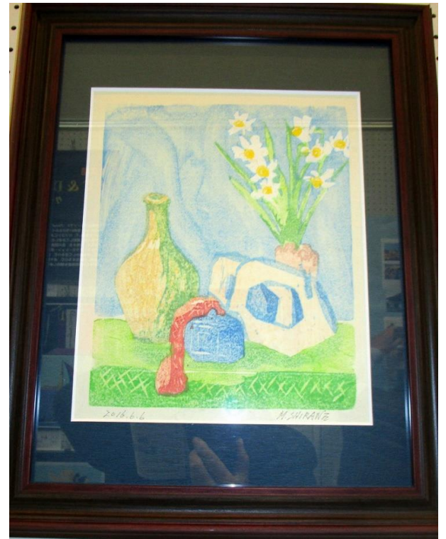
「駅鈴のある静物」白根 正雄さん ＜版画＞