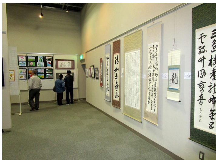
絵手紙・書のコーナー