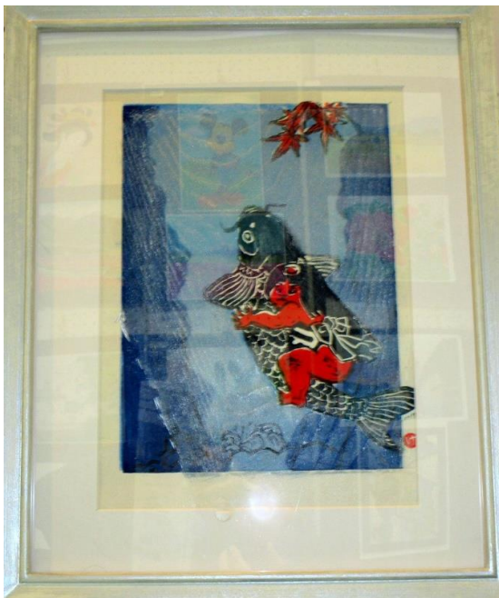
「金太郎の滝登り」大澤 健さん ＜版画＞