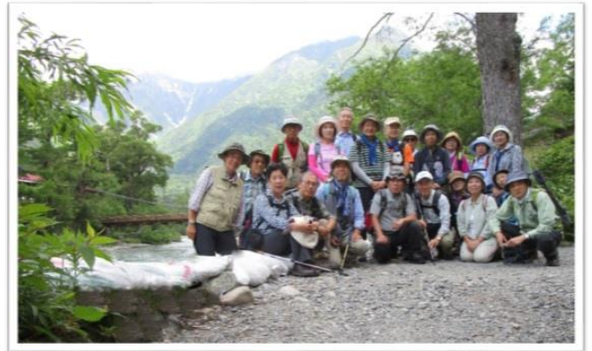
たっぷりハイキング組と 散策組に分かれる前に ハイッ (こっこり)