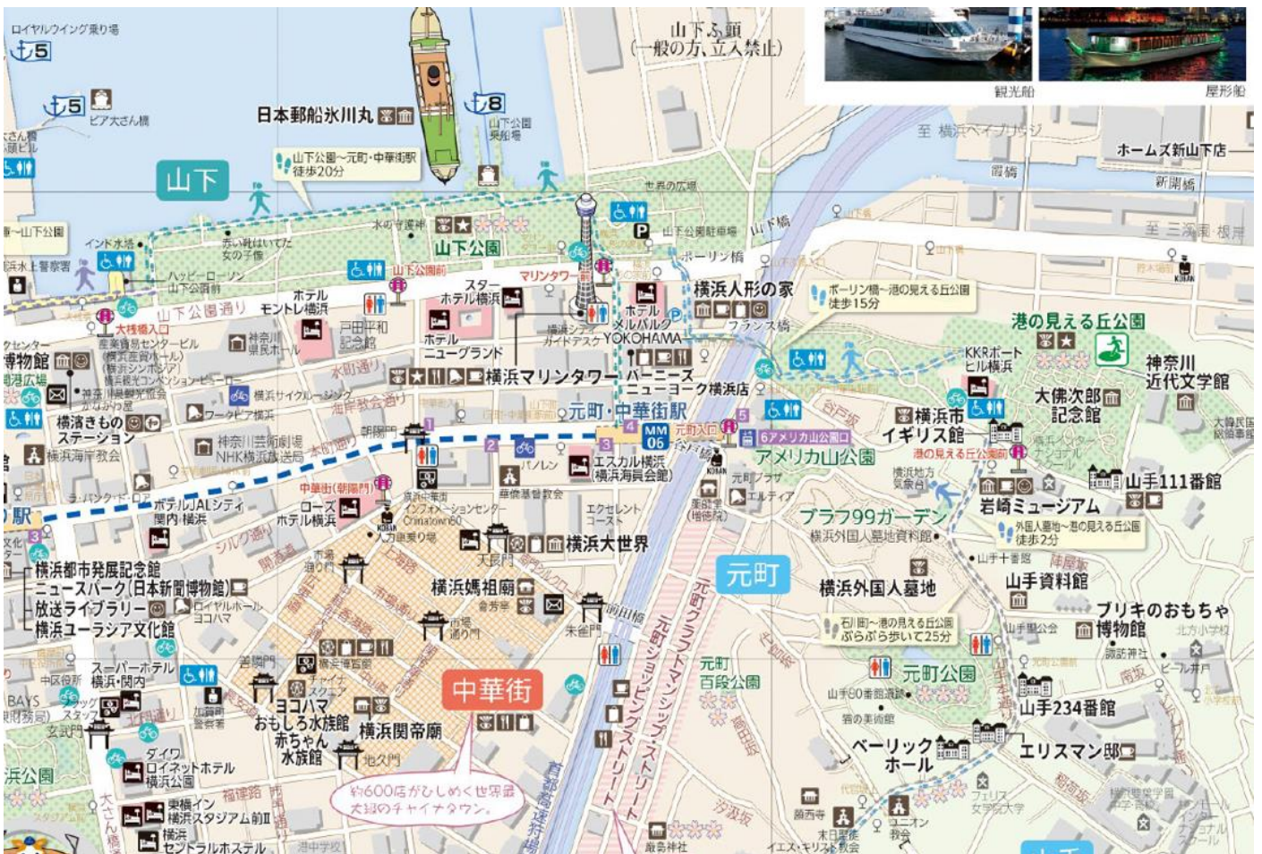
中華街 と 山下公園 概要

三溪園は生糸貿易により財を成した実業家 原 三溪によって、1906年(明治 39)5月に公開された。175,000m 2 に及ぶ園内には京都や鎌倉などから移築された歴史的に価値の高い建造物が巧みに配置されている。(現在、重要文化財 10 棟・横浜市指定有形文化財 3 棟)