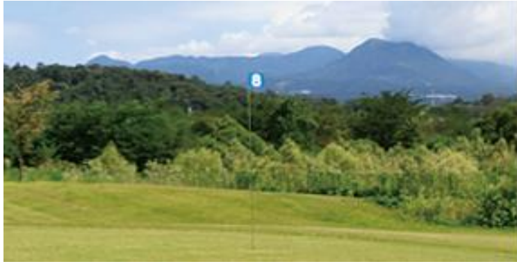
吉岡パークゴルフ場

10月21日、22日の両日、WACでは吉岡パークゴルフ場(群馬県)でのプレーと伊香保温泉、榛名神社のツアー パークゴルフは9名の参加で、温泉での宴会、紅葉狩りは8名の参加でした。