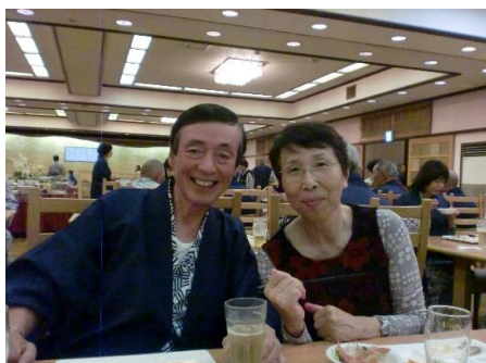
伊香保「金太夫」での宴会の1コマ