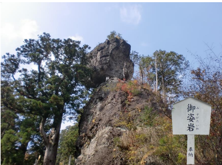
今にも落ちそうな岩(御姿岩)