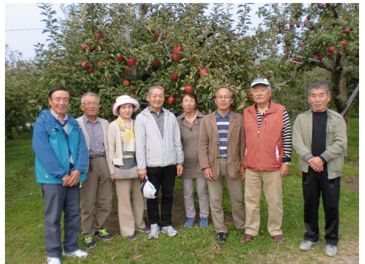
赤城リンゴ園にて

今回のイベント、いつもの吹上でのパークゴルフと異なり、雰囲気もコースも良いところで一日運動が出来て爽快な気分でした。