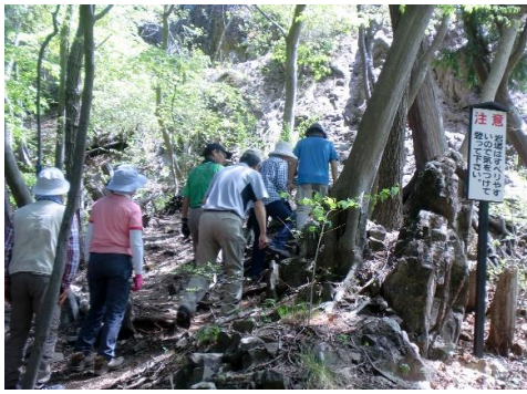
大天狗手前の東屋へ荷物を置き、いよいよ鎖場を大天狗へ登る