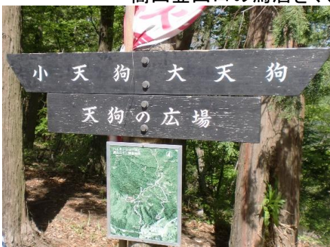
約40分で天狗の広場到着