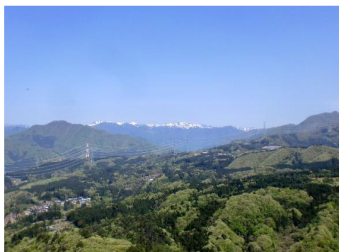
小天狗山頂から谷川連峰を望む