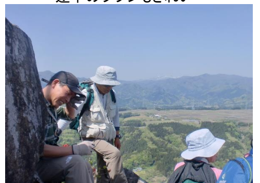
小天狗山頂で汗を拭うSさん