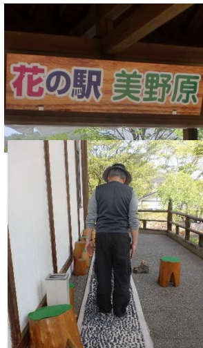
花の駅「美野原」へ寄ってフラワーガーデンを訪れる