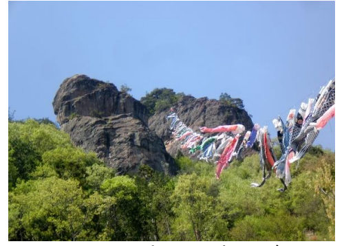
男岩からの鯉のぼり