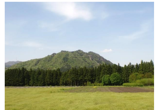
帰りのバス内からの嵩山全景

暑い一日でしたが、嵩山ハイキングと花の駅美野原の見学の楽しい時間が過ごせました。 参加の皆さま、担当の福祉・環境科の方々、ありがとうございました。