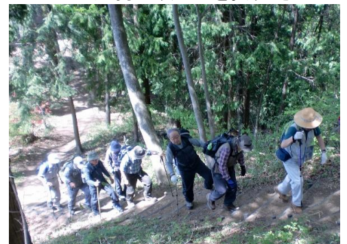
大天狗へ向かう一行