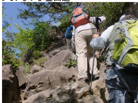
小天狗までの岩場上り