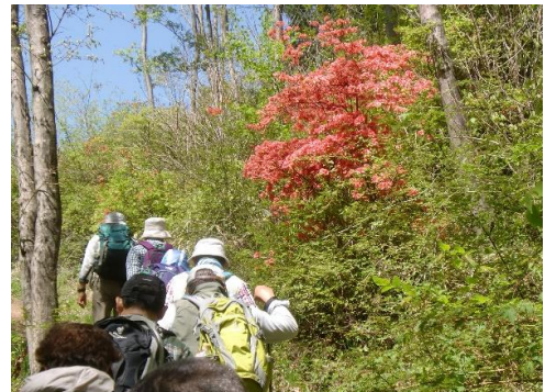
途中のツツジもきれい