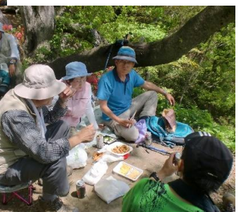
山頂から戻り楽しい 昼食タイム(11時)