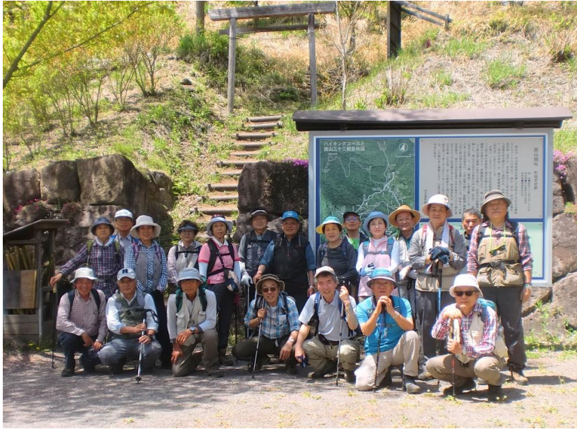
全員無事下山で再度 集合写真