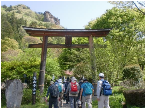
嵩山登山口の鳥居をくぐってよいよ登山道へ