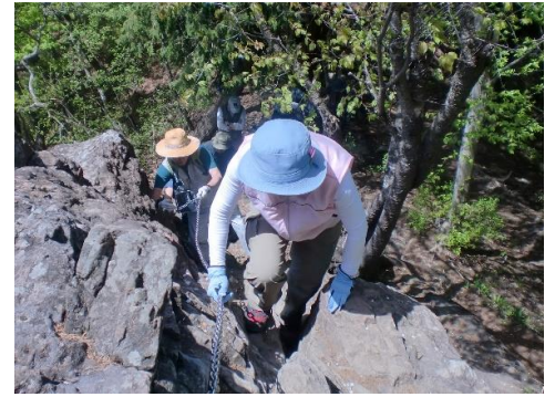
鎖をしっかり掴んで