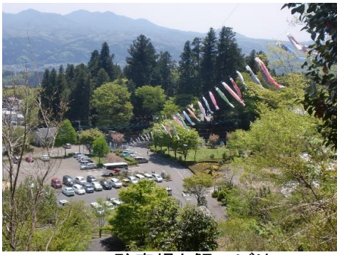
駐車場と鯉のぼり