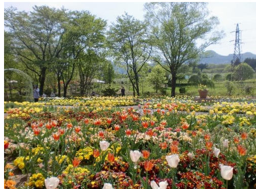
見事なチューリップガーデン