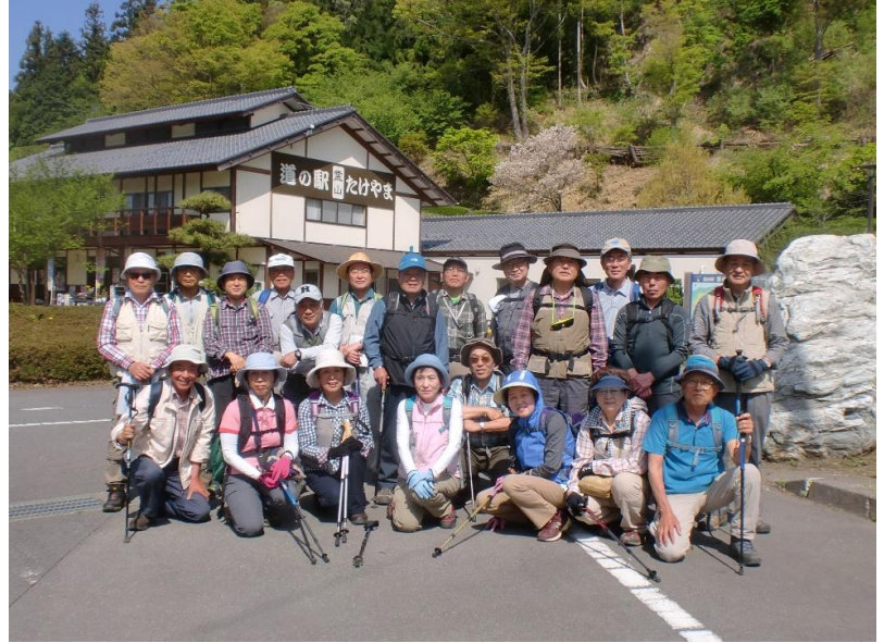
出発前に集合写真撮影