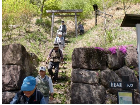
登山道入口まで無事到着