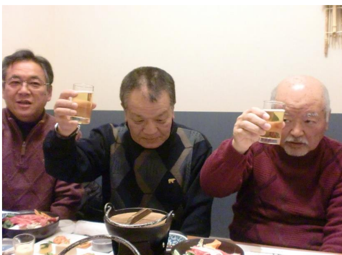
磯田校友会長による「乾杯！」でスタート