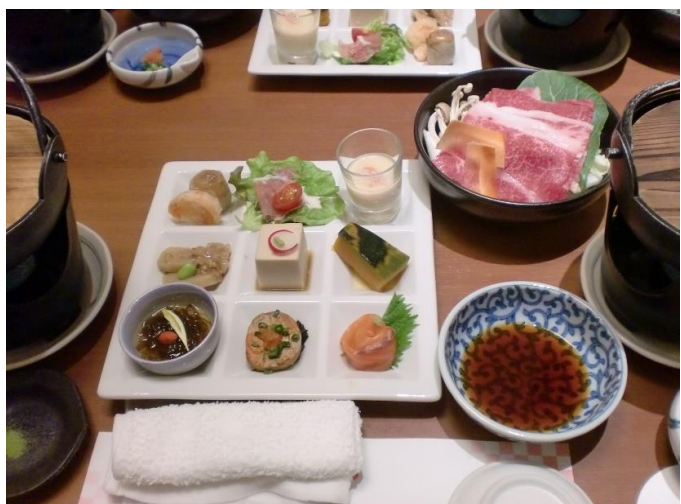
本日の料理の一部