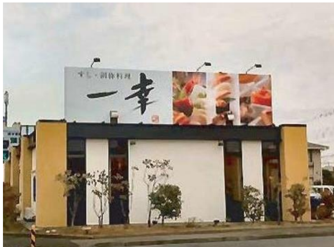
すし・創作料理 一幸・深谷店