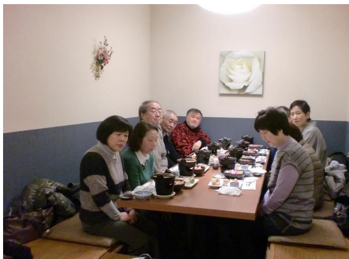
玉置さんのお話を神妙な表情で聞く