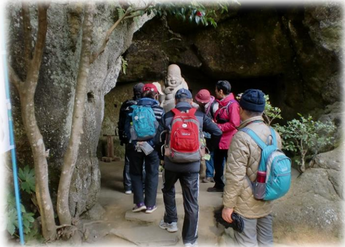
鎌倉七福神の一つ布袋様 お腹を触って健康祈願