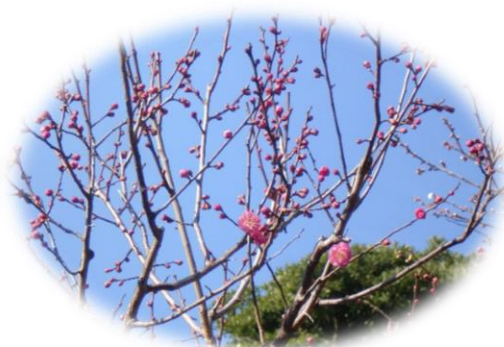
境内には可愛いフクジュソウや紅梅もチラホラ