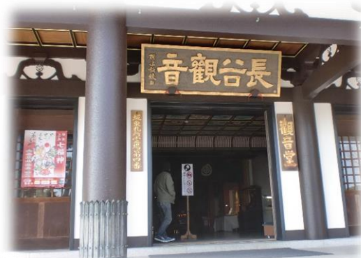
観音堂内部には三丈三寸(9m以上)の御本尊十一面観音菩薩像(木彫仏)が祀られている