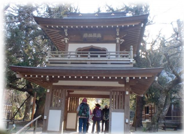
浄智寺鐘楼門 (北条宗政逝去の折り1281年頃創建)