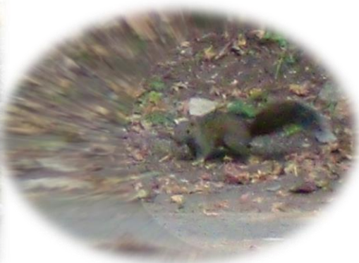
浄智寺の門前で見かけたリス