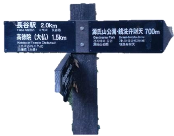
昼食前の最後の上り坂