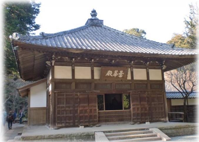
本堂(曇華殿(ドンゲテン))