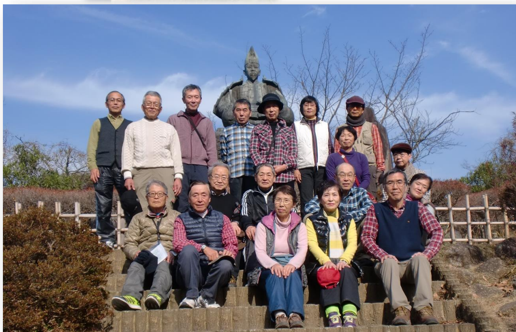
頼朝像前で集合写真