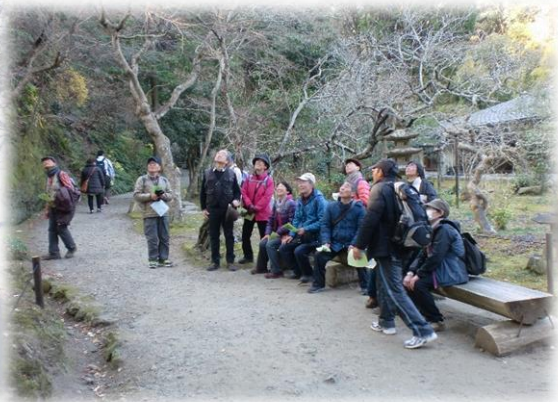
高野槇と付近を動くリスに夢中の一行