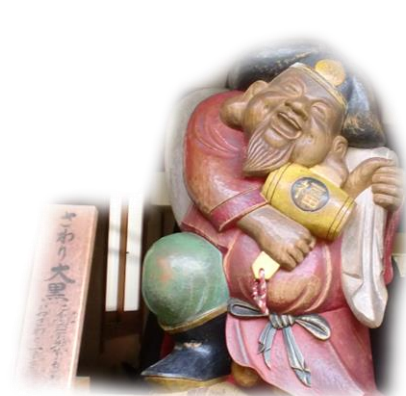
大黒堂内のさわり大黒