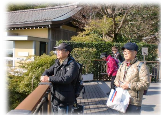
相模湾を眺めるSさん、Yさん