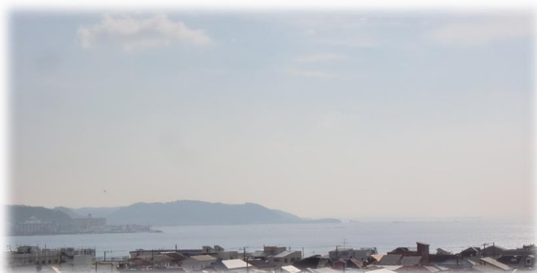
遠くに三浦半島まで見渡せる長谷寺からの眺望