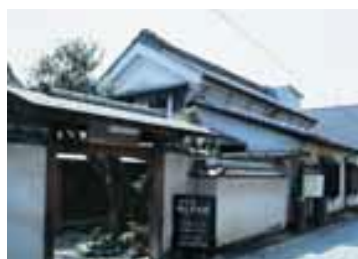
栃木市郷土参考館