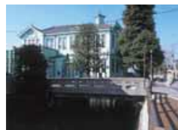
栃木市役所別館と県庁堀