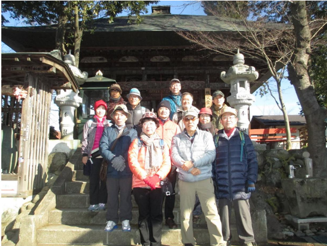
定林寺で 集合写真