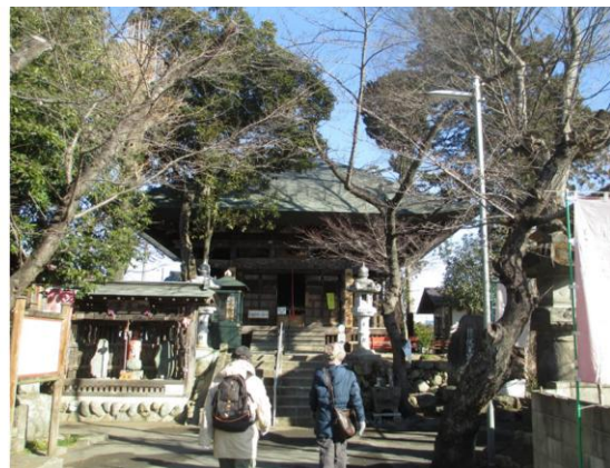
(定林寺に着きました。)