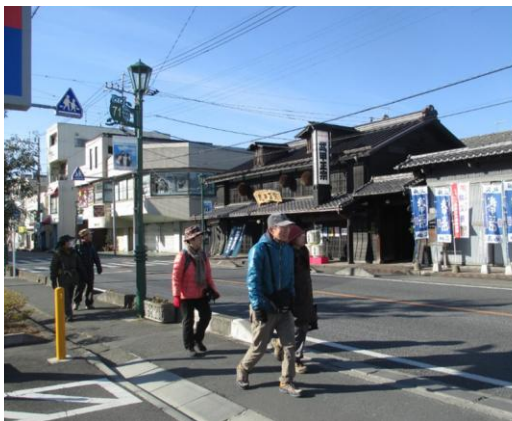
(秩父市内を歩きます。)