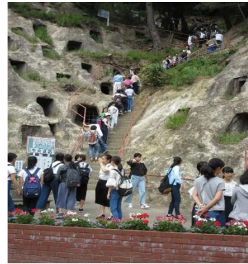
東京の女学生一行