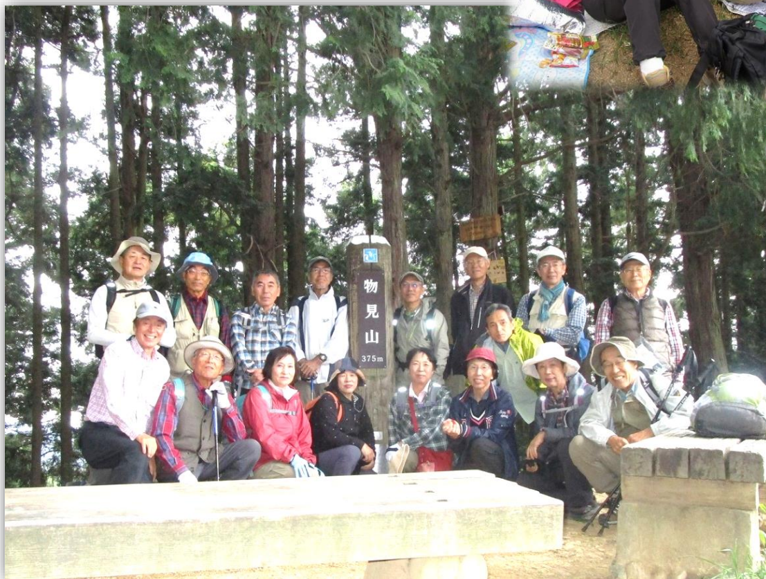
12:20 物見山頂にて 集合写真撮影