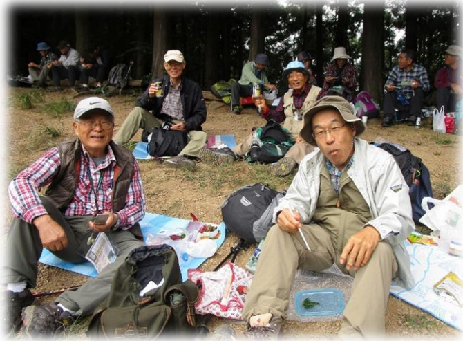
お天気が心配なため、お昼休みを40分に短縮