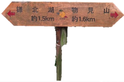
11:07 物見山まで1.6km地点 30分あまりで物見山に到着