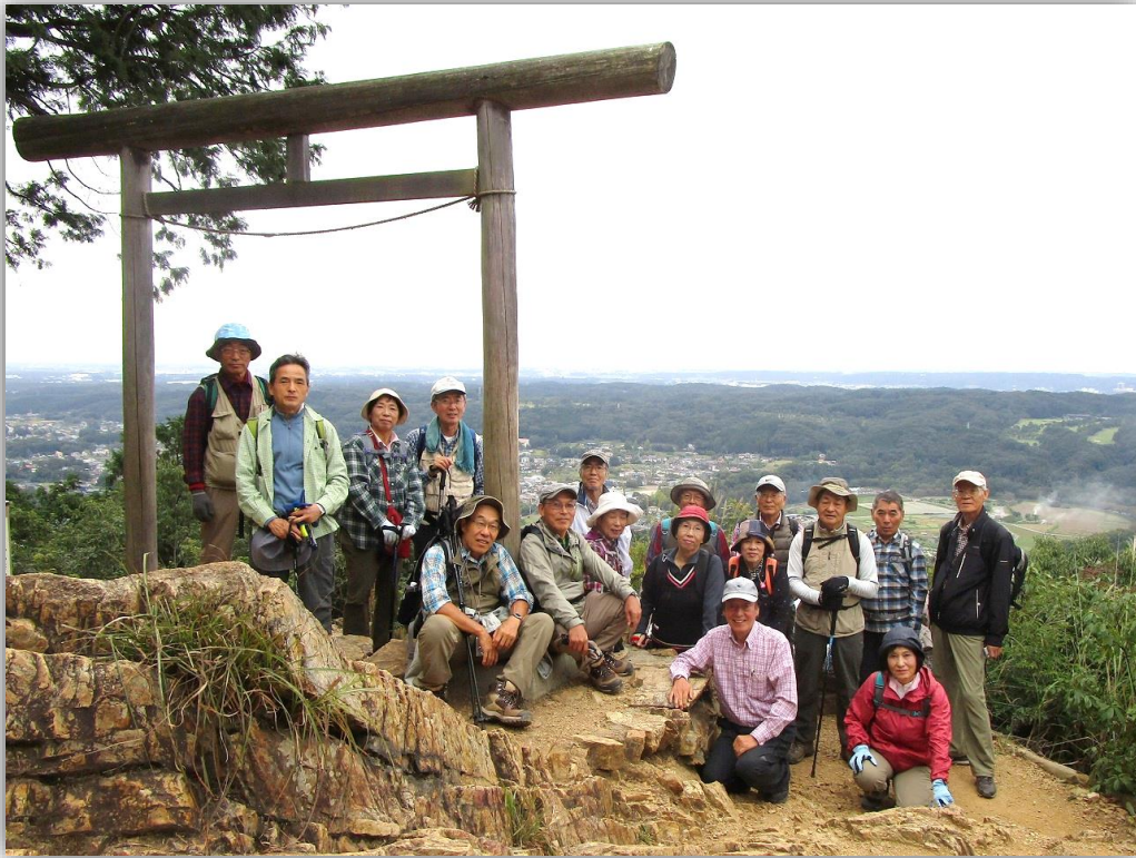
13:27 金刀比羅神社で集合写真 (後方は巾着田)