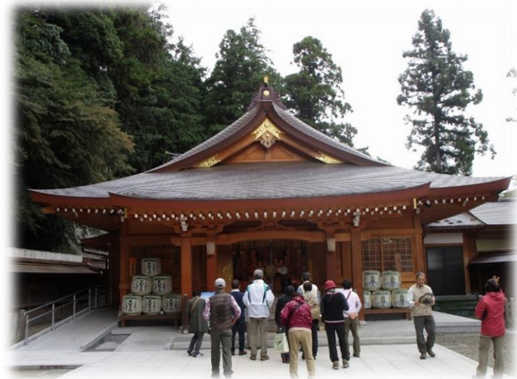
14:15 皆さんで高麗神社へ参拝