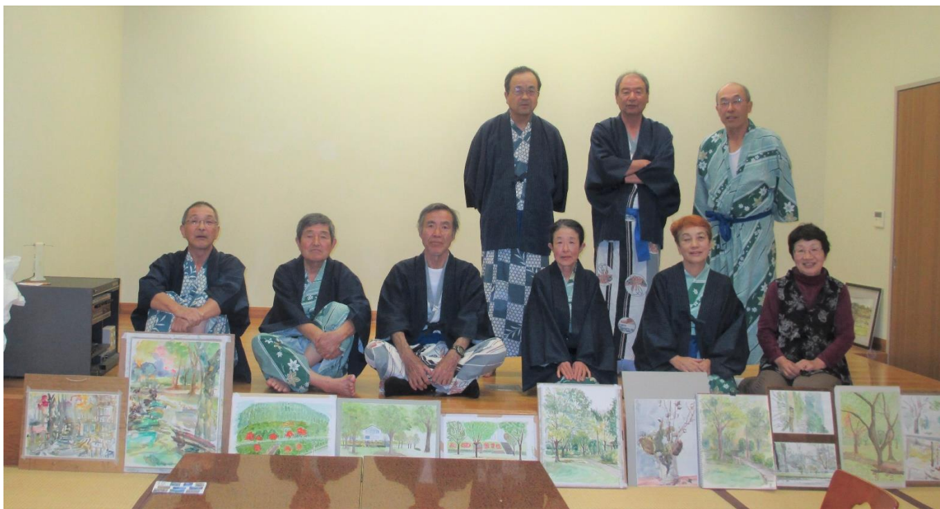
( 宴会の最後に、絵を並べて集合写真 )