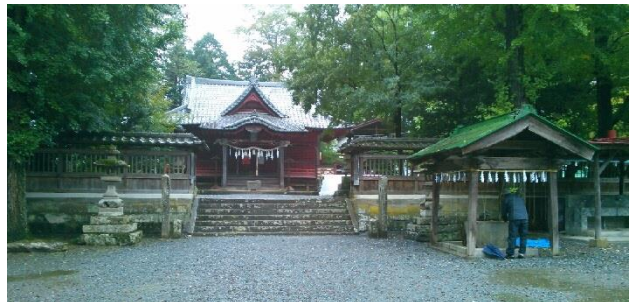
(棕神社 : むくじんじゃ)