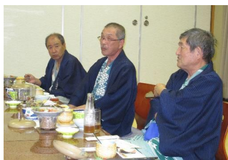
( 飲みながら、見ながら、喋りながら )