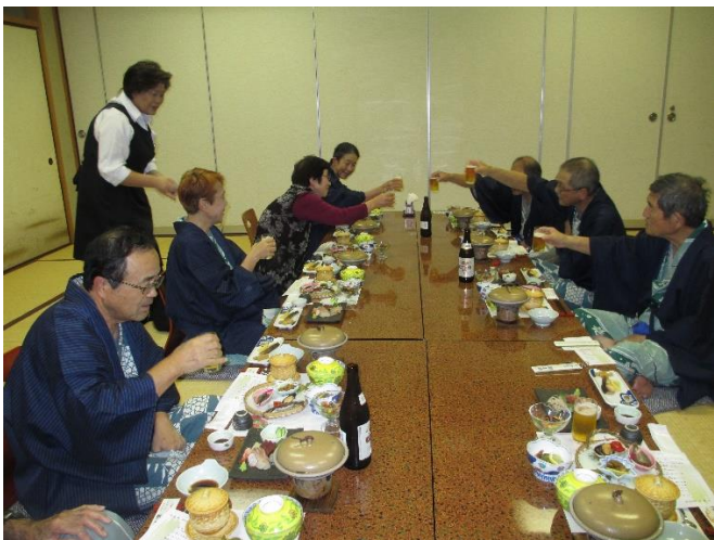
( 乾杯でスタート )

温泉につかった後は宴会。今年は人数も多く個室だったので、恒例の絵の批評会を、宴会場で行いました。