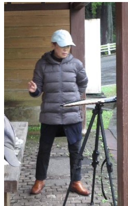
( 写生中の面々 )