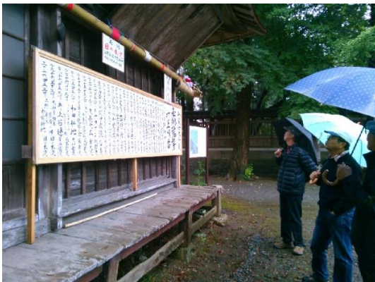
(龍勢まつりの打上順、上の竿が龍勢)