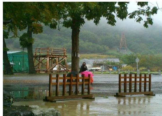
(奥の山の中腹に龍勢の打ち上げ台)

その後、「みどりの村」へ行って写生をしました。 ただし、雨が降り続けているので、屋根の下限定です。