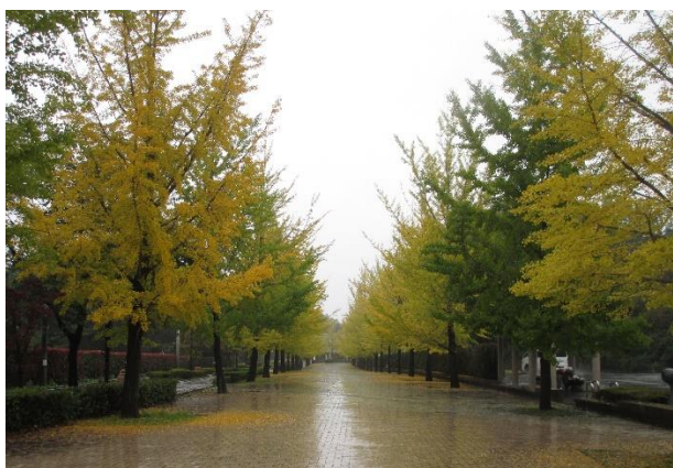
( 銀杏の木は、かなり紅葉していました。 )