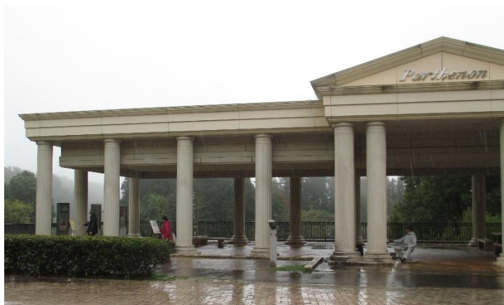
( 屋根を探して写生です。3人います。 )