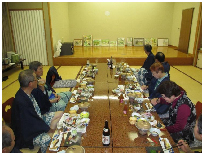
( ステージに、今日描いた絵を並べて肴に )