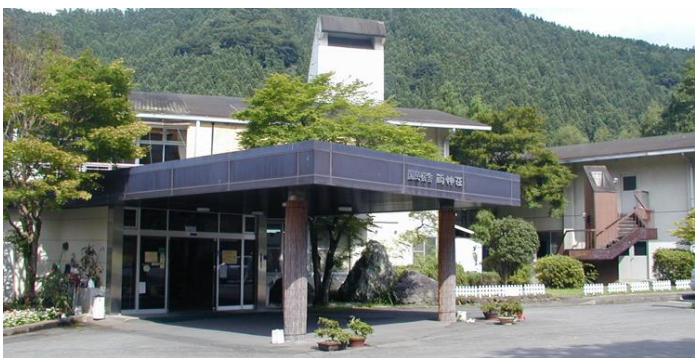
( 国民宿舎 「両神荘」 )

温泉につかった後は宴会。今年は人数も多く個室だったので、恒例の絵の批評会を、宴会場で行いました。