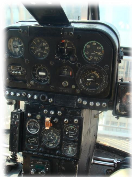
消防ヘリコプターとそのコックピット 操縦桿は1本のレバーで難しそうでした