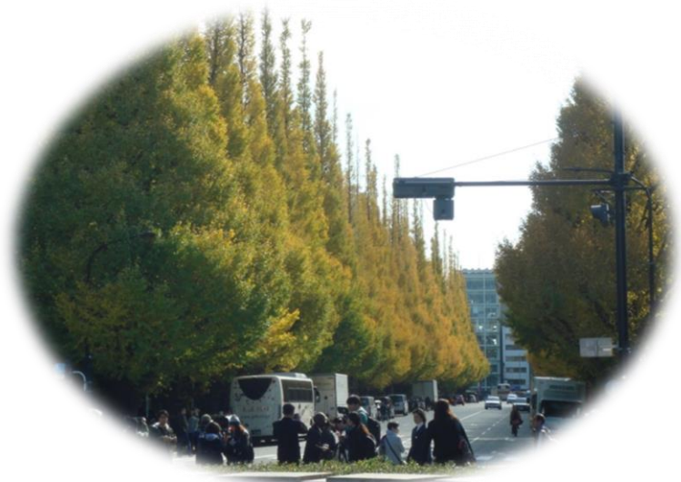
いちよう並木は黄金色に輝いていました