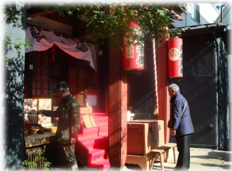
お岩様をお祀りしているお岩稲荷陽運寺 悪縁を除き、良縁を招く縁結びにご利益になるとのことで、若い女性の参拝者も多いとか。