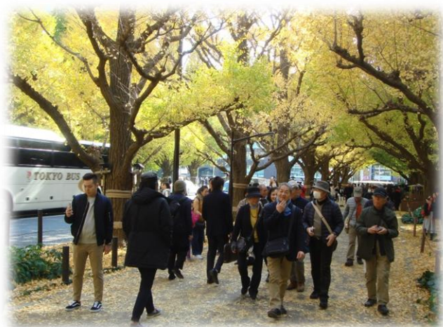
いちよう並木を散策