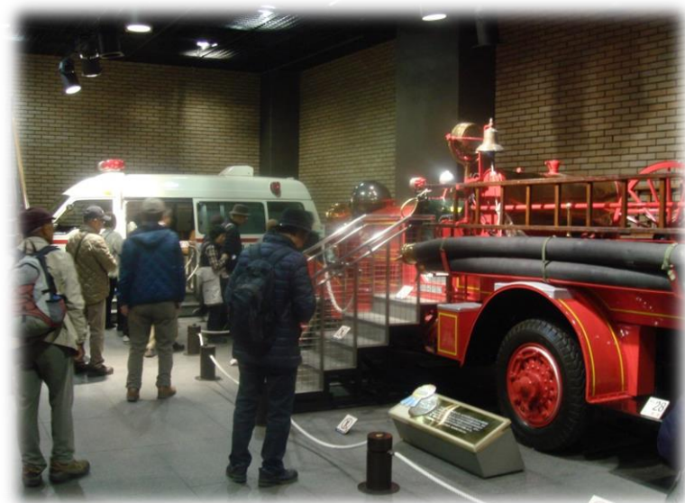
消防博物館を見学 江戸時代からの消防の歴史が学べました