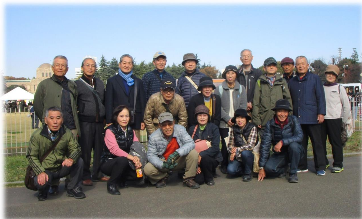
いちよう祭り会場前で記念撮影