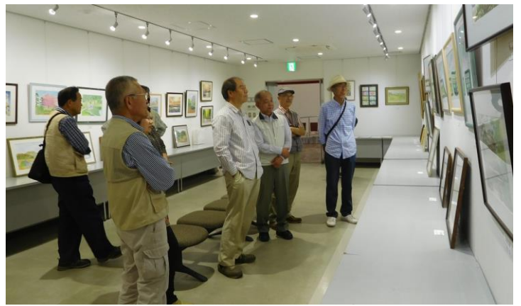
↑ 最終日の講評の様子