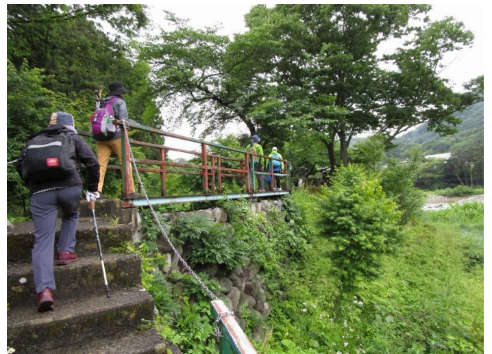
遊歩道は階段を昇ったり下りたり・・・