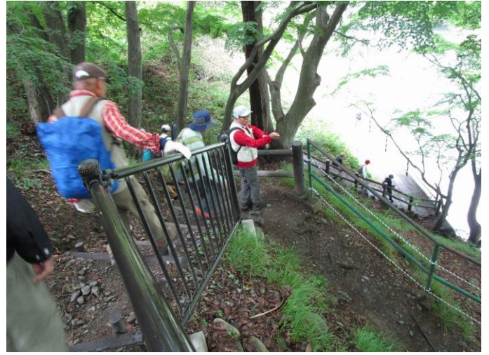
10:35 溪流沿いの遊歩道を昇ったり降りたり