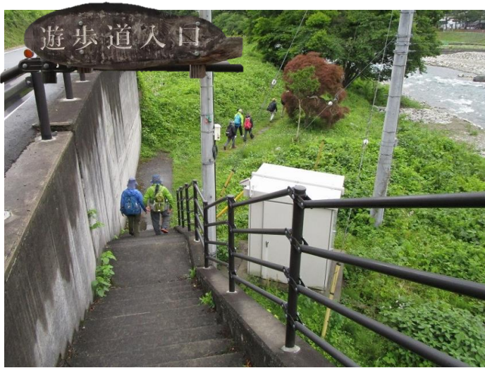
10:05 川沿いの遊歩道へ向かう一行