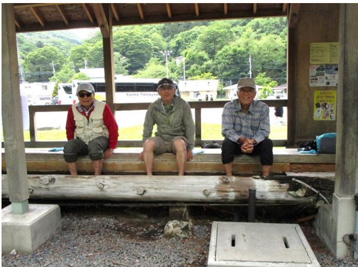
足湯につかるYさん、Sさん、Kさん