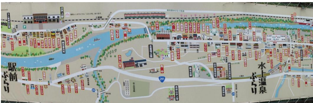
温泉街には街並み散策用の案内看板がありました。