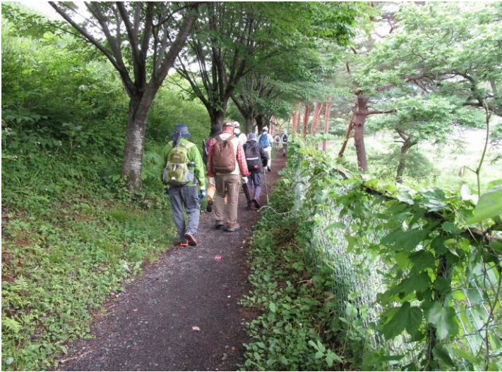
12:15 緑に囲まれた遊歩道を清流公園へ向かう一行