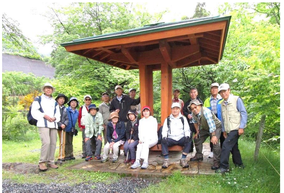
10:20 笹笛橋左岸にある東屋にて小休止、集合写真 (中央部で左右別撮影の2枚を重ねて合成しました)