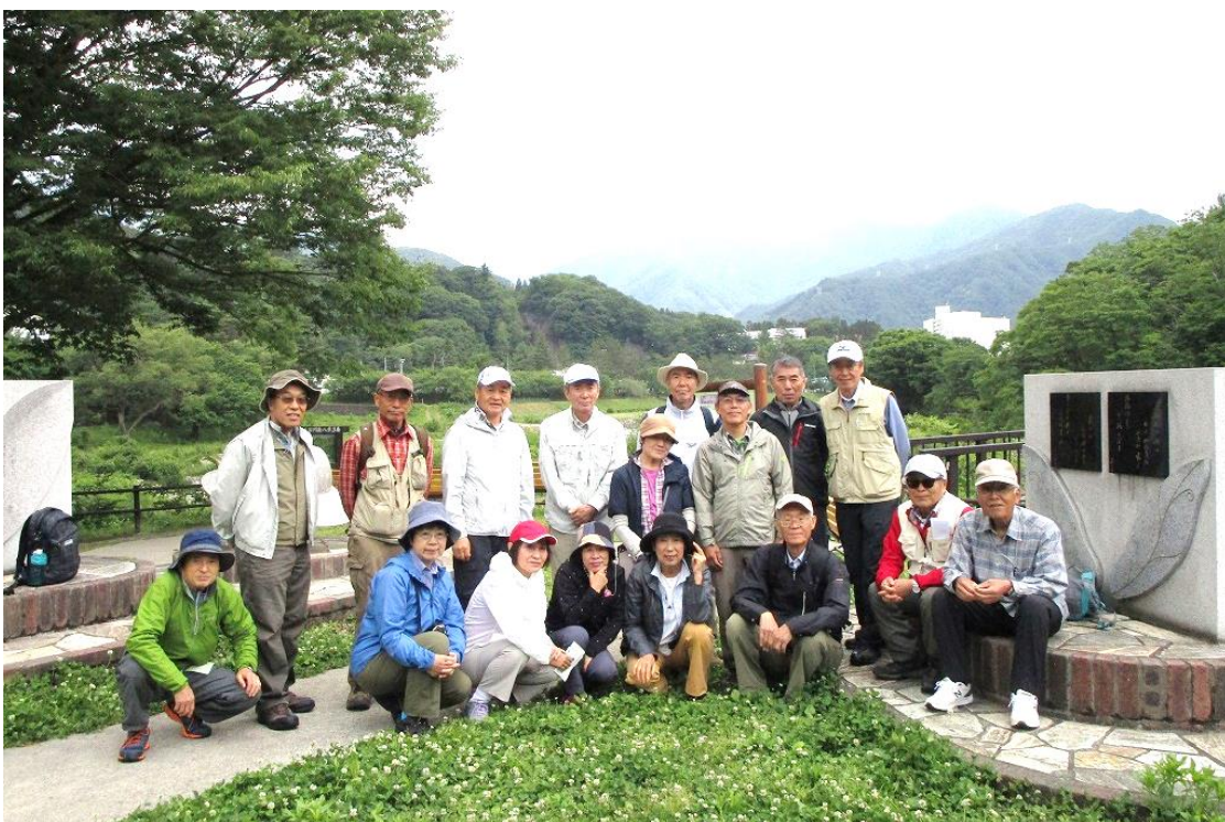
12:10 昼食後、出発前に集合写真