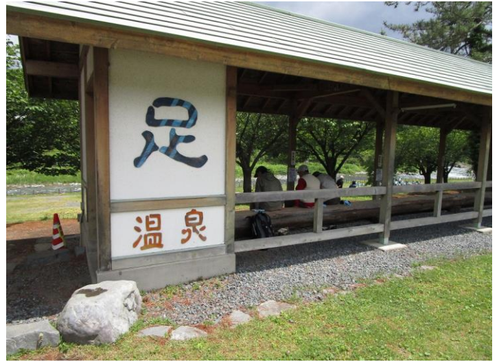
清流公園にある足湯 足ふきタオルも用意されていました。 少々、ぬるめのお湯でした・・・