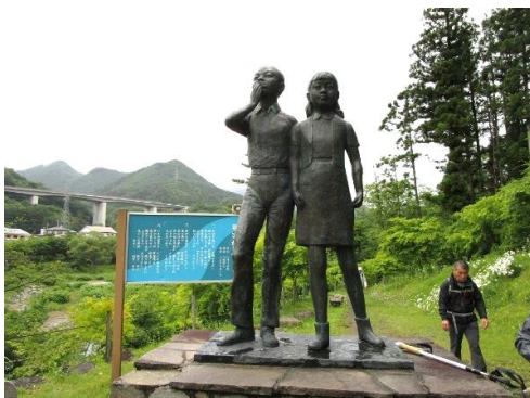
10:15 笹笛橋脇の笹笛を吹く少年・少女の像 (笹笛童子の像)