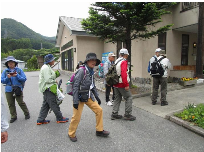
13:30 帰途、「ふれあい交流館」前にて解散、4名の方は温泉へ