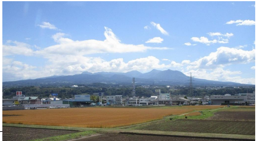
8:47 沼田付近からの赤城山 埼玉からの山姿とは違った山に見えます