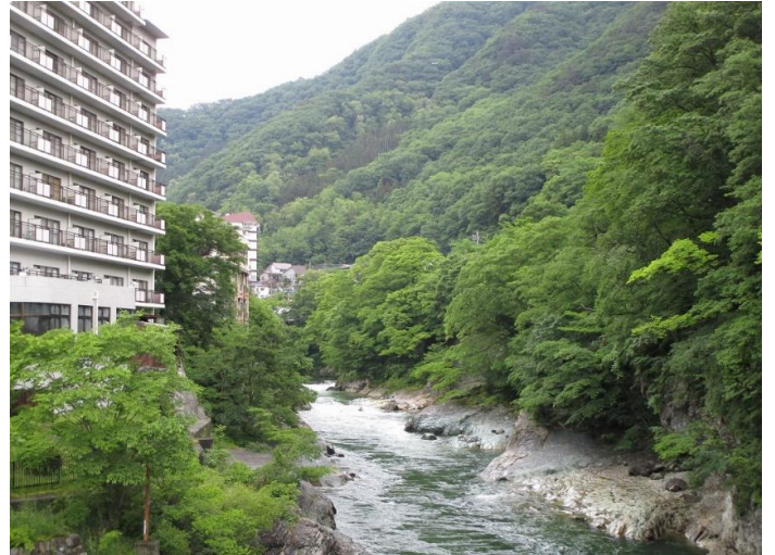
10:00 紅葉橋から利根川上流を望む