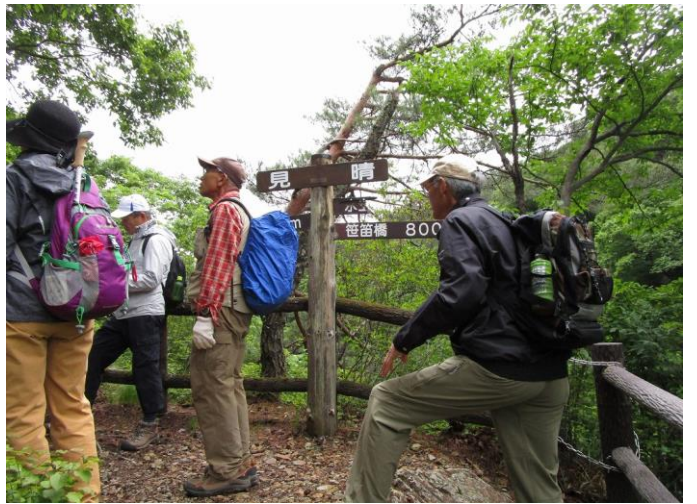
10:40 終点の見晴 (この先は春、秋のシーズンのみ解放され 6/1より閉鎖されていました。)