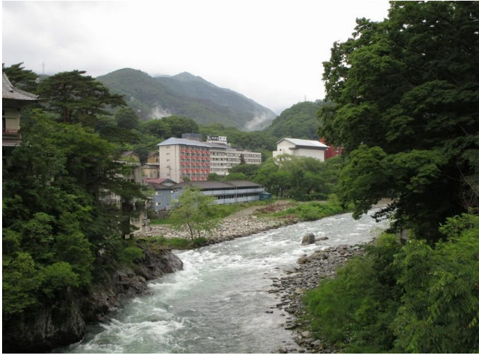
9:45 湯原橋よりの荒川の溪流