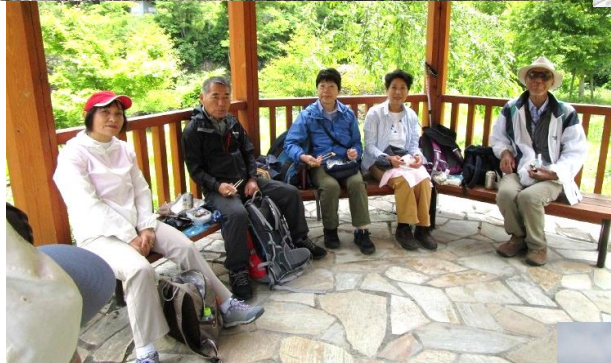
11:25 笹笛橋たもとの 与謝野晶子歌碑公園にて昼食