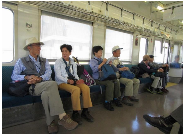
高崎から水上まで上越線は空いていました