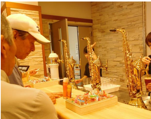
本物のサクソホンを使用したビールサーバーで注いでいただきました。