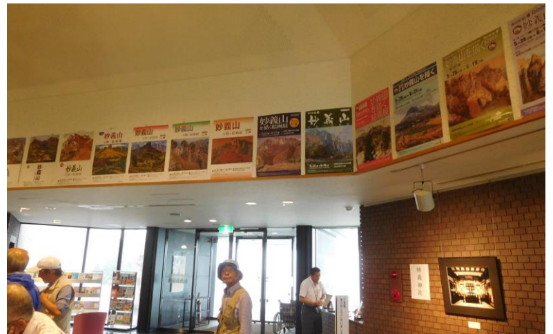
↑エントランスホールには「妙義山を描く絵画展」のポスターが第1回(S58年)から35回まで貼られていました。