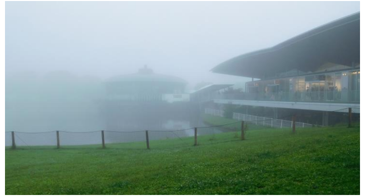
昼食後 時間が有ったのでイーストの方まで散策。(左) 12:50頃 ガーデンモール辺り (右) ニューイースト 入口付近 奥の建物は「軽井沢高原ビュッフェ晴れた空のテラス」 ガスがかって幻想的でした。

軽井沢を 13:40頃出発し、R18号で峠を越えて「妙義ふれあい美術館」を目指す。14:15頃ふれあい美術館に到着。