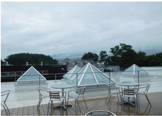
このピヤホールからは浅間山が見えるとのことでしたが、この日は雲に隠れていました。残念！