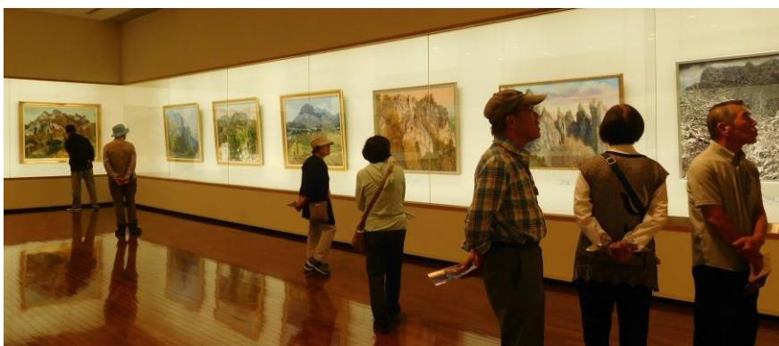
(左上下)常設展示室には入賞作品が展示されていました。皆さん作品に見入っていました。