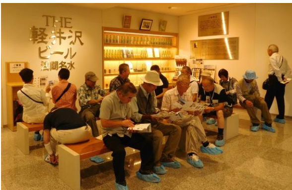
工場見学の準備(靴にビニールカバー)をした後、ホールで待つ(9:20頃)。

佐久ICで降りて軽井沢ブルワリーには予定より若干早く9:10ごろに到着(9:30~の予定)。