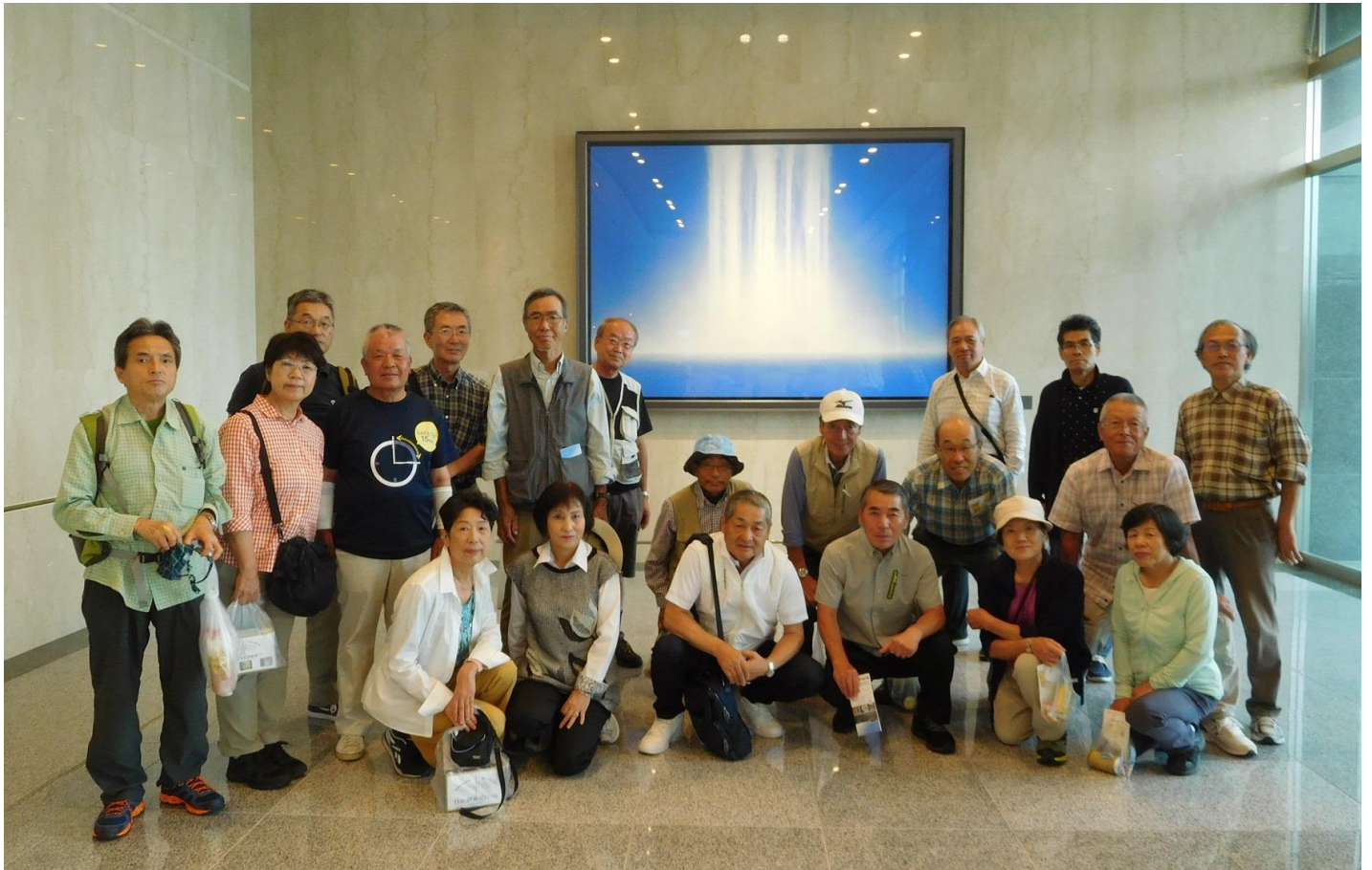
軽井沢ブルワリーを後にする前に、エントランスホールの千住博画伯の絵の前で集合写真

10：30 過ぎ軽井沢ブルワリーを後にしました。バスは今回利用した BM 観光のバスです。広くてゆったりとしていました、