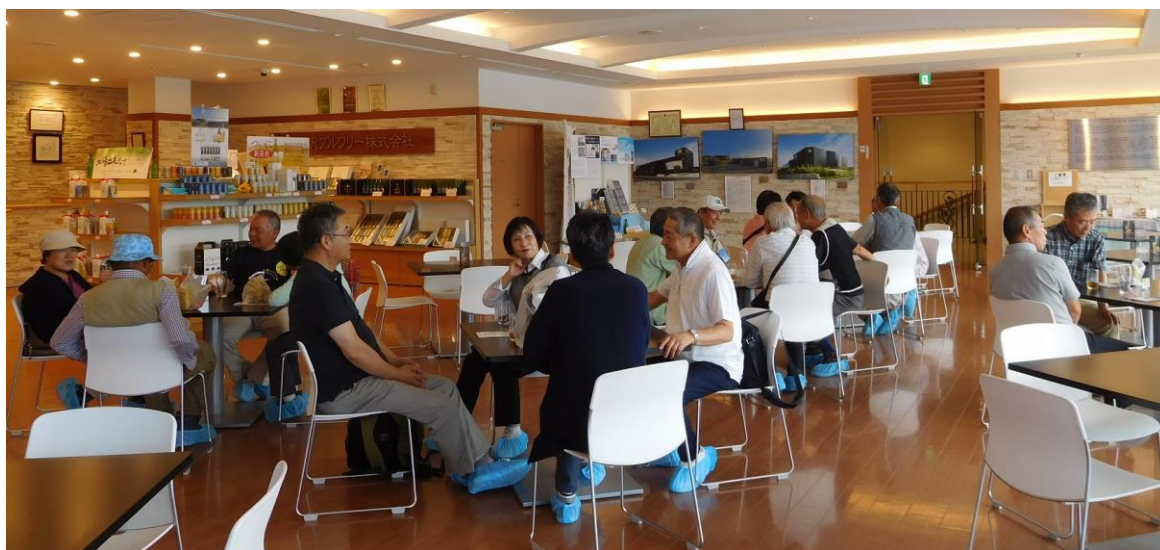
試飲の時間。皆さん至福の時です。…話も弾みます。