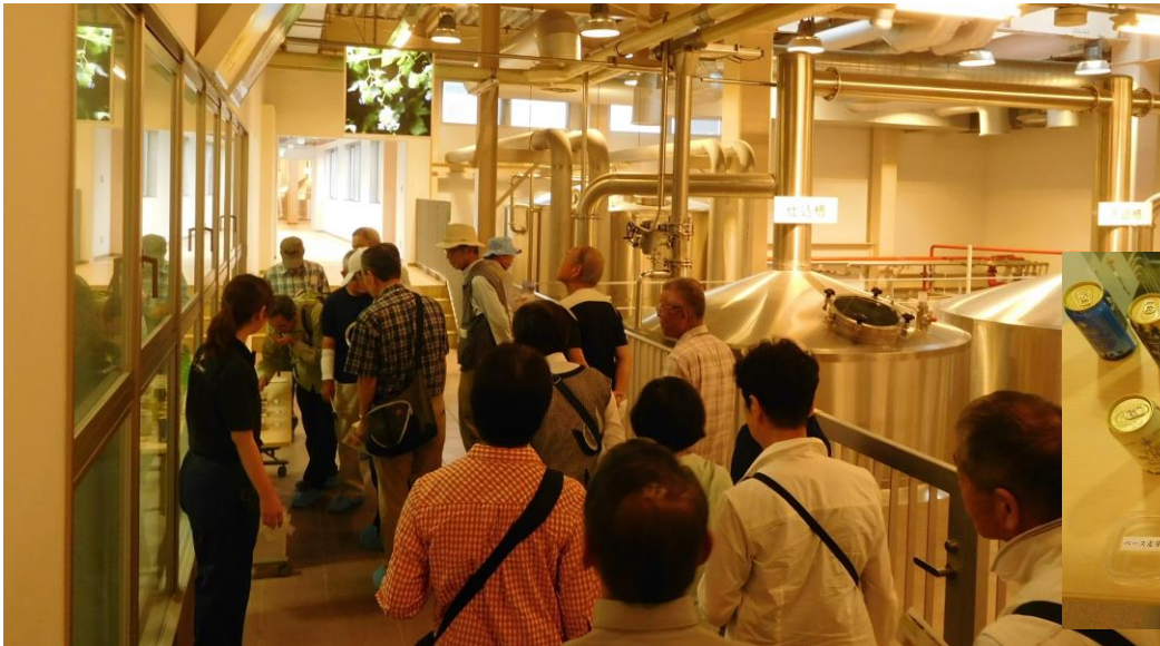
9:30 先ず材料からの説明。ベース麦芽、キャラメル麦芽、チョコレート麦芽を説明して頂き、味見もしました。