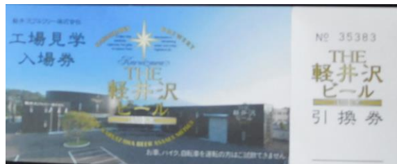
工場見学の入場券(500円) 生ビール1本と持ち帰り1本、又は持ち帰り2本の引換券がついています。