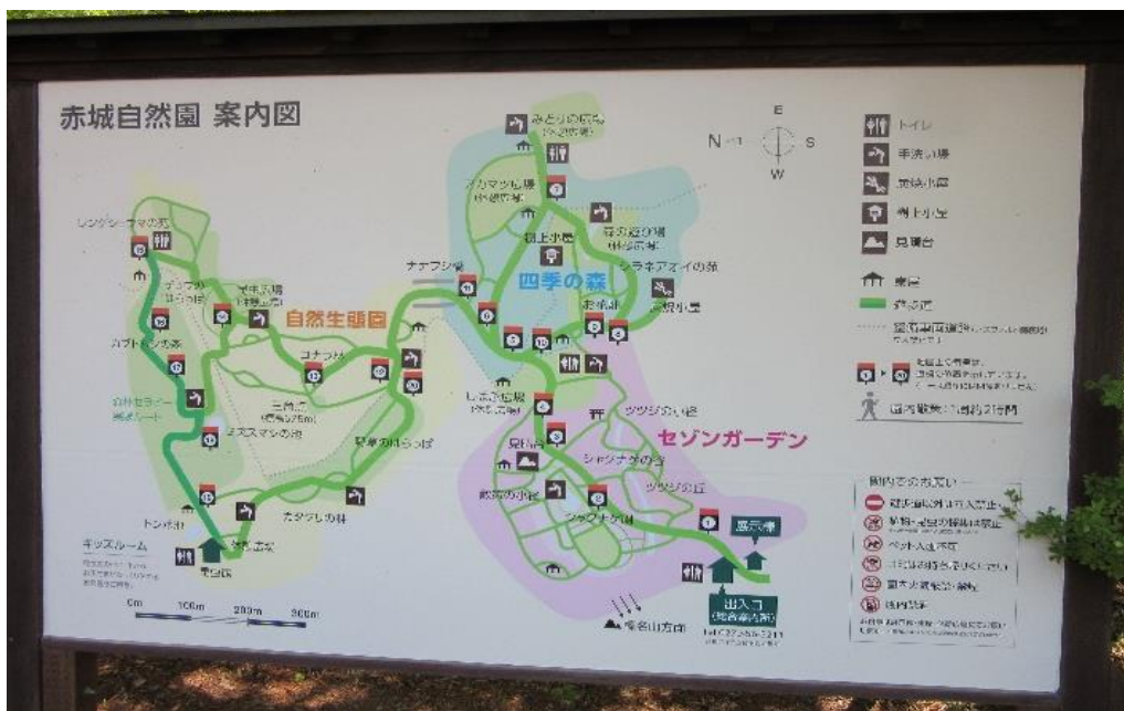
リーダーの先導で散策