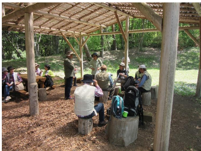
「四季の森」みどりの広場にて昼食