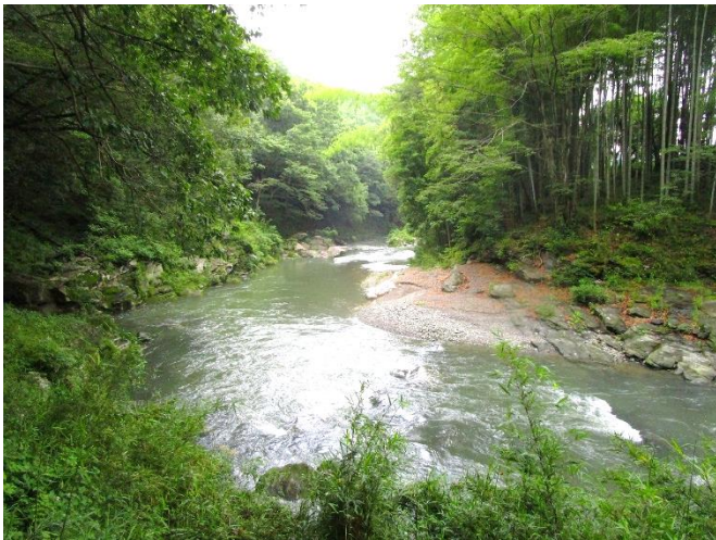
周囲は紅葉の木がいっぱい 秋には見事な紅葉が見られそうでした。 絵画クラブの方のみならず、みなさんも 是非秋に訪れてみてください。