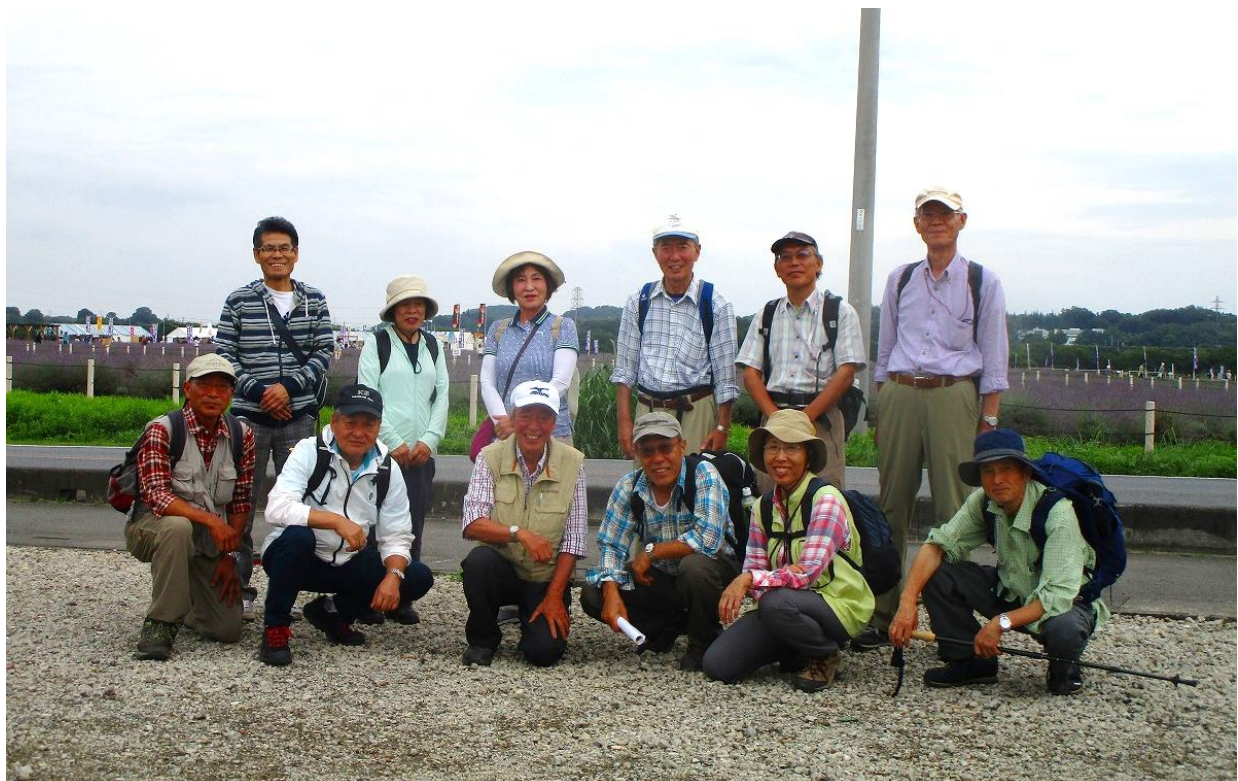
ラベンダーパーク（千年の苑）を背景に集合写真