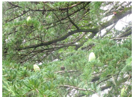
近くの松の木には大きな 松笠(?)のようなものが・・・