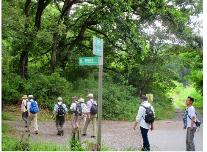
菅谷館跡へ向かう一行 12:55

今回は入園せず、外から眺めました。 ラベンダーは満開で、香りは昼食場所でも 匂って いました。