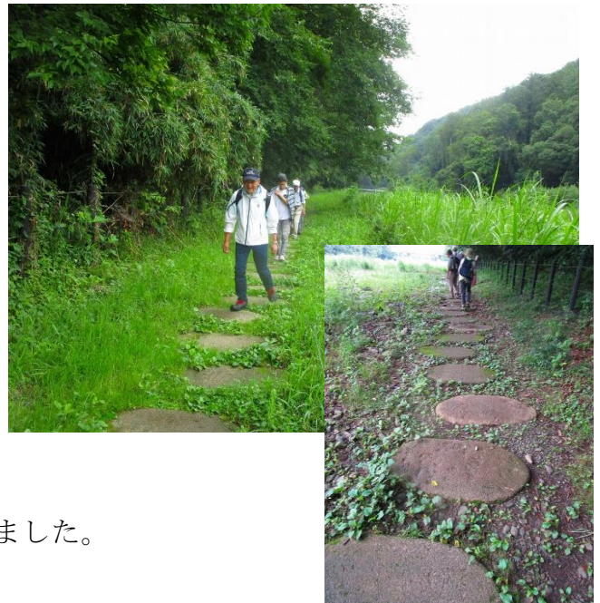
川のほとりの散策道は大きな石で道ができていました。 但し、石の間隔と歩幅が合わず・・・