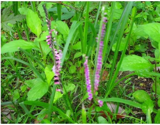
山道の脇には「ネジバナ」も