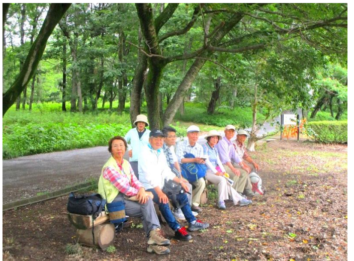
菅谷館跡にて休憩 13:15