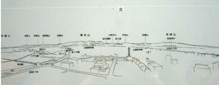
展望ロビーより北部(赤城山)方向(雲で見えず)