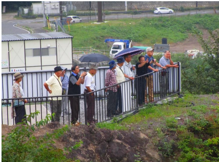
小雨が降り始めましたが、熱心に耳を傾けました