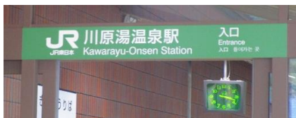
15:16 吾妻線 川原湯温泉駅に到着