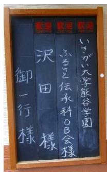
旅館にはわれわれグループと 他一組のお客さまでした