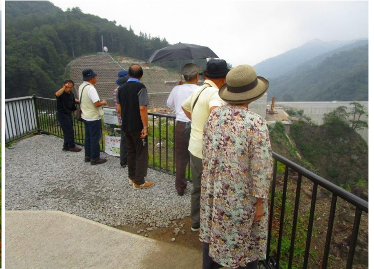
宿のご主人よりの説明を受ける