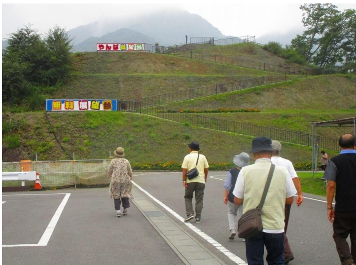
15:20 宿のバスにて「やんば見放台」展望台へ