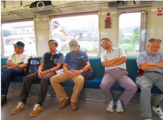
満腹と電車のゆれで、皆さんウトウト