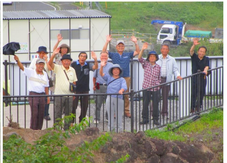
15:30 カメラは先回りして展望上部へ