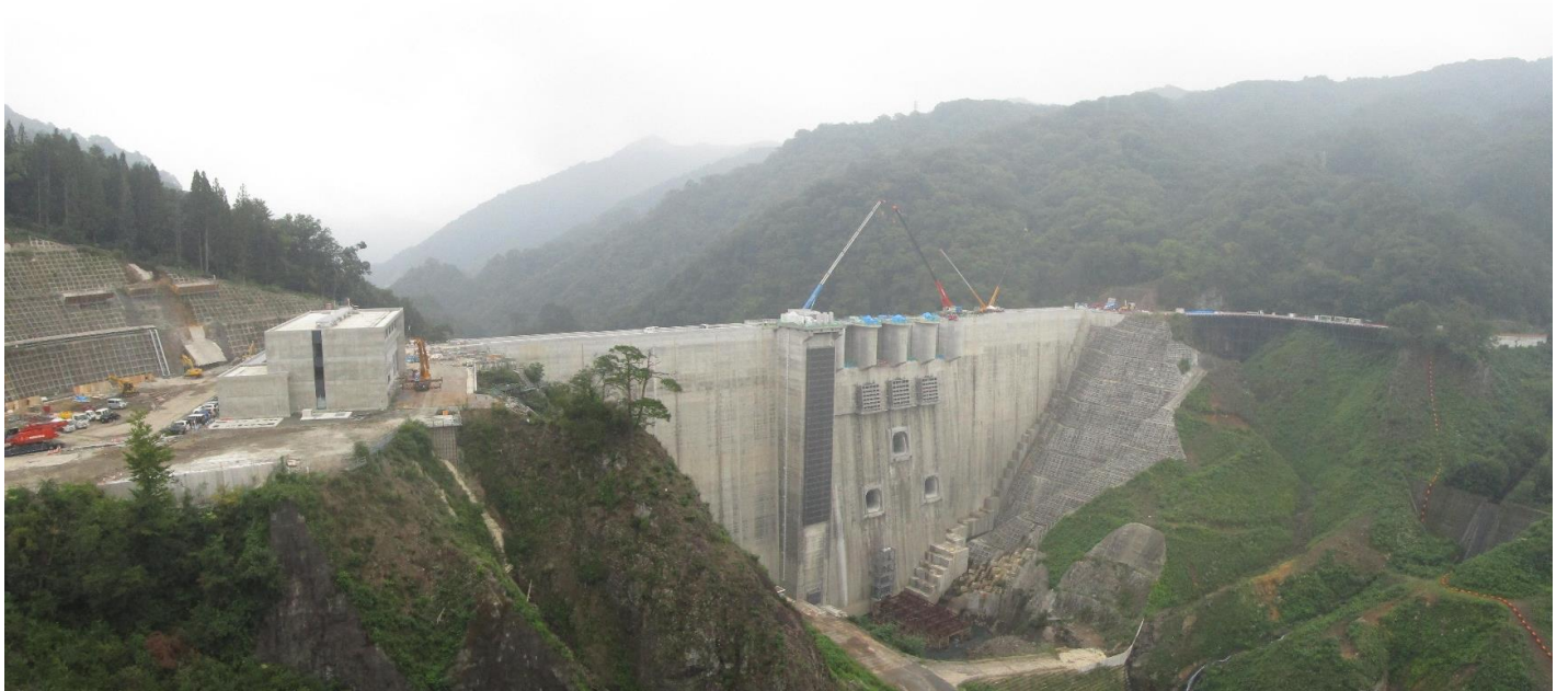
「やんば見放台」 展望台より工事中の堰堤を見る。上流側(完了後は水没する側)