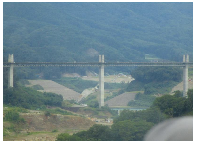
ハツ場大橋(第一湖面橋)から見た 不動大橋(第二湖面橋)