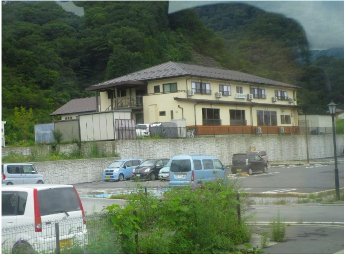
川側から見た”ゆうあい旅館”

11:40から12:40まで、昼食。その後13:00に旅館のバスにて川原湯温泉駅に戻る。