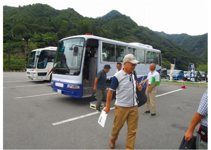
11:25 見学コースを一周し、道の駅ハッ場ふるさと館へ戻る

11:40から12:40まで、昼食。その後13:00に旅館のバスにて川原湯温泉駅に戻る。