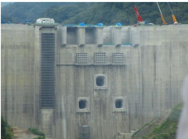
ハツ場大橋(第一湖面橋)からの堰堤