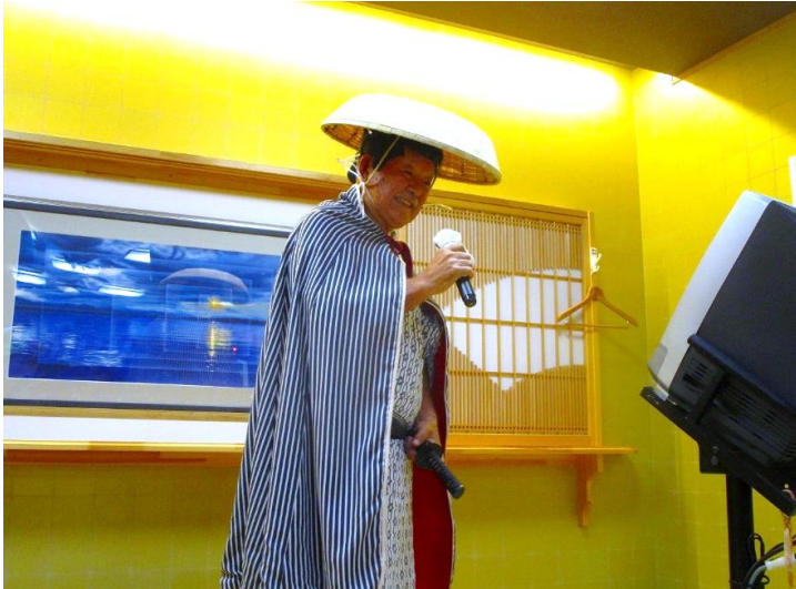
赤城の子守唄を熱唱