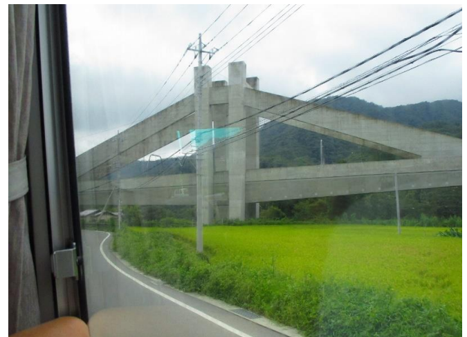
松谷地区のJR吾妻線コンクリート橋