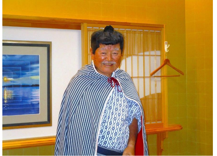
19:10 宴たけなわ、笠、かっぱ、脇差スタイルのT. Tさん