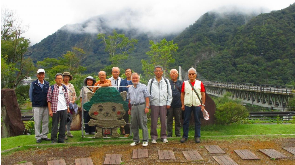
ハツ場ふるさと館