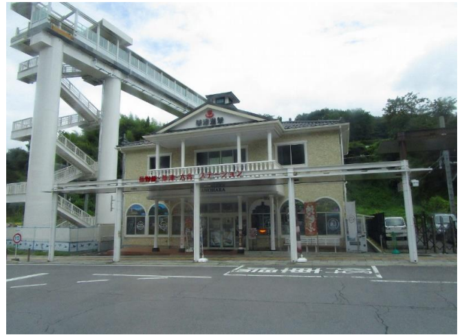
JR長野原草津口駅に併設された 長野原・草津・六合ステーション