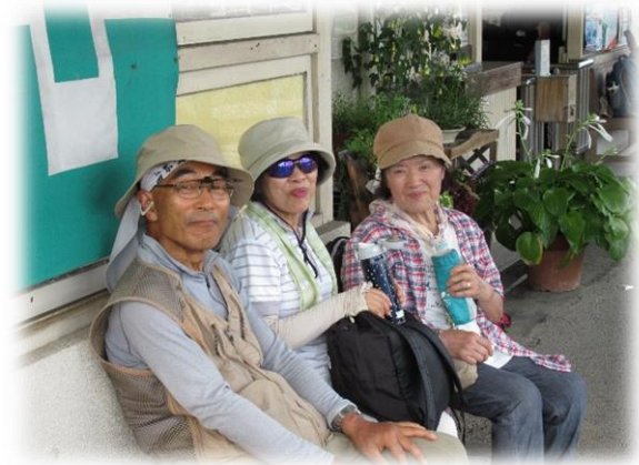
ホームで帰りの電車を待つ顔に達成感が漂う？