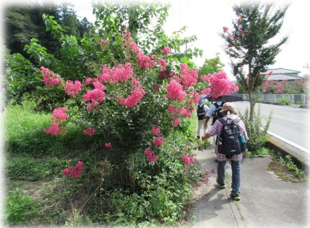
行き交う人の目を楽しませている満開の百日紅