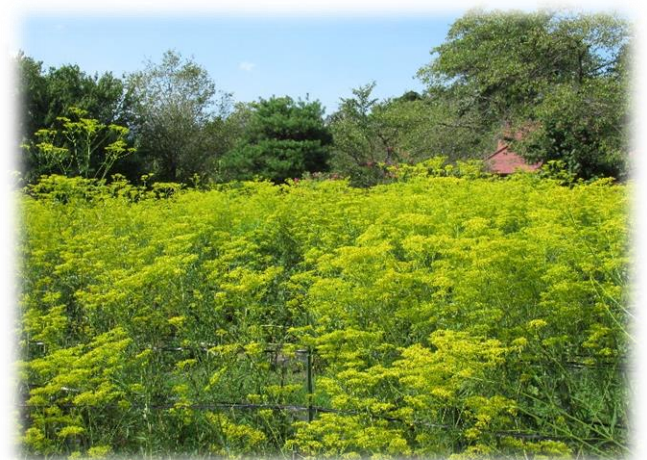
ここの女郎花は、畑一面満開に咲き誇っていました