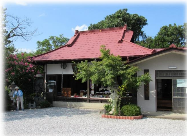
14時5分、最後の目的地「女郎花の真性寺」に到着しました。ここでは檀家の人から心のこもった麦茶をいただきました。