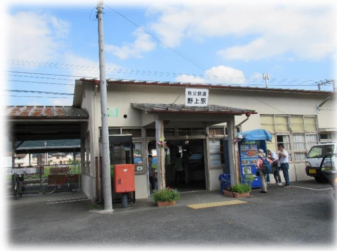
14時40分、終着点の野上駅に到着