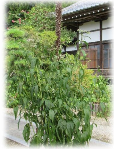
13時30分、「藤袴の法善寺」に到着 ここの藤袴もつぼみで、時季が少し早かったようです。