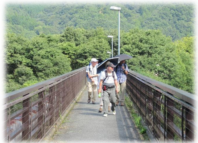
車両は通れない金石水管橋を渡る