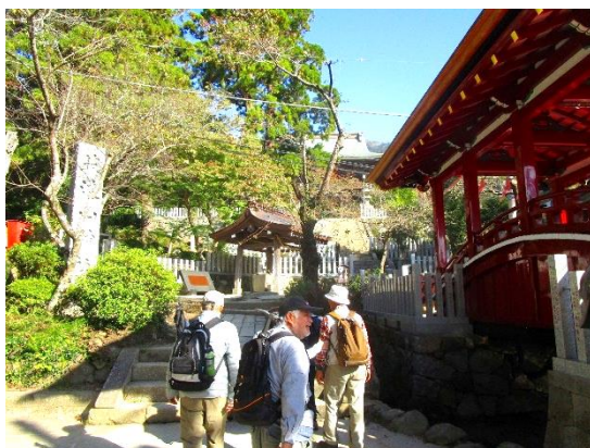
9:00 筑波山神社に到着

この日は、茨城県指定文化財の御神橋の新設架け替えの渡り初めの日で、礼服をきた関係者の方々が多く参拝されてました。