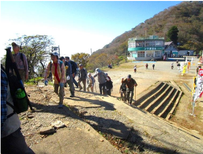
10:38 御幸ヶ原を後に女体山山頂めざして出発