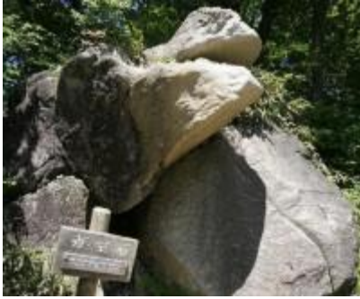
途中には奇岩の一つ「がま石」が・・・