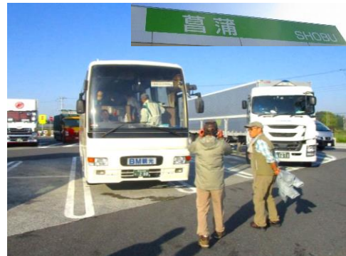
熊谷駅南口よりバスにて7:00 出発。 途中菖蒲の SA で休憩