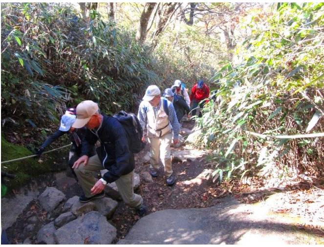
11:30 山頂へむけて登山開始 途中の鎖場でNさんを サポートするSさん(黄金の右腕とか??)