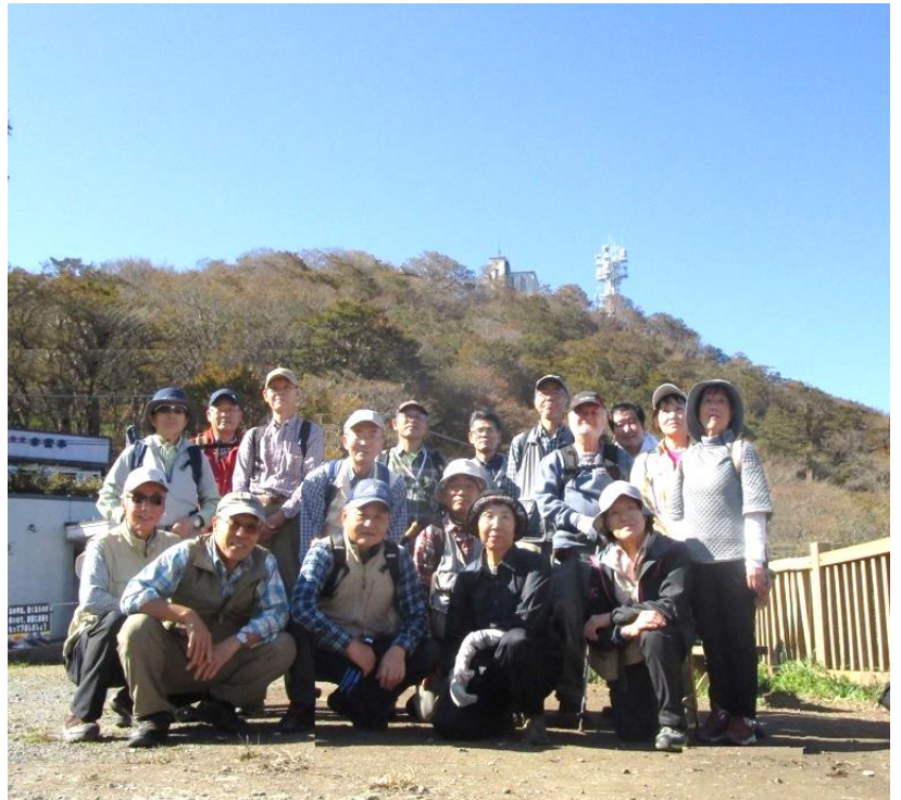
10:35 男体山を背景に、参加者全員で記念撮影