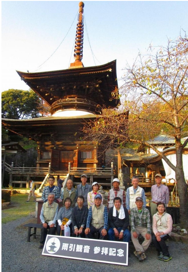
15:30 多宝塔前で記念撮影