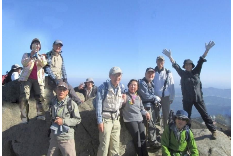
11:50 女体山山頂(876m)到着、 バンザイ!!