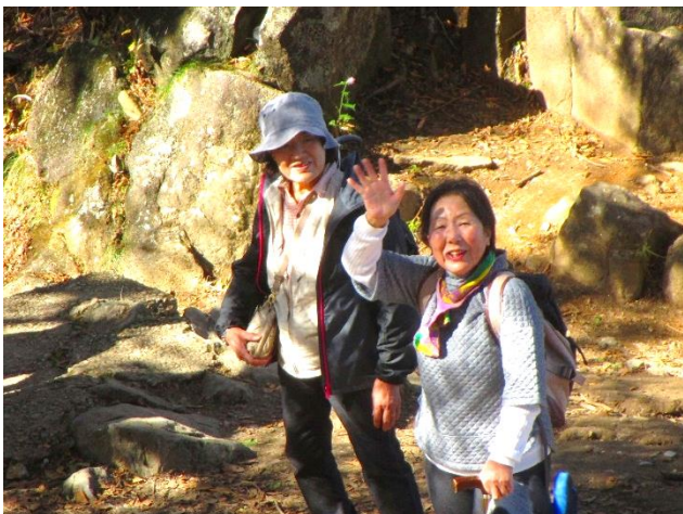
下山開始したら、下から園児、小学生、中学生 の団体が次々に上ってきて、すれ違いに大渋滞