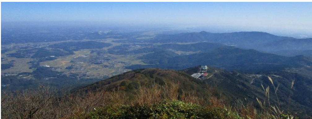
女体山山頂より東方の眺望！