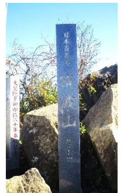
12:00 女体山山頂脇にてロープウェイ下山組と 別れて下山開始