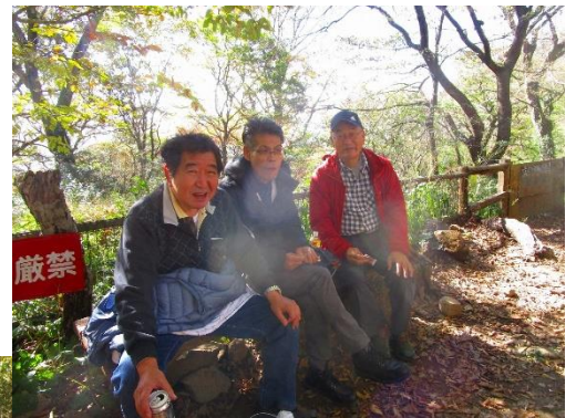
10:45 女体山への途中の休息所にて少々早い昼食