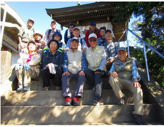
山頂のお社前で登頂者集合写真！