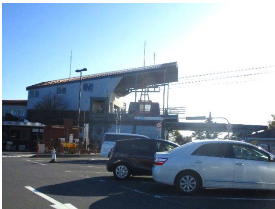
14:40 ロープウェイ「つつじヶ丘」駅駐車場に到着 小休止後、雨引観音に向けて出発