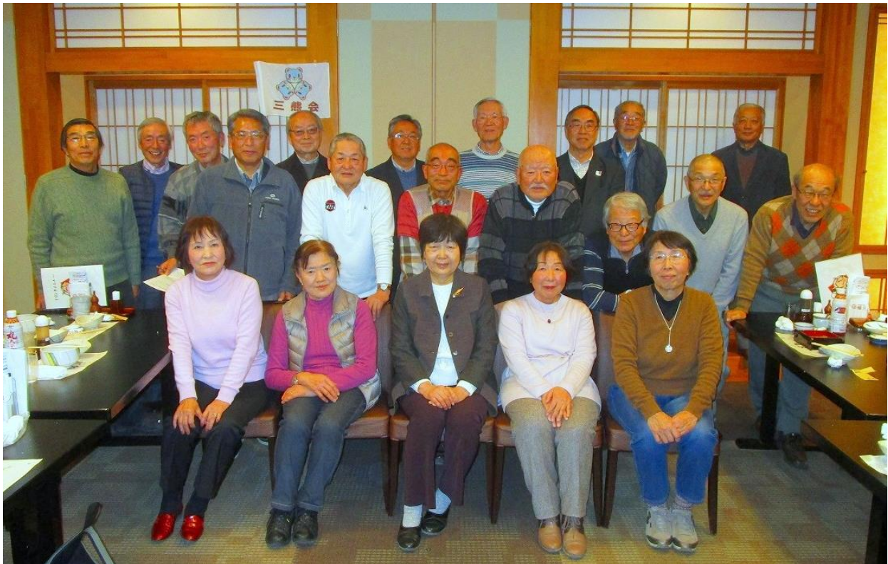
お開き前に集合写真

新年会にご参加頂いた皆さま、お疲れさまでした。 三熊会として秋の旅行以来のイベントでしたが、「お年玉くじ」の時の皆さまの笑顔がそのままで2020年が続きますように祈っております。 今年も三熊会活動をよろしくお願い致します。