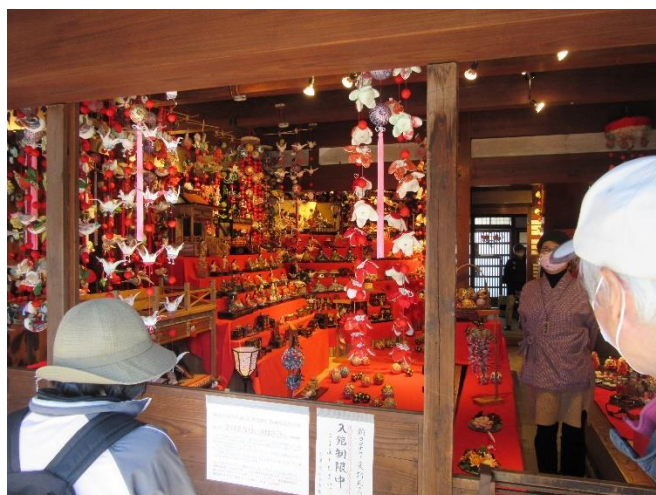
沿道の立派な段飾りとつるし雛