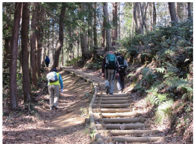
多峯主山への300階段