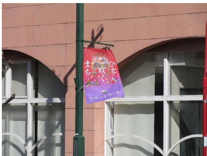
ひな飾り展の案内旗