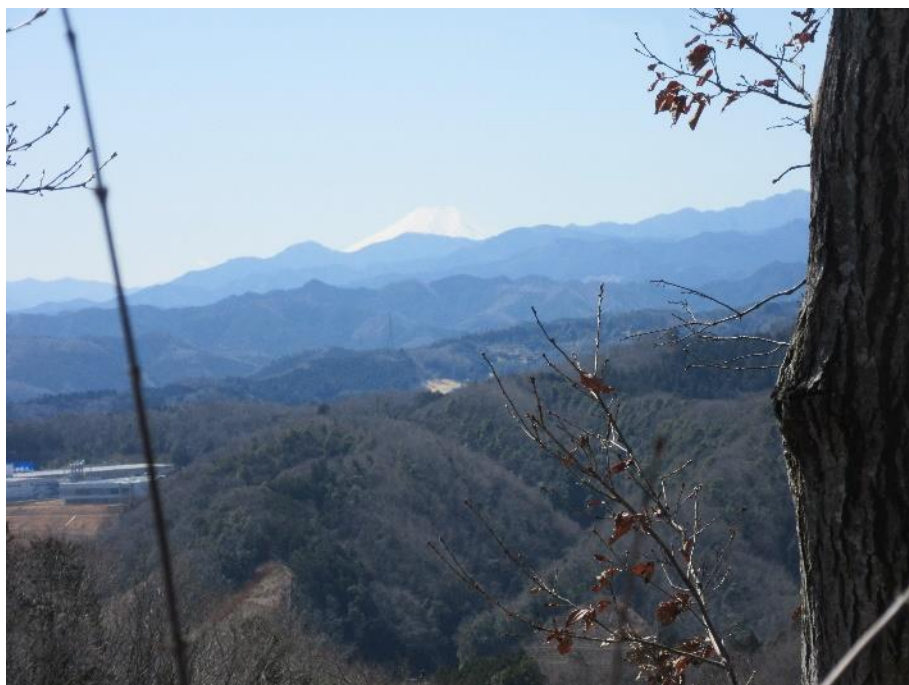
多峯主山の頂からの富士山

当日は、前日の強風とは打って変わって、1日快晴のハイキング日和でした。新型コロナウイルスの影響により休校なった子供達が親と一緒にハイキングを楽しんでいました。また、街に近いのか地元の我々より年配の方がストックを手にハイキングを楽しんでいました。