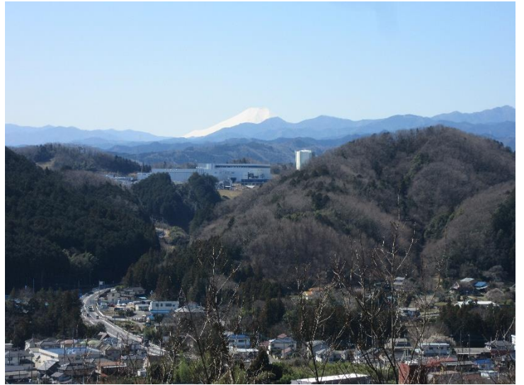
天覧山からの富士山