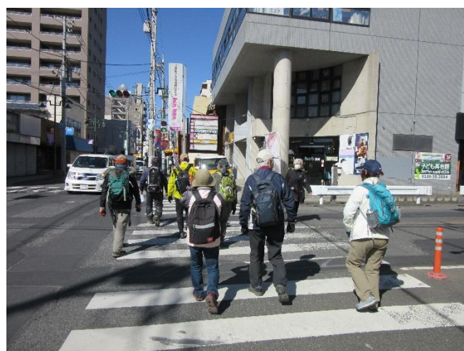
東飯能の街並を歩く