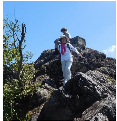
更に上を目指し・・・