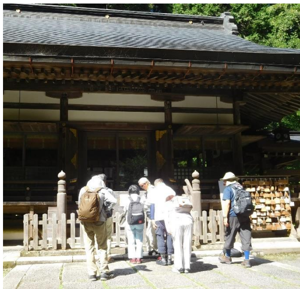
まずは金鑽神社に参拝してから