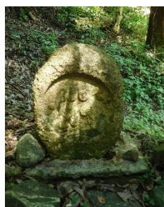
階段横には石仏が有りました