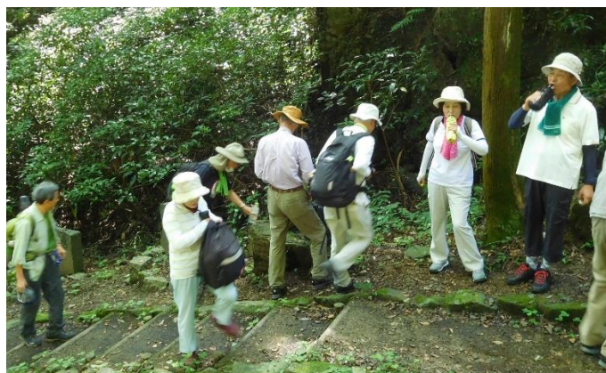
20分弱歩いたところで休憩