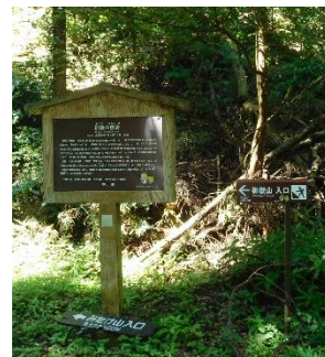
金鑽神社横にある登山入り口