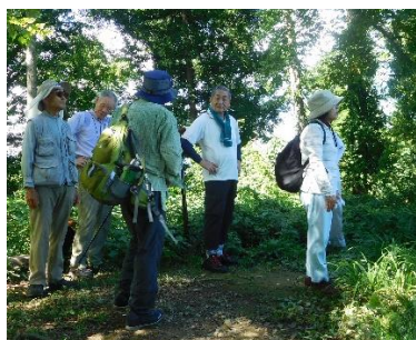
ホッと頂上で一息