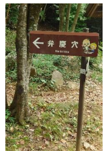
見晴台の場所に「岩山展望」と反対側に「弁慶穴」がありました。