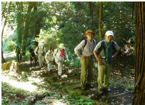
結構急な階段に歩いて間もなくこの疲れた顔、顔・・・