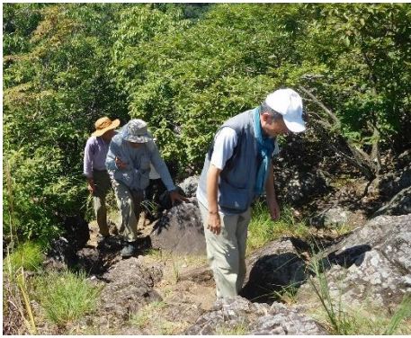
もう少しで「岩山展望」。頑張ろう。

歓談後11:55頃「岩山展望」へ出発。5~6分で到着。ここも岩場で急なので慎重に登りました。「岩山展望」からの眺めは、頂上より非常に良かった。