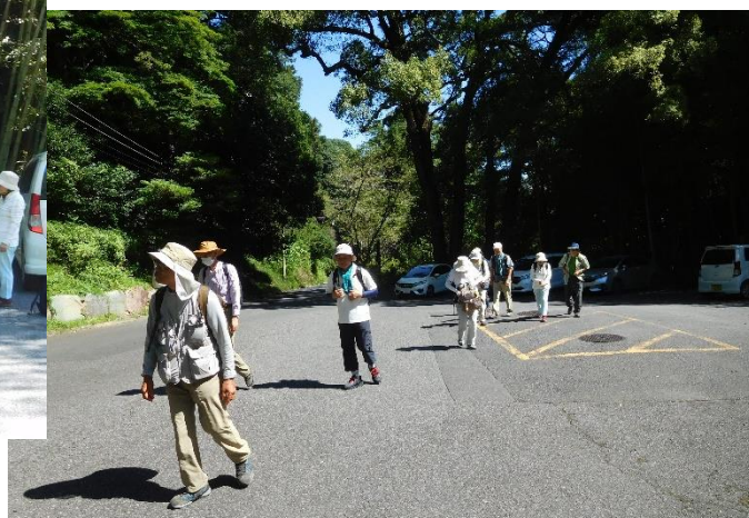
御嶽山に向け出発