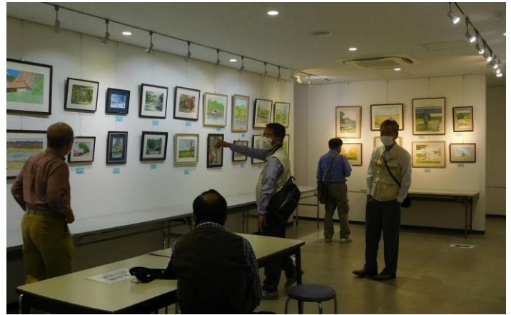
H氏の講評の様子（制作者ごとに時間をかけて講評して頂きました）