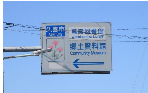
←10:50過ぎ 郷土資料館の看板 が見えた