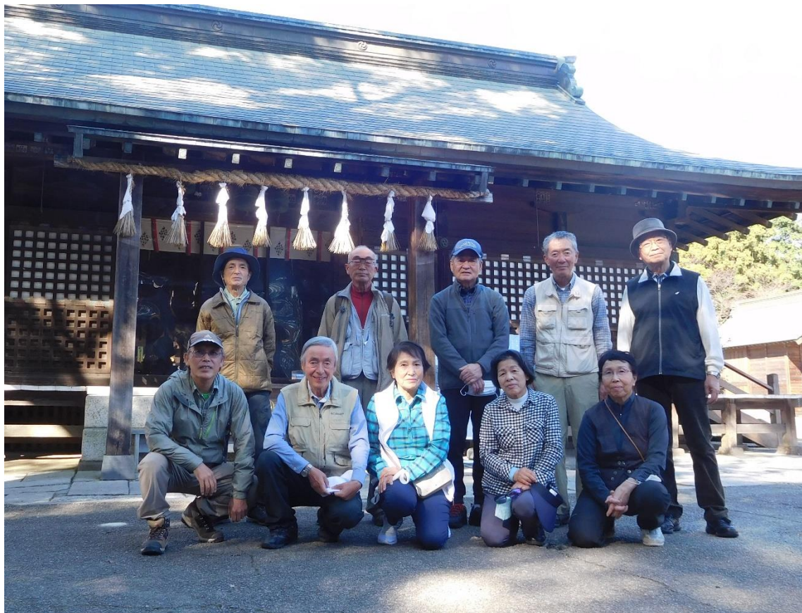
↑ 13:10頃 本殿の前で集合写真撮影