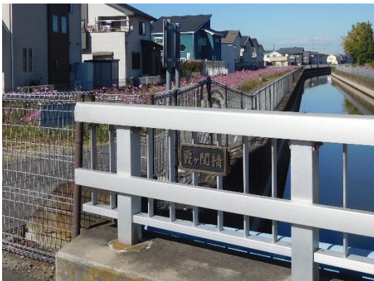
↓さらに歩いて霞ヶ関橋