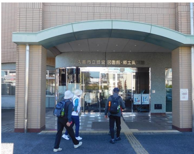
↑郷土資料館の入り口。図書館の入り口でもある。