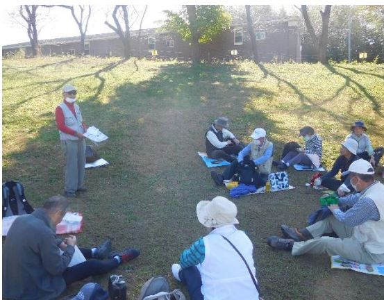
↑次回幹事から次回のハイキングについての説明がありました。