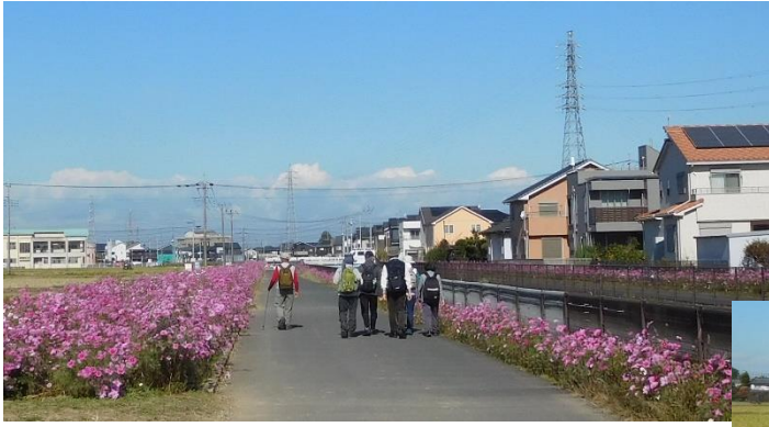
←柳橋を過ぎたところ