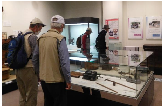
↑郷土資料館の見学の様子。資料館は見ごたえがありました。

約30分の見学を終え、11:30頃郷土資料館を離れ昼食の場所として選んだ鷺宮総合支所の横にあるコミュニティ広場に移動しました。木陰を選びそこで昼食タイムにしました。