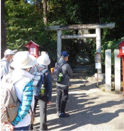
←境内社には9社あるとの事で本殿の周りを歩いてみました。9柱の神様が合祀されているそうです。

鷲宮神社を出て、次の信号を右に曲がれば鷲宮駅（東武伊勢崎線）に行ける。今朝、熊谷から秩父線、東武伊勢崎線で来られた方（7名）がおり、鷲宮駅へ行くという案も出てきたので、皆と相談した結果、7名は鷲宮駅（東武伊勢崎線）へ向かう事になりました。そこで、鷲宮神社を出るところで解散（13:20頃）としました。鷲宮神社を出て、最初の信号で7名と別れ、3名は計画通りの東鷲宮駅（JR）に向け歩きました。男性3名だったので途中休憩も入れず東鷲宮駅へ直行し、ほぼ計画通りの時刻に駅に到着できました。