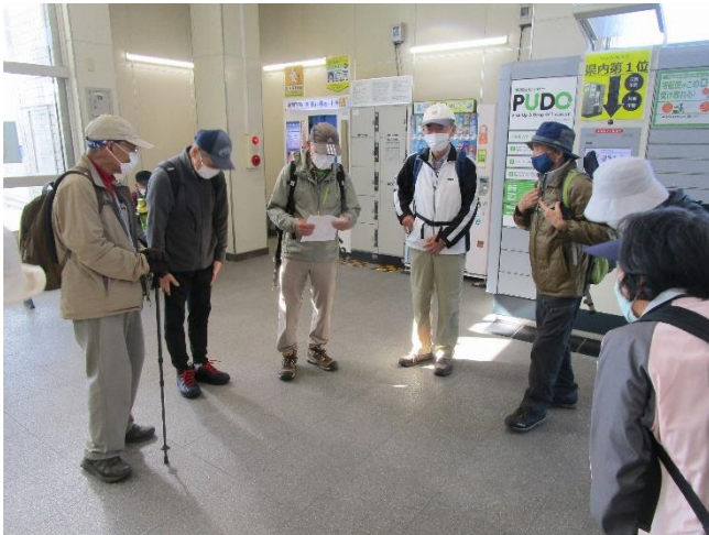
全員揃ったところで、今日のコースの説明