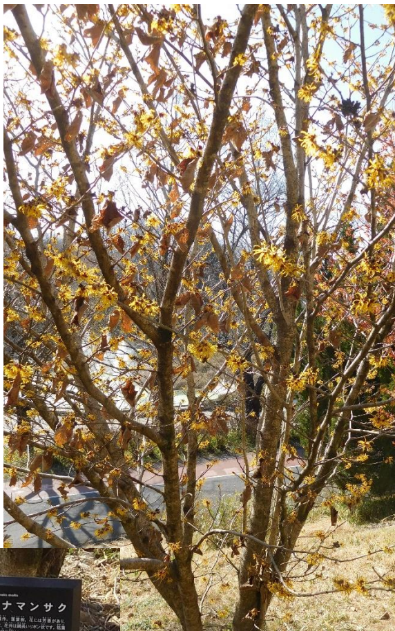
14 : 30 頃、彫刻広場を後にして、中央口へ向かう。中央口近辺に来たところにマンサクが咲いていました。