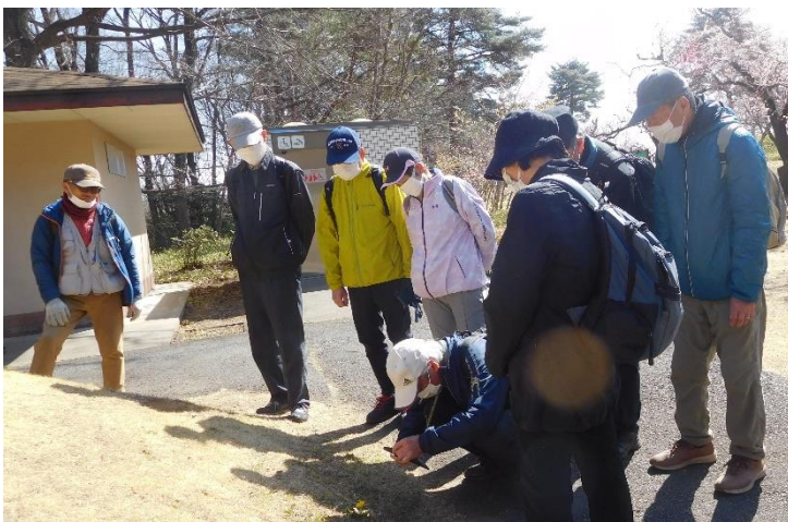
↑梅林を出ようとしたところにタンポポが。 西洋タンポポ？日本タンポポ？で盛り上がりました。