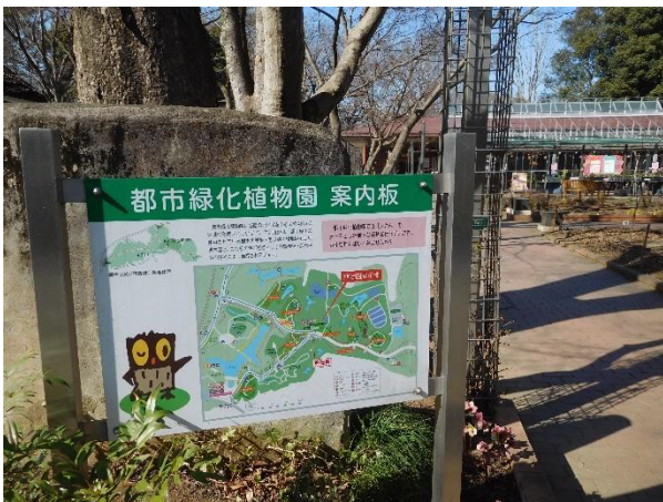
↑ 14 : 05 頃到着