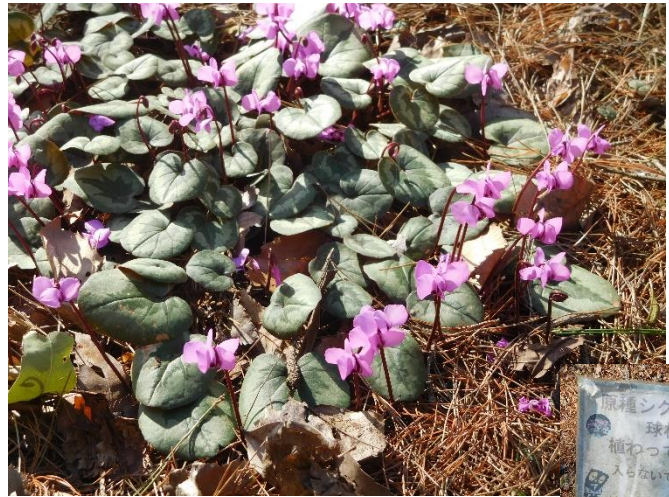
↑ 彫刻広場の近くに「原種シクラメン」が咲いていました。