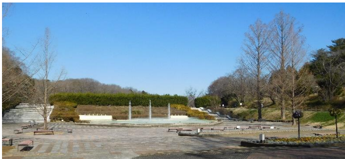
中央口から見た風景。雲一つなく、又 風もあまりなく、最高の日です。