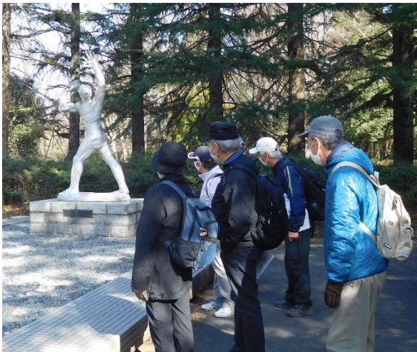
↑ 14 : 25 頃 彫刻広場に到着。