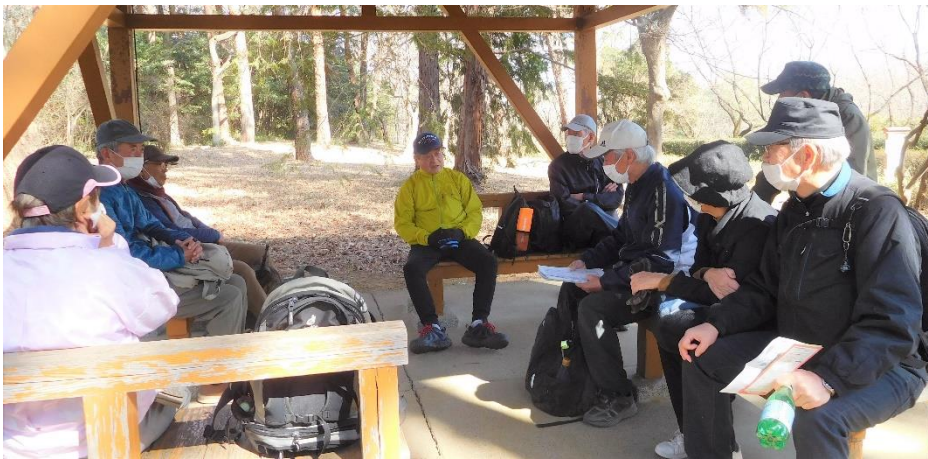
溪流広場バス停前にある東屋で 暫し休憩。過去のハイキングで 行った場所などの思い出話に花 が咲きました。