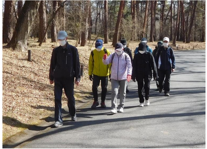
↑野草コースを後にして、植物園展示棟に向かう。