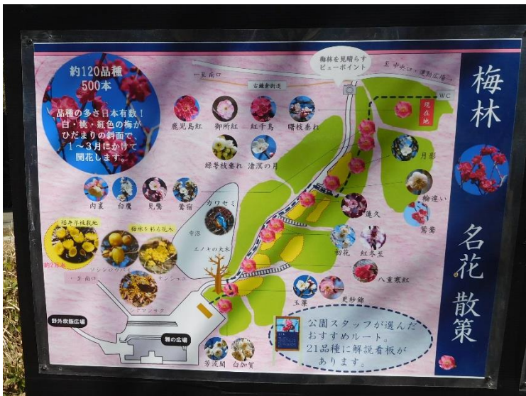
↑梅林の説明 約120品種 500本と記載有り

鹿児島紅 Kagoshima-ko 開花期：2月中旬ごろ 濃紅色の花が群やか、八重咲き中輪品種。花弁は初春咲で数が多く、しべも紅色。「梅魂」「梅花集」に記載がある。 梅魂の中心は長く知られた品種のひとつで、最も色が濃い品種である。つばのみ一段と濃い色で、よく目立つ。花弁も極めて良い。 樹勢はやや弱いが、庭木には適している。