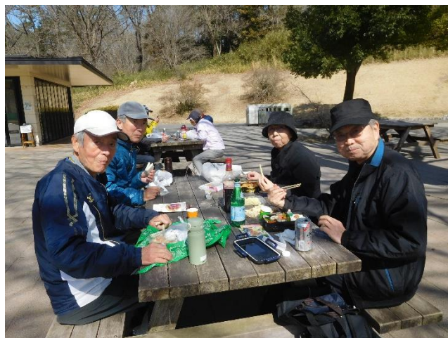
↑ 11 ; 40 頃から昼食タイム

昼食終わった後、総会開催。 会計報告、次年度計画の説明があり了承されました。 役員については特に言及無く、現在の継続となります。