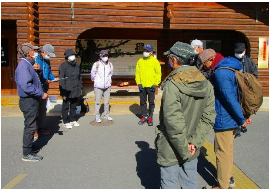
10:00前に全員集まり、入園前に挨拶をしてスタートしました。

10:00前に本日開催の挨拶が終わり、入園（シルバー¥210）してハイキング開始。