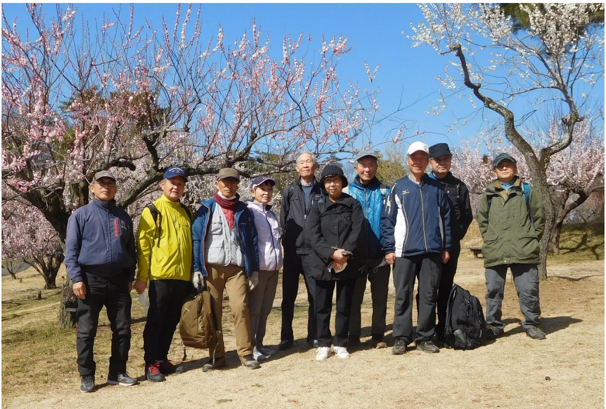
↑梅をバックに集合写真