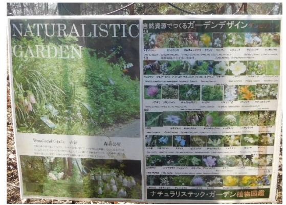
↑ 植物園展示棟を後にして、彫刻広場に行く途中にありました。いろいろな花が見ることができる様です。