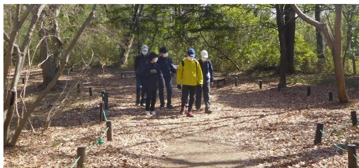
↑野草コース歩くも野草に会えず。時期的に少し早かったか。