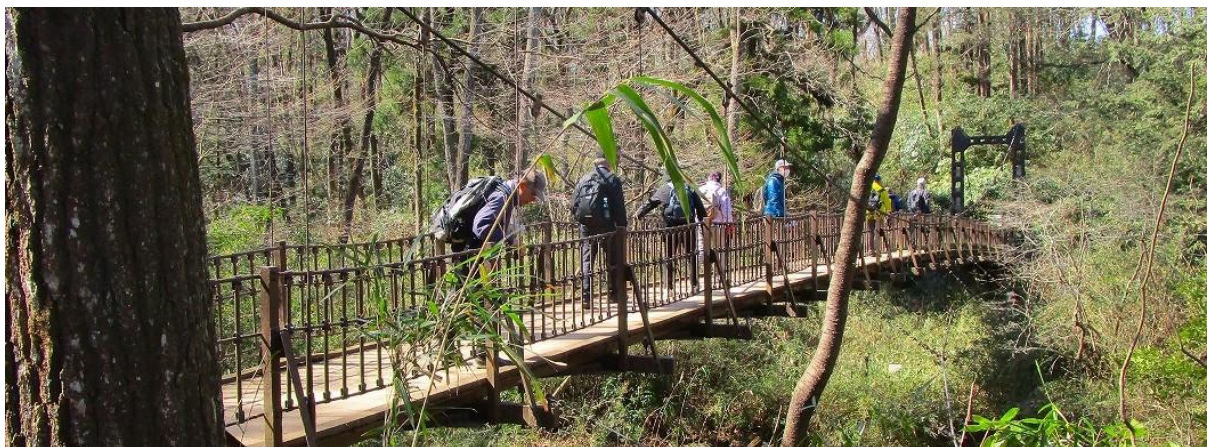
↑途中にある「あざみくぼばし」を渡る。