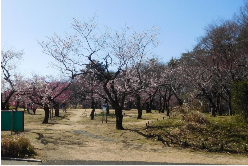
歩き始めて45分ぐらいで梅林に着きました。