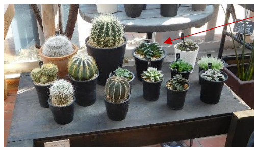
変わったサボテン がありました。