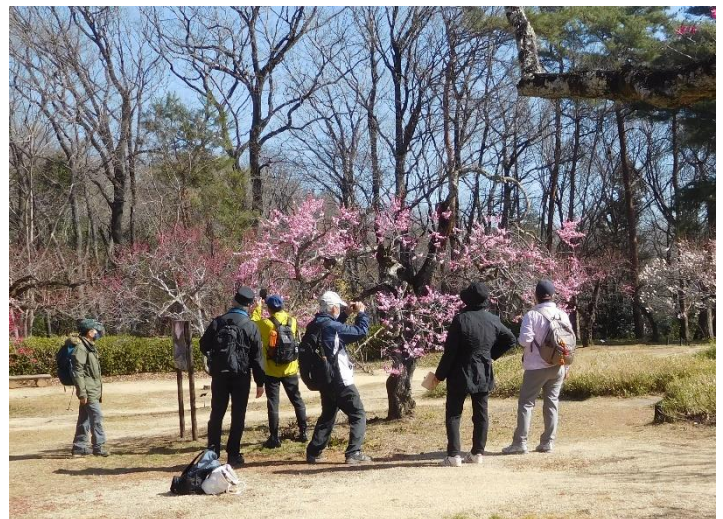
↑梅林を堪能するメンバー

御所紅 Onyosonobu 開花期：2月中旬ごろ 濃紅色の花が群やか、八重咲き中輪品種。花弁は初春咲で数が多く、しべも紅色。「梅魂」「梅花集」に記載がある。 梅魂の中心は長く知られた品種のひとつで、最も色が濃い品種である。つばのみ一段と濃い色で、よく目立つ。花弁も極めて良い。 樹勢はやや弱いが、庭木には適している。