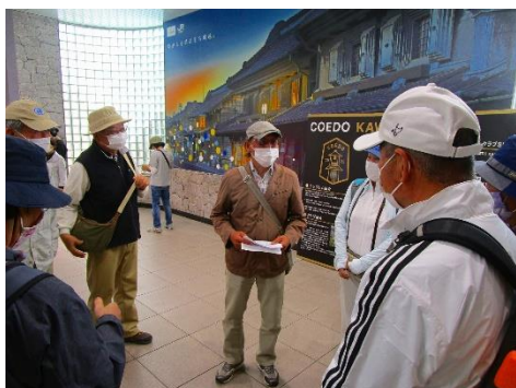
9:50前に全員集まり、挨拶をしてスタートしました。