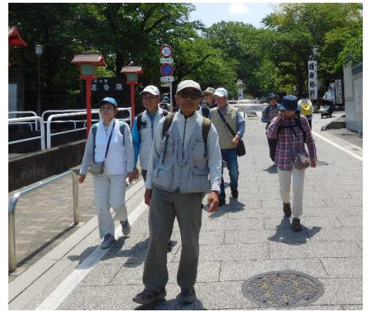
五百羅漢の近くで暫し休憩をした後 第4番 「成田山川越別院（恵比寿天）」へ向かう