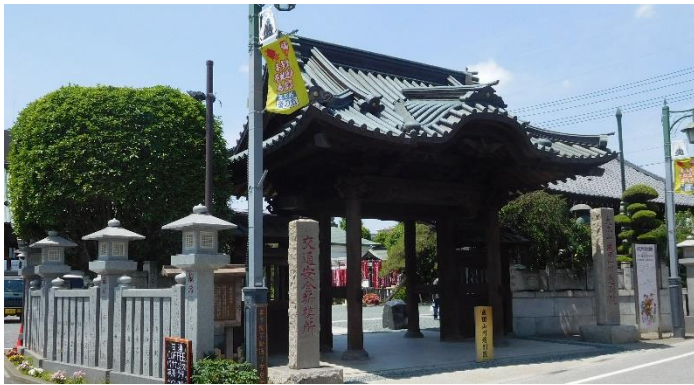
11:55頃 第4番「成田山川越別院（恵比寿天）」に到着。