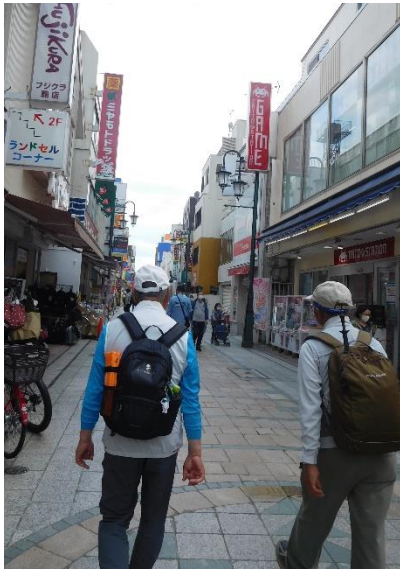
駅に続くクレアモールを歩く

七福神を完歩しました。14：40頃「妙昌寺（弁財天）」を出発し、川越駅に向かいました。