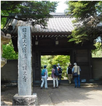
「喜多院」へ向かう途中にある「中院」に寄る。11:05頃