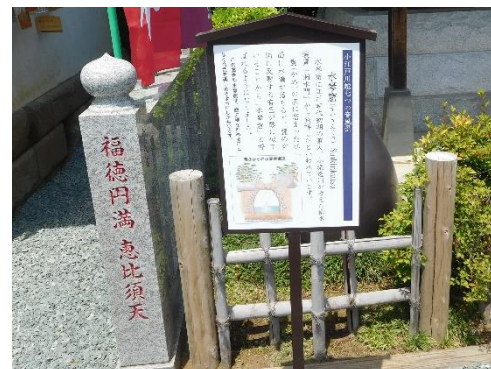
第4番 恵比寿天 側にある「水琴窟」を撮り「恵比寿天」を撮るのを忘れました。