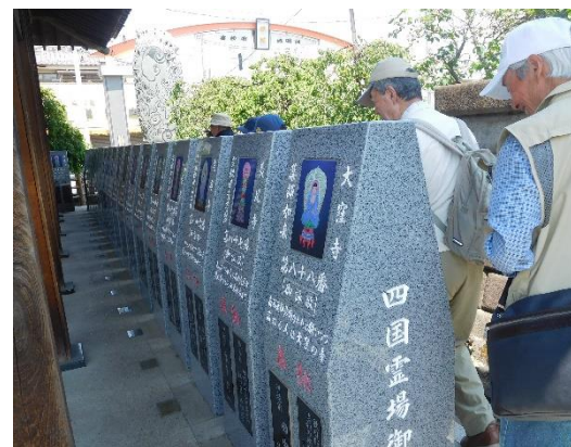
「四国霊場御砂踏み」があり、皆さん一回り。直接四国霊場を巡ったと同様のご利益が得られるそうです。御利益が有れば良いですね。