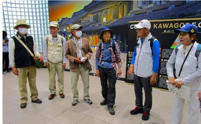
15：00 過ぎに予定より早く川越駅に到着。 ハイキングの締めを行い解散となりました。 帰りは予定より早い15：25の電車に乗ることが できました。

川越駅に予定より早く、到着したので。20分程早い電車（15：25 発）に乗ることができました。又、大宮での乗り換えも3分でしたが、スムーズに行き高崎線大宮発 15：51 発の電車に乗ることができ、予定より早い帰宅ができました。