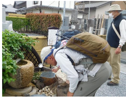
「水琴窟」の音を確認