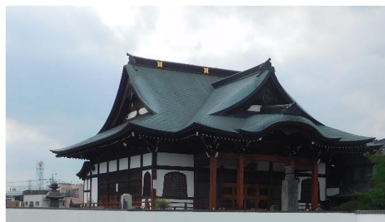
広い駐車場（手前）から「妙昌寺」を見る。駐車場より低い位置にあります。