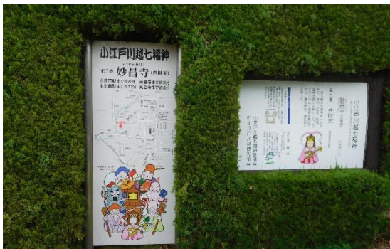
14:30 7番目の「妙昌寺」に到着