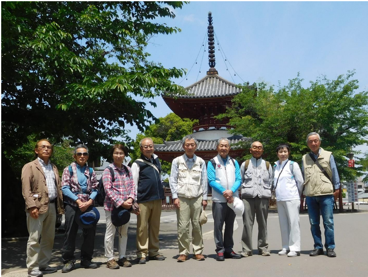
↑喜多院 多宝塔をバックに集合写真を撮りました。