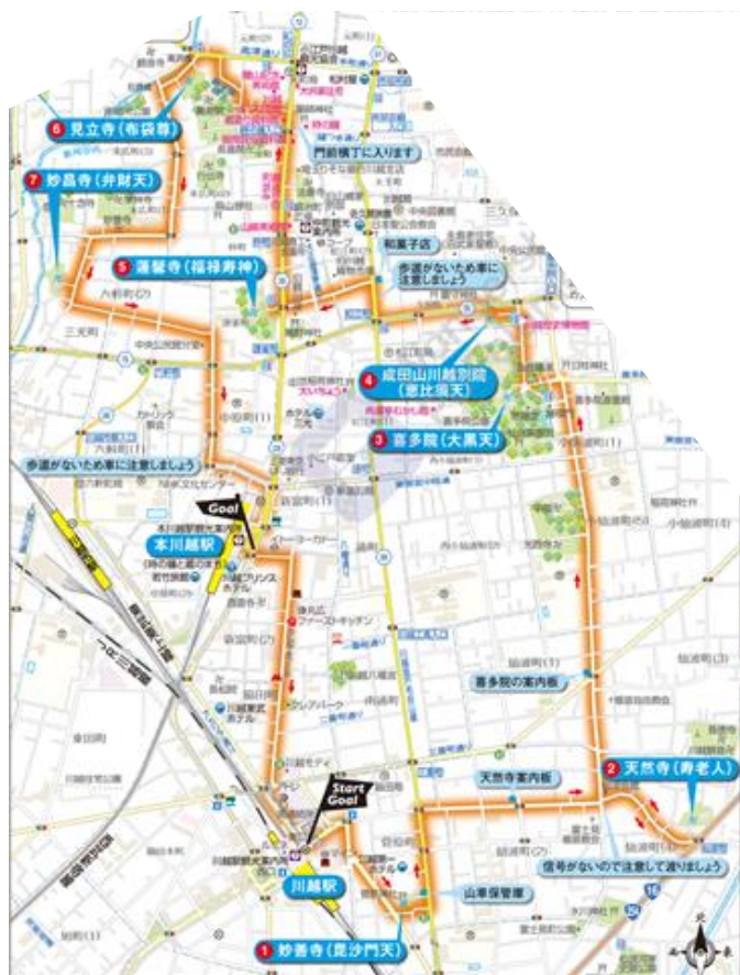
Webで入手した地図を参考に歩きました