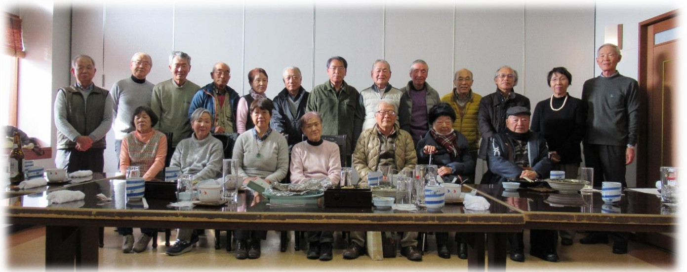
最後に記念写真を