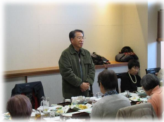
T・T氏の締め挨拶で閉会となりました。