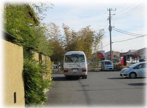
14時に解散となり、バス組は送迎バスで熊谷駅に向かいました。

能登沖震災の悲しい出来ごとから始まった新年ですが、参加者の皆さんは地域活動、サークル活動等で増々元気に日々の生活を謳歌している様でした。 短い時間でしたが、久しぶりの顔合わせで楽しいひと時を過ごしていただけたと思います。 卒園後10年が過ぎ会員数も大分少なくなってきましたが、今後も末永く三熊会が継続されるよう元気で頑張りましょう。