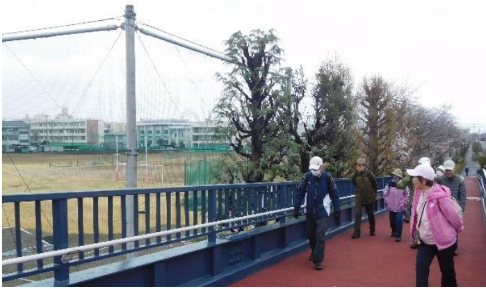
13:20頃 国道17号に架かる陸橋。左に見えるのが深商のグラウンド。ここからも「二層楼」が少し見えます。