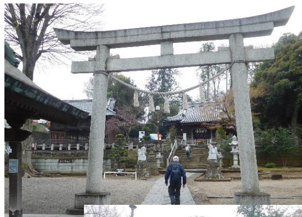
瀧宮神社に到着。少し立ち話をし、参拝をして深谷駅に戻る。