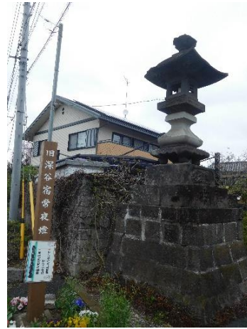
陸橋を降りると、旧中山道に出ます。そこに常夜灯(東)があります。