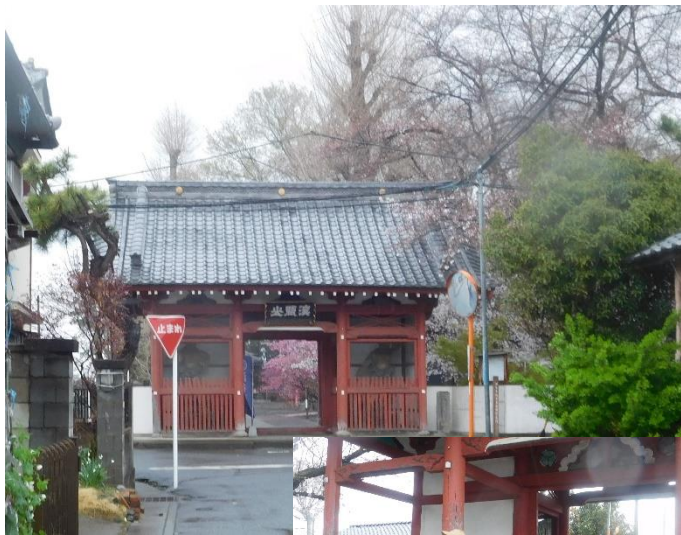
11：45頃「瑠璃光寺」に到着。

↑二層楼の見学を終え、11：15頃深商を後にする。その後は、近くのコンビニによってから、唐沢川の土手に向かう。見学中に雨は止むだろうと言う予想に反し、雨は止まず、又、傘をさしての散策が始まりました。