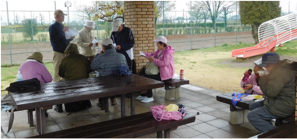
←昼食後、5月ハイキングの案内の説明を行って頂きました。

寒くなってきたこともあり、午後は予定していた、煉瓦工場、資料館に行くのを止め、遊歩道（あかね通り）を散策し、駅に向かい駅の南口にある瀧宮神社（当初計画では最初に行く所でした）へ行くことにしました。ブリッジパークを出発し近くの楡山神社に寄ってから、遊歩道（あかね通り）に向けて歩くことにし、スタートしました。