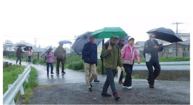
↑唐沢川の土手を歩く。瑠璃光寺の近くまで来た。11：40頃

↑二層楼の見学を終え、11：15頃深商を後にする。その後は、近くのコンビニによってから、唐沢川の土手に向かう。見学中に雨は止むだろうと言う予想に反し、雨は止まず、又、傘をさしての散策が始まりました。