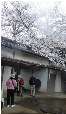
←11：55頃 瑠璃光寺を後にして、遊歩道（あかね通り）にあるブリッジパークへ向かう。

12：15 ぐらいにブリッジパークに到着するも、ベンチは濡れていた。どうにか座れる場所（一部濡れていないところがあった）を探し、昼食タイムとした。雨は止むも、風が出てきて、寒い昼食タイムとなってしまいました。