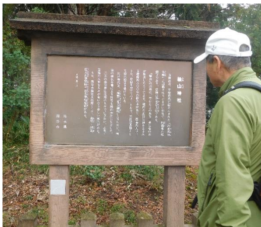
楡山神社に 12:50 頃到着。 平安時代に編纂された「延喜式神名帳」に記載されている古い神社との案内板が有りました。

寒くなってきたこともあり、午後は予定していた、煉瓦工場、資料館に行くのを止め、遊歩道（あかね通り）を散策し、駅に向かい駅の南口にある瀧宮神社（当初計画では最初に行く所でした）へ行くことにしました。ブリッジパークを出発し近くの楡山神社に寄ってから、遊歩道（あかね通り）に向けて歩くことにし、スタートしました。