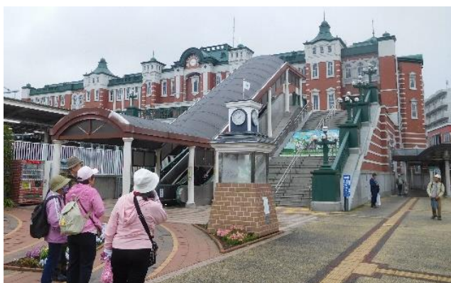
14:00前に深谷駅に到着。トイレタイムを取ってから、駅の南側にある瀧宮神社へ向かう。

←常夜灯を見た後、近くの中山道と国道17号が交差するところにある、「見返りの松」を見に行きました(13:30頃)。松の木は枯れて2代目との事。