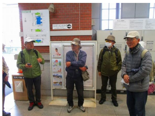
当初予定より早めの解散式となりました。お疲れ様でした。皆さん数分後の電車に乗って帰途につきました。

今回は、久しぶりの傘さしハイキングになってしまいました。土砂降りの雨ではなかったので、どうにかルート変更しながら、散策ができました。残念ながら、今年の桜は遅く、まだ満開になっておらず、天気も悪く花を楽しみながら歩くことができませんでした。