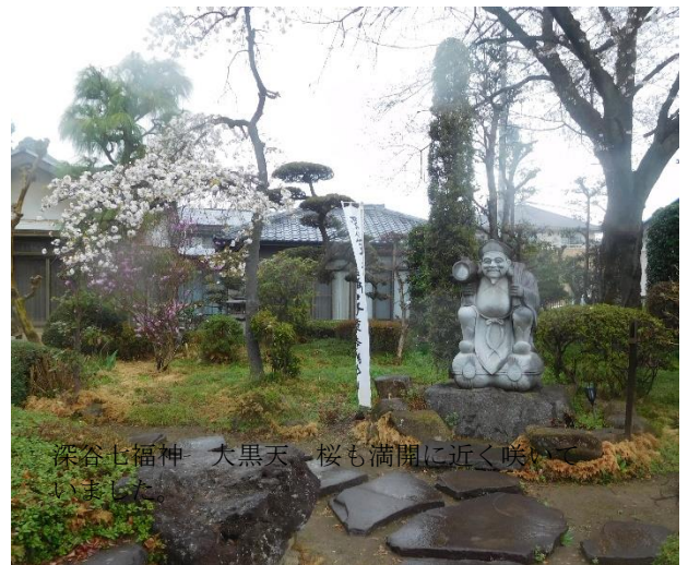
深谷七福神 大黒天 桜も満開に近く咲いていました。