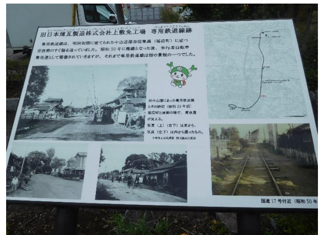
遊歩道(あかね通り)は、煉瓦工場からレンガを運んだ列車の線路跡で、遊歩道の所々に上記の案内板があります、

←常夜灯を見た後、近くの中山道と国道17号が交差するところにある、「見返りの松」を見に行きました(13:30頃)。松の木は枯れて2代目との事。