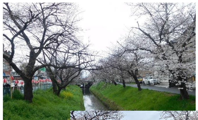
深谷駅の南側。駅と瀧宮神社の間を流れる唐沢川の桜の様子(↑)。下の写真は2日後(4/7)の様子。満開になっていました。→