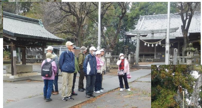
H 5/6/9 皇太子殿下ご成婚記念樹を見る。 ↑→