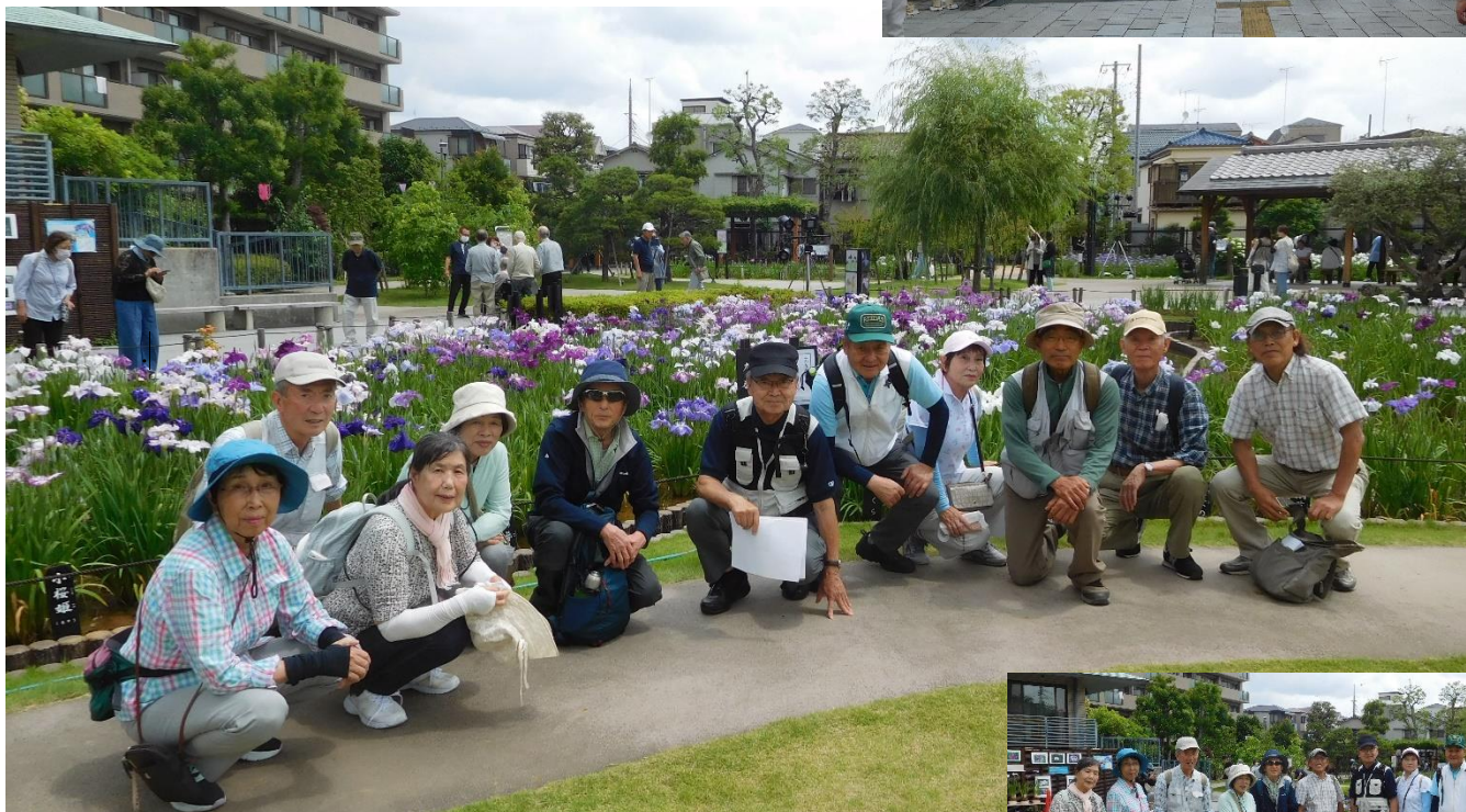
到着早々、菖蒲園で働く人に頼み集合写真を撮って頂きました。最初は立って撮った(右の写真)のですが、これでは肝心の菖蒲が見えないという事で、撮って頂いた方の強い勧めもあり、皆さん屈んで撮り直し。菖蒲園に来たという感じになりました、