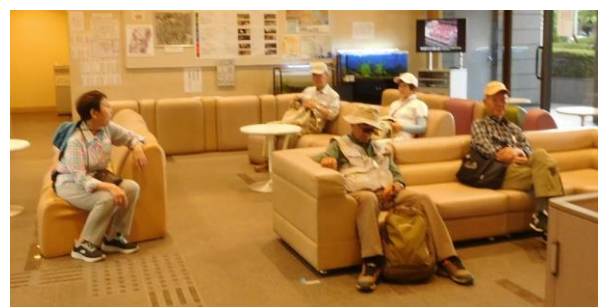
皆さんお疲れの様子。この後お花茶屋駅に向け15:00頃出発。