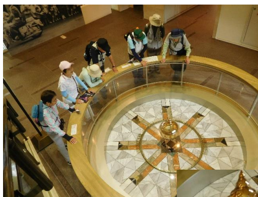
1本倒れるまで見ていました。