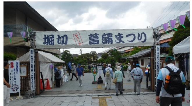
「しょうぶ七福神」を後にして 8分程度で「菖蒲園」に到着。(→)