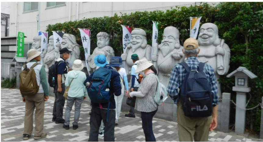
「十二支神」の近くにある「しょうぶ七福神」を見る。右は「堀切天祖神社」。大きな七福神像が圧巻でした。30年前に建てられたとの事です。