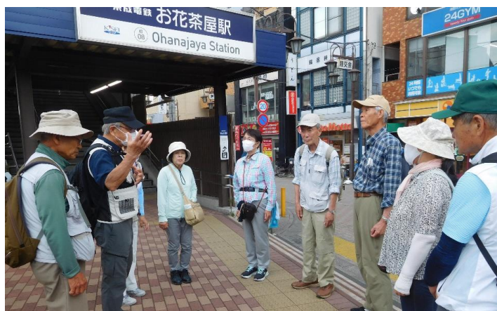
15:15頃「お花茶屋駅」に到着。ここで解散の挨拶をして、電車に乗り込みました。(→)

曇りで、そんなに暑くもなく、無事ハイキングを終えました。最後「葛飾区郷土と天文の資料館」を出たところで黒い雲が出ていましたが、雨にはならず、良かったです。菖蒲園も今が盛りで、楽しめたと思います。「堀切菖蒲水門」後は道が少々迷路の様で、目的地まで少々苦勞しました。1.2～1.3万歩ほど歩いたので、疲れたのではないのでしょうか。参加の皆様お疲れ様でした。