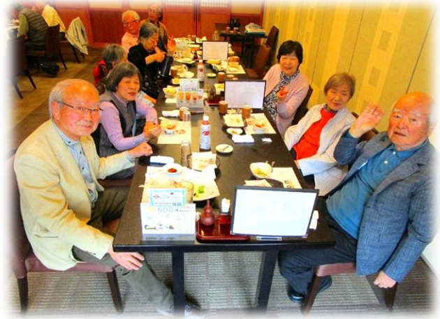
各クラブ・同好会の現状報告