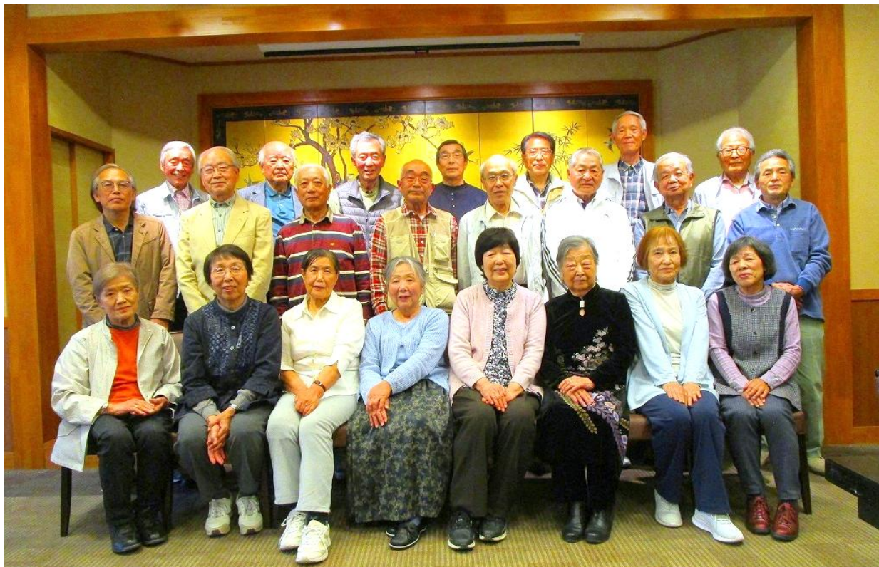
参加者全員での記念写真

46名で発足した三熊会ですが、半数近くの24名と減ってしまいましたが、参加された皆さんは元気潑刺とし、生きがいを持って人生を謳歌しているようです。三熊会が今後も末永く継続するようにご自愛され、次のイベントでも再会できることを楽しみにしています。