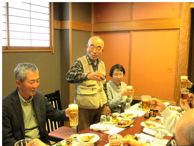
皆さんも、それぞれの飲み物で“乾杯！”