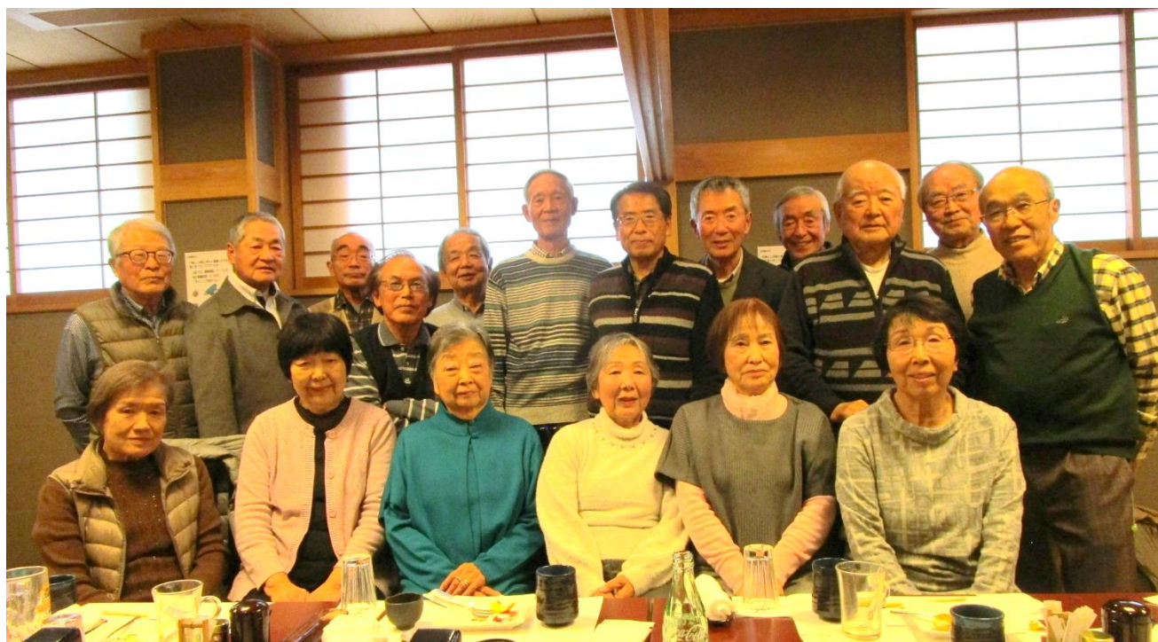
お開き前に集合写真

いきがい大学の入学から丸13年、三熊会設立から7年が経ちました。会員数も現在24名と少なくはなってきましたが、お集まりいただいた皆さまの御元気な姿、また「新年会」を楽しんで頂いた様子を拝見し、開催して良かったと思っております。