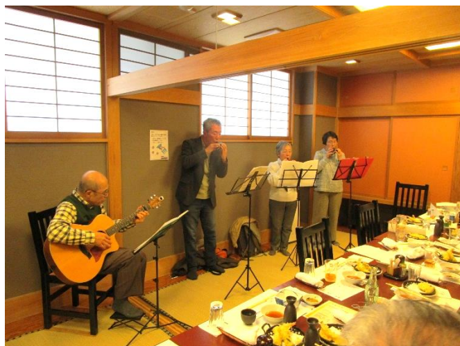
元「エシャレット」のメンバーによる ハーモニカ演奏