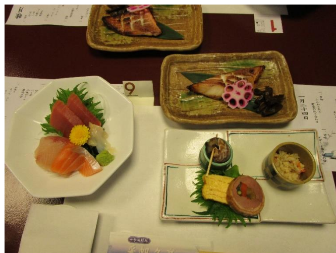
前菜・お造り・焼物