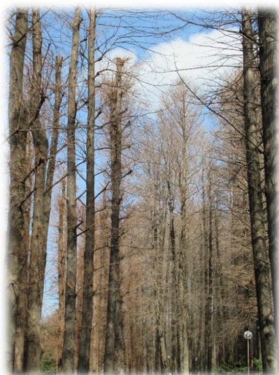
公園内のメタセコイヤ(和名:曙杉)の巨木が強い北風のため上部で唸っていた