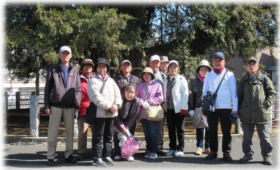
大カヤの前で集合写真を撮影