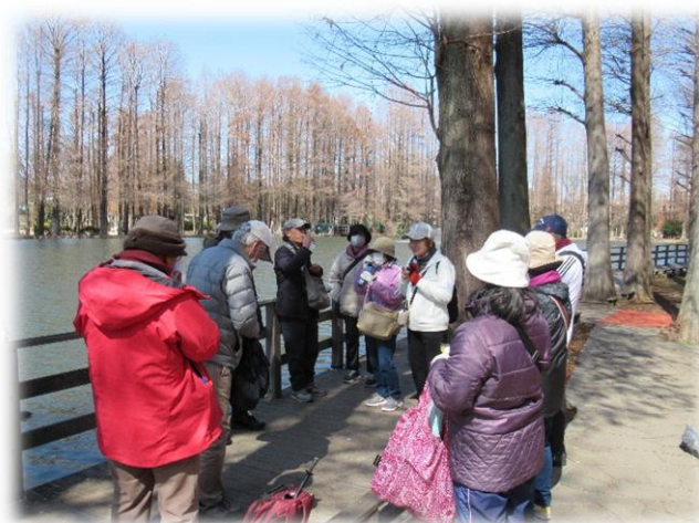
公園内で休憩。多くの鳩が餌を求めてしつこく寄ってきました