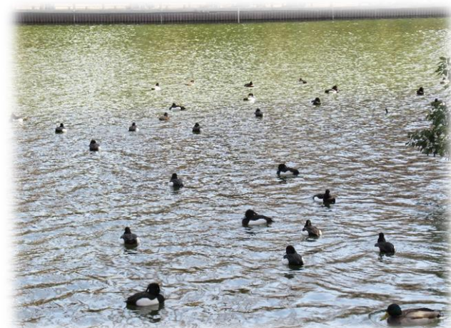
別所沼公園ではのんびり釣りをを楽しむ人や、鴨?が優雅に回遊していました