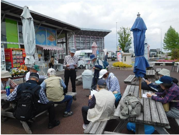
↑ 12:45 頃 昼食後次回ハイキングの説明を行いました。