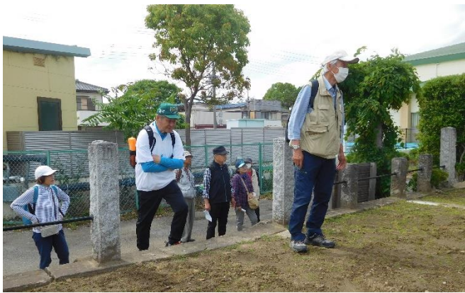
途中スーパーマルヤで休憩を取りながら、13:50 頃ようやく到着。北川辺西小学校区内にありました。