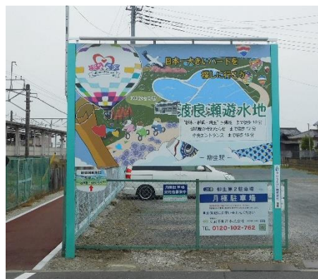
駅前に大きな看板がありました（下見の時はなかった）