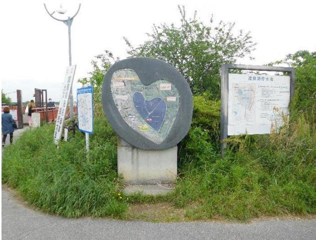
↑11:00頃 「中の島」入口にある説明看板