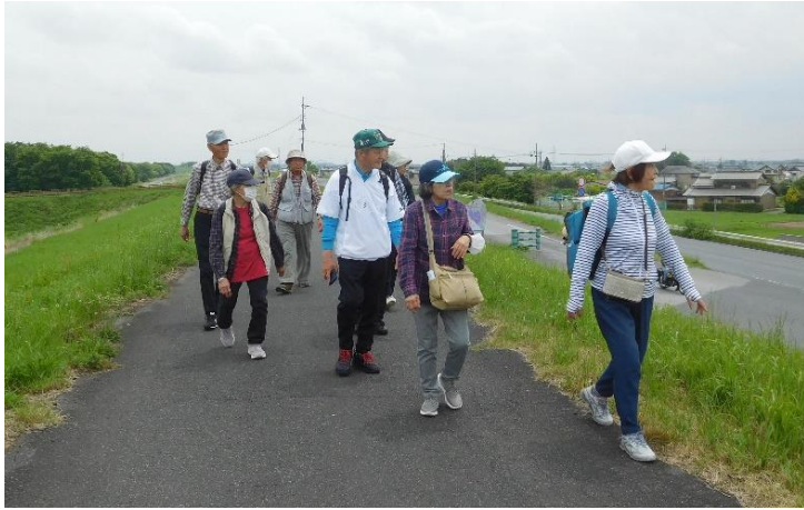
↑ 11 : 45 頃 道の駅かぞわたらせに向かって歩く