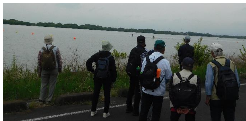
↑13:30頃 立ち止まり、暫しカヌー競技を観戦