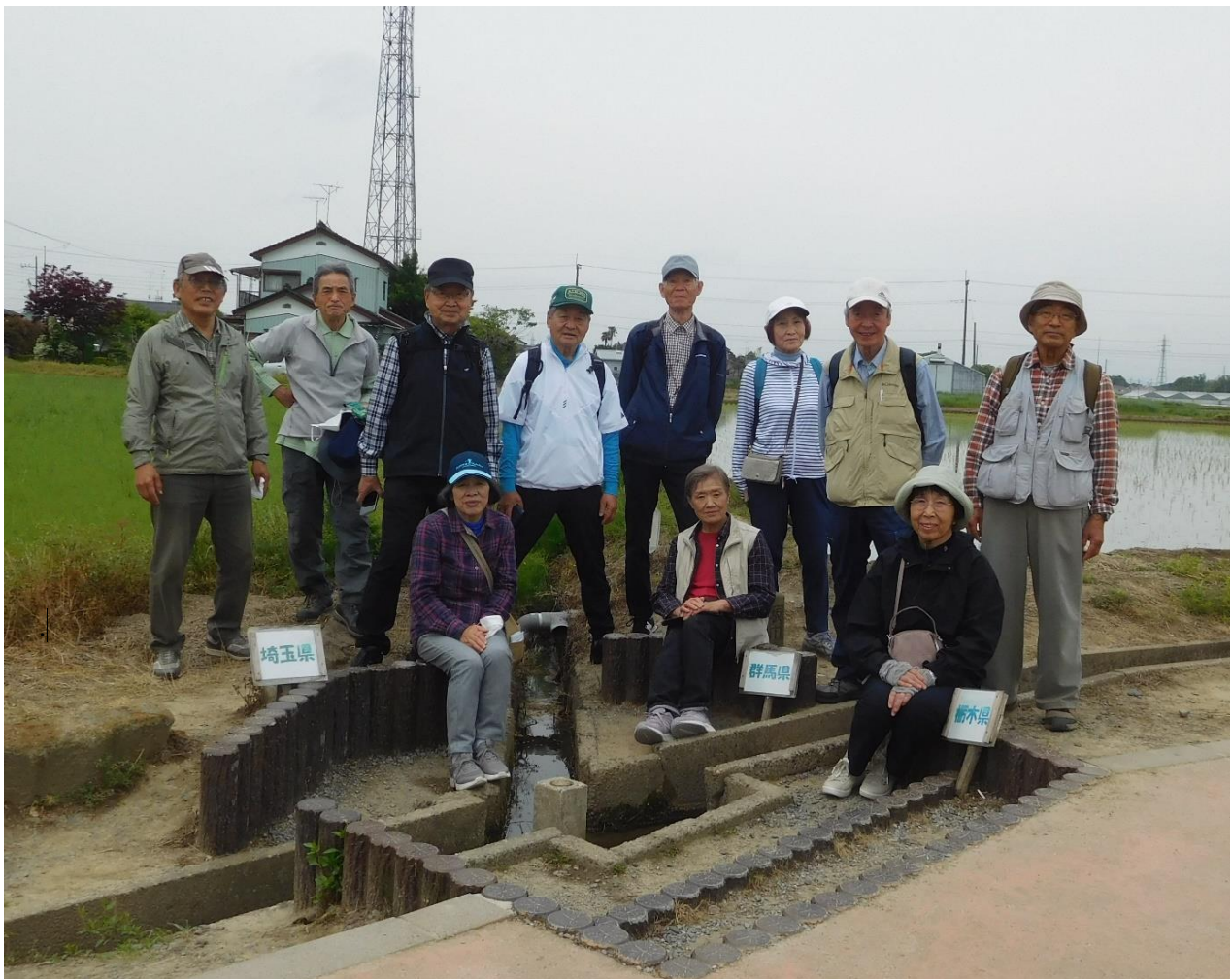
10:40頃 平地の三県境（群馬/埼玉/栃木）で各県にまたがり集合写真