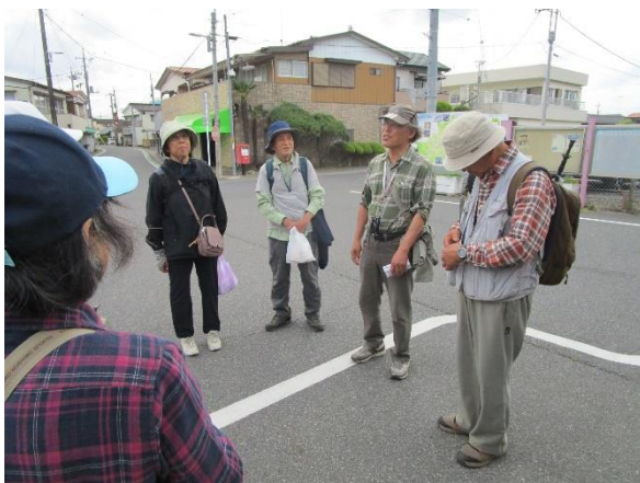
← 無事「柳生駅」に戻り、お疲れ様でしたの挨拶を行い解散としました。電車で帰る人は予定していた 15:01 発の電車で帰途につきました。