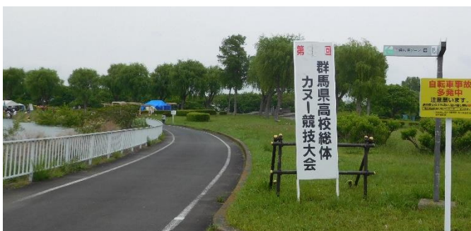
↑カヌー競技大会が行われていた。