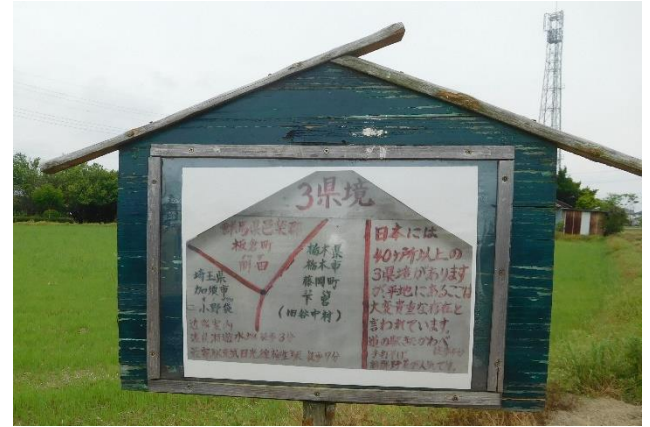
暫し興味深く観察していました