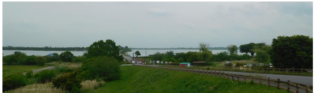
↑遊水地の「中の島」の入り口が見えてくる