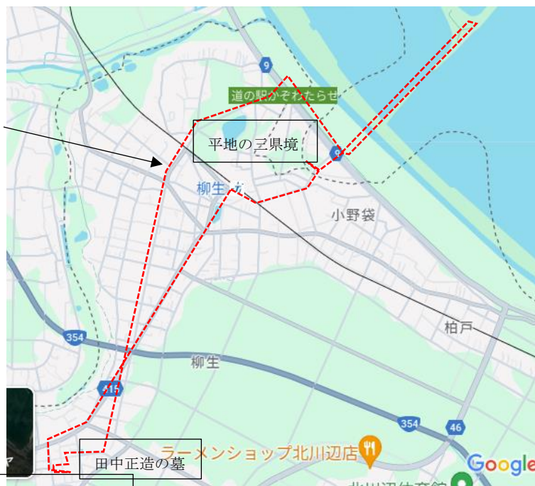
北川辺郷土資料館

今回は道を間違い歩 けなかった。道の駅を 出た後、柳生駅方面に 行ってしまった。