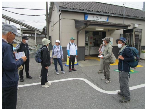
9:25頃柳生駅にて開始挨拶し散策スタート。

柳生駅に予定通り9:21に到着。車で来た人もおり、ここで11人全員揃う。柳生駅前でスタート挨拶を行い、まずは三県境を目指して歩き始めました。