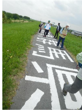
↑ 土手の上に県境を示す文字が書かれていました (栃木県/群馬県)