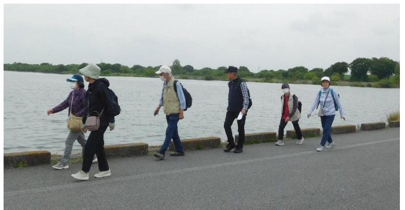
↑11:05頃 「中の島」に向かって歩く