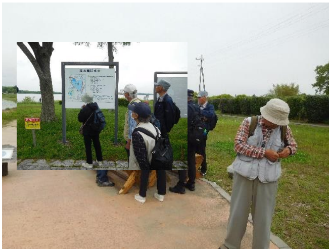
三県境で暫し休憩後、渡良瀬夜白地に向け出発