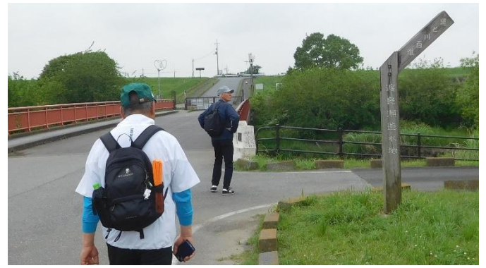
←中の島からの戻り ↑ 11 : 35 頃 「中の島」の入り口に戻る