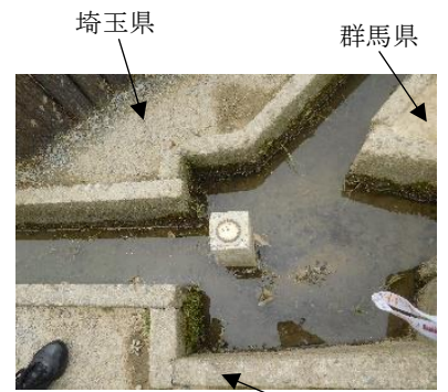
平地の三県境（群馬/埼玉/栃木）