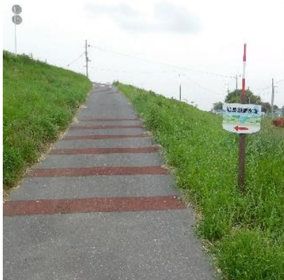
←遊水地へ標識に沿って進む。