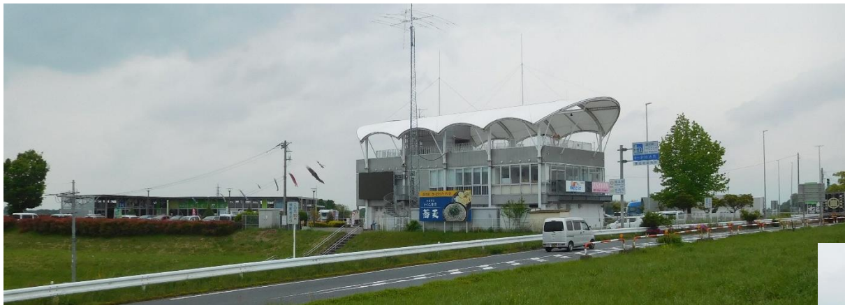
11 : 50 頃 アマチュア無線基地局、道の駅かぞわたらせ、さくら食堂があるところまで歩いてくる

展望台に上がり、上から遊水地を見る。展望台のところにハートのオブジェがありました。→