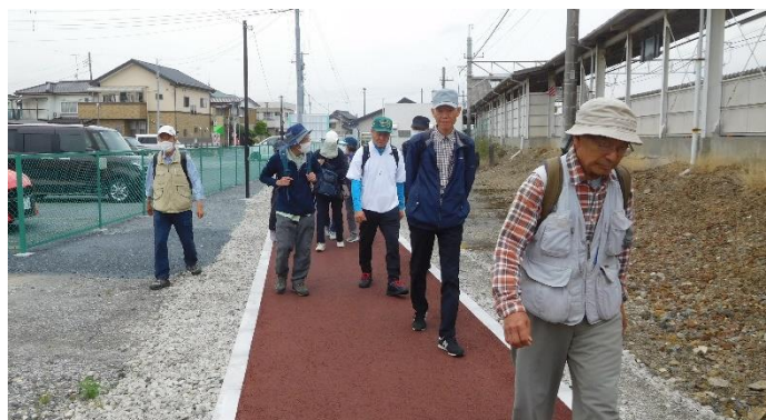
三県境に向かって歩き始める