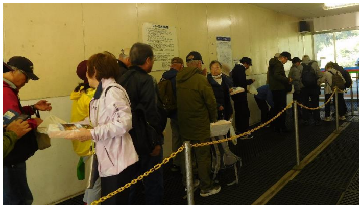
ガイドを見ながら乗車待ち

団体専用乗車口に並び、ガイドパンフレットを見ながら乗車を待ち、11:00に乗り込む。 車内からの景色に見とれていました。真下も見ることができました。二居湖・二居ダムの眺め、紅葉の山々の風景、天気も良く楽しめました。