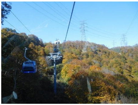
降りてきた方向を見る