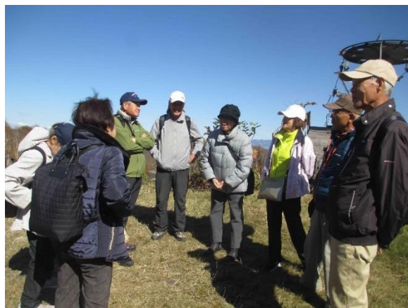
パノラマリフト頂上付近にて

パノラマリフトで登った人達が、降りてきて全員揃ったところで集合写真を撮りました。