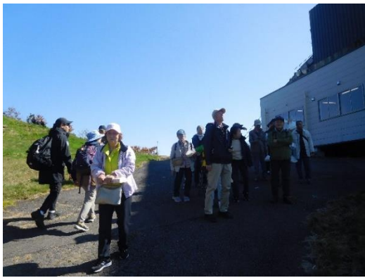
苗場ドラゴンドラに向け歩き出す