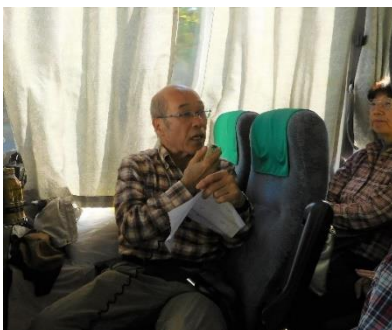
会長より行程説明

9:20過ぎ赤城 PA でトイレタイム。赤城 PA を出発した後、会長より旅行行程の説明を行って頂きました。