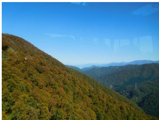
ロープウェイからの眺め

団体専用乗車口に並び、ガイドパンフレットを見ながら乗車を待ち、11:00に乗り込む。 車内からの景色に見とれていました。真下も見ることができました。二居湖・二居ダムの眺め、紅葉の山々の風景、天気も良く楽しめました。