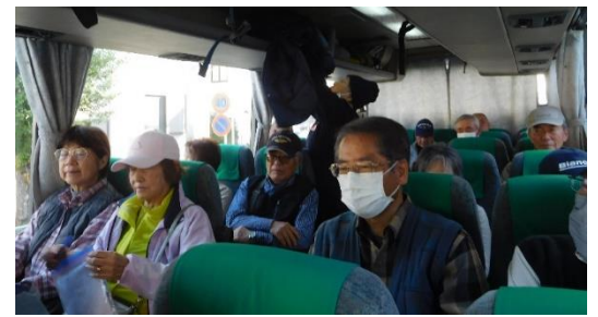
出発後直後の様子

花園インターで関越道に乗る。今日は快晴で既に日差しも強く車内は暑くなり、エアコンを入れてもらいました。