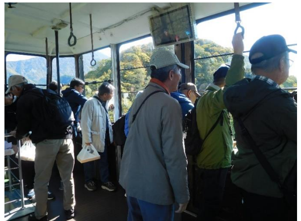
ロープウェイからの眺めを楽しむ →