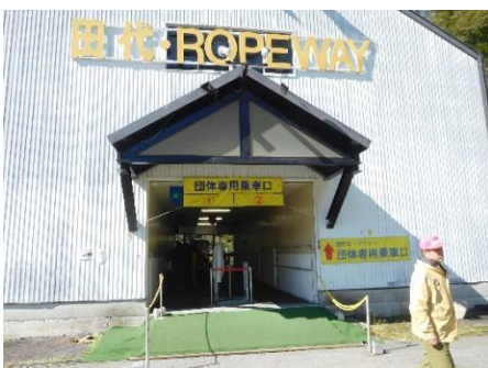
田代ロープウェイ乗り場