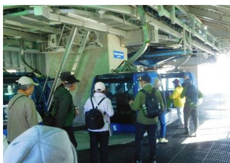
ドラゴンドラに乗り込む

13:00頃ドラゴンドラに乗り込み下山。全長5.5km、途中ジェットコースターのような急下降、急上昇も有る空中散歩、そして雄大な景色を堪能しました。