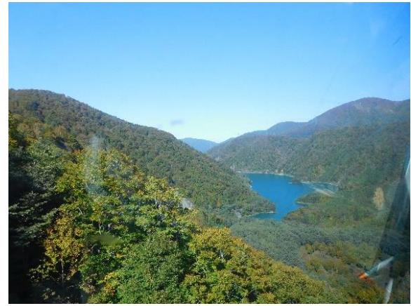
ドラゴンドラからの二居湖

苗場を後にし、川場田園プラザに向かう。その間に ビンゴゲームをして楽しみました。