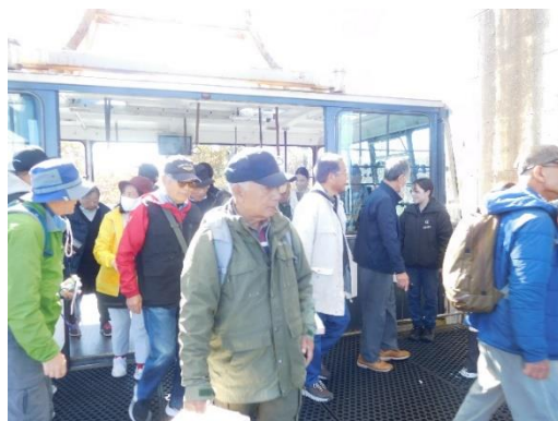
田代ロープウェイ山頂到着

11:10頃田代ロープウェイ山頂駅に到着。 とりあえずレストランアルム・苗場ドラゴンドラ山頂駅 に向け歩いて降りることに。