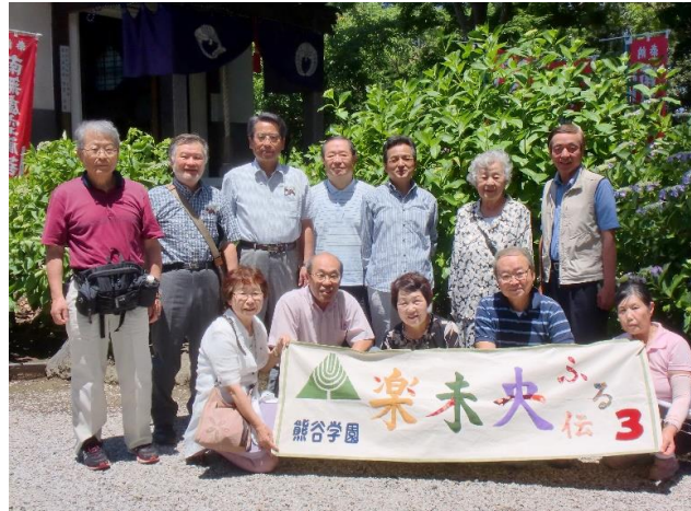
「ふる伝応援旗」を前にA班全員で集合写真