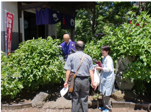
副住職と若奥様にご挨拶するTリーダー

課題学習で能護寺を取り上げたA班は、能護寺の縁日で虚空蔵菩薩の御開帳の日でもある毎年6月13日に皆で集まり、能護寺のあじさい観賞も兼ね昼食会を実施する事としました。本日(6月13日)集まりが開催され、A班12名全員が集まり、楽しい時間を共有しました。