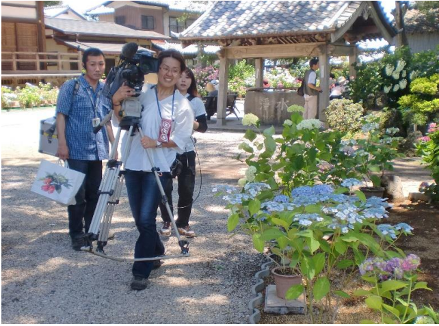
今日はNHKのカメラも入っていました。