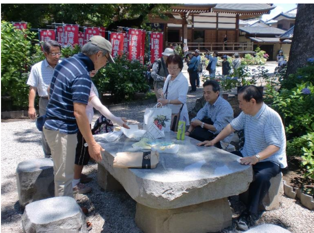
皆さん持参のお菓子、お饅頭、副住職から頂いたお供えのお下がりのバナナで腹ごしらえ(?)