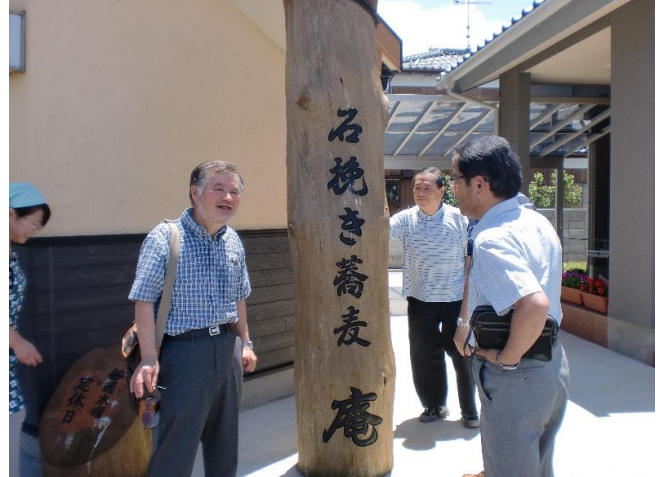
能護寺近くの蕎麦屋「庵」にて昼食会