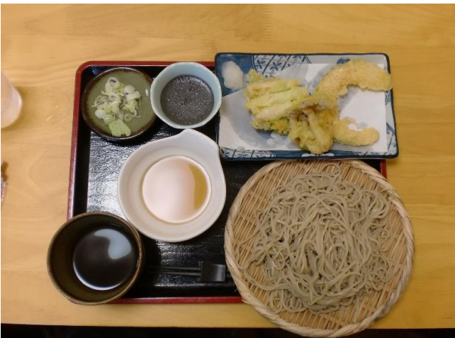
2:8そば+野菜3点天ぷら+黒胡麻プリン