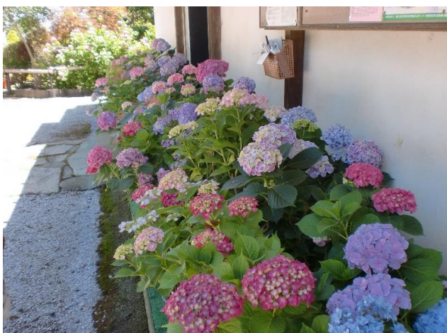
いつも鮮やかなあじさいの鉢植え