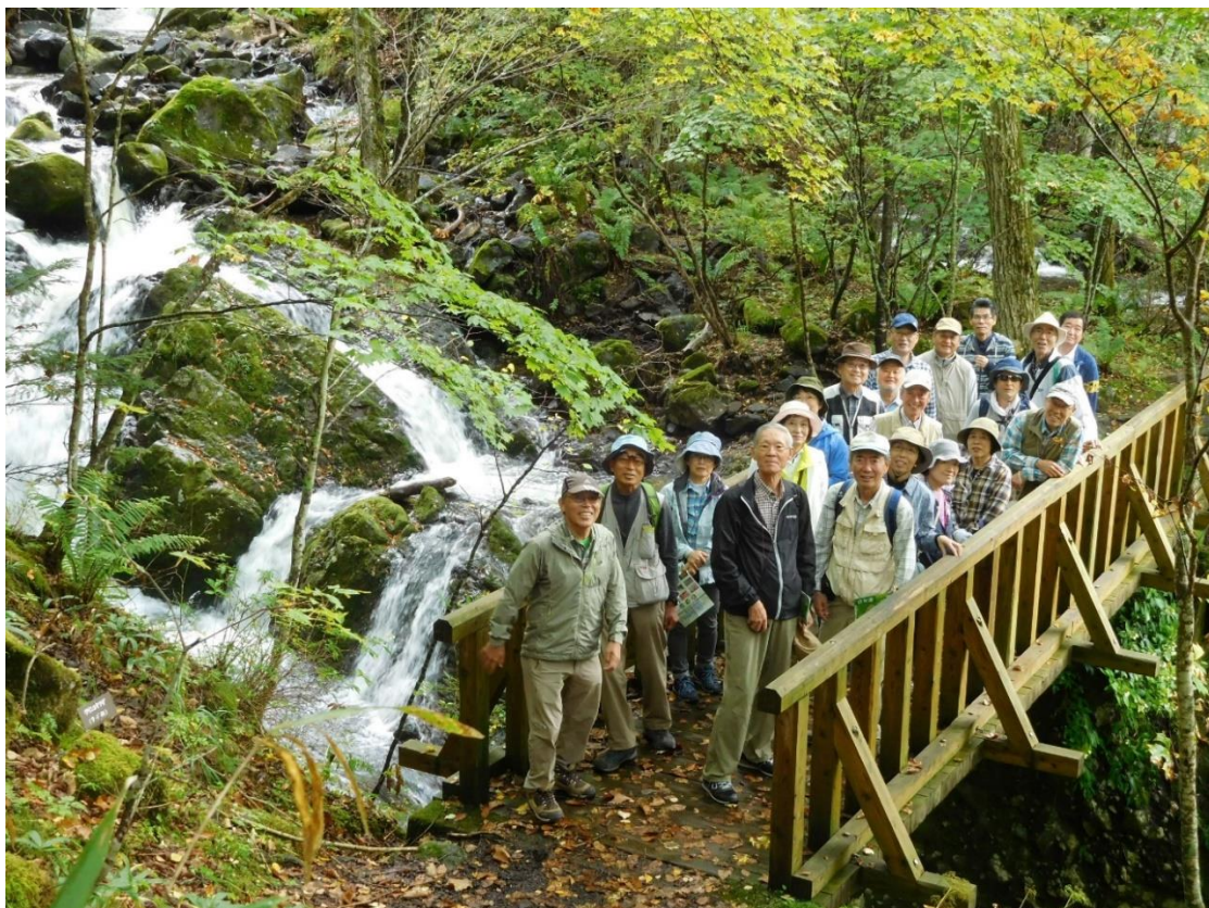
もみじ橋上にて (S氏も間に合いました)