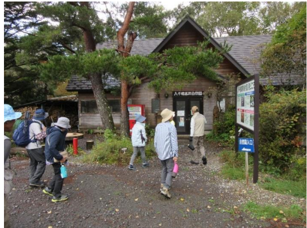
八千穂高原自然園に到着