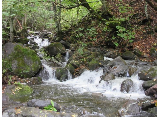
雨後でたっぷりの水