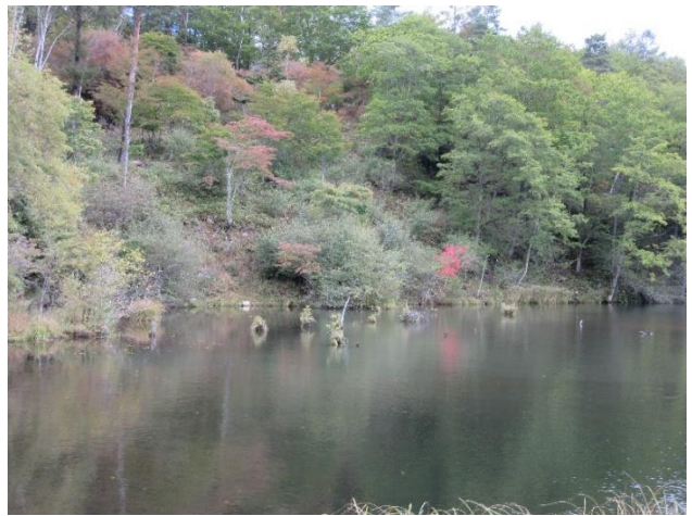
遊 亀 湖